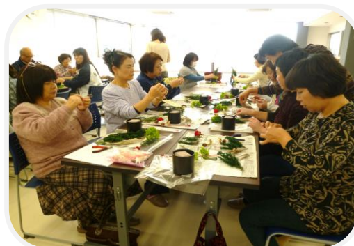
手先を器用に使い作成中

町民の皆さんで楽しいひとときをとの思いから横浜市より講師のFlower Concertoの方が4名で来られ、初めての方でも解かりやすく、基礎からのプリザーブドフラワーアレンジメントを教えていただきました。参加者の皆さんそれぞれの個性豊かな作品が出来上がりました。