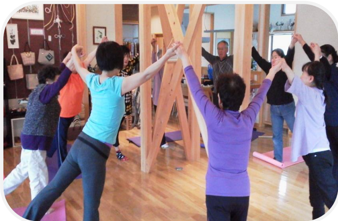
楽しくヨガを体験する参加者の皆さん

の須賀川や県中地域の方など、多くの皆さんに“縋りあい処 空間”にお出で頂き、避難生活のいっときを楽しく有意義にしてほしい。」と呼びかけています。