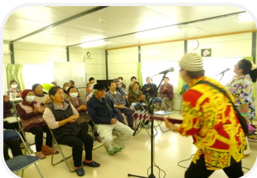
ふたりのメロディーにくぎづけ

12月5日（木）東京都世田谷区から来られた面白ユニット「めおと楽団ジキジキ」による感動あり、爆笑あり！のミニステージがいわき地区仮設2か所で催されました。ジキジキさんのお二人は、「ひと時でも笑顔になり笑っていただけるだけで来た意味があると思って支援を行っている。」と話され、最後まで笑いの渦に巻き込み、とても楽しいミニステージとなりました。