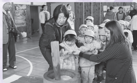
もちをつく児童たち

つきあがったもちは、「つゆもち」「あんこもち」「きなこもち」にして、みんなで美味しくいただきました。