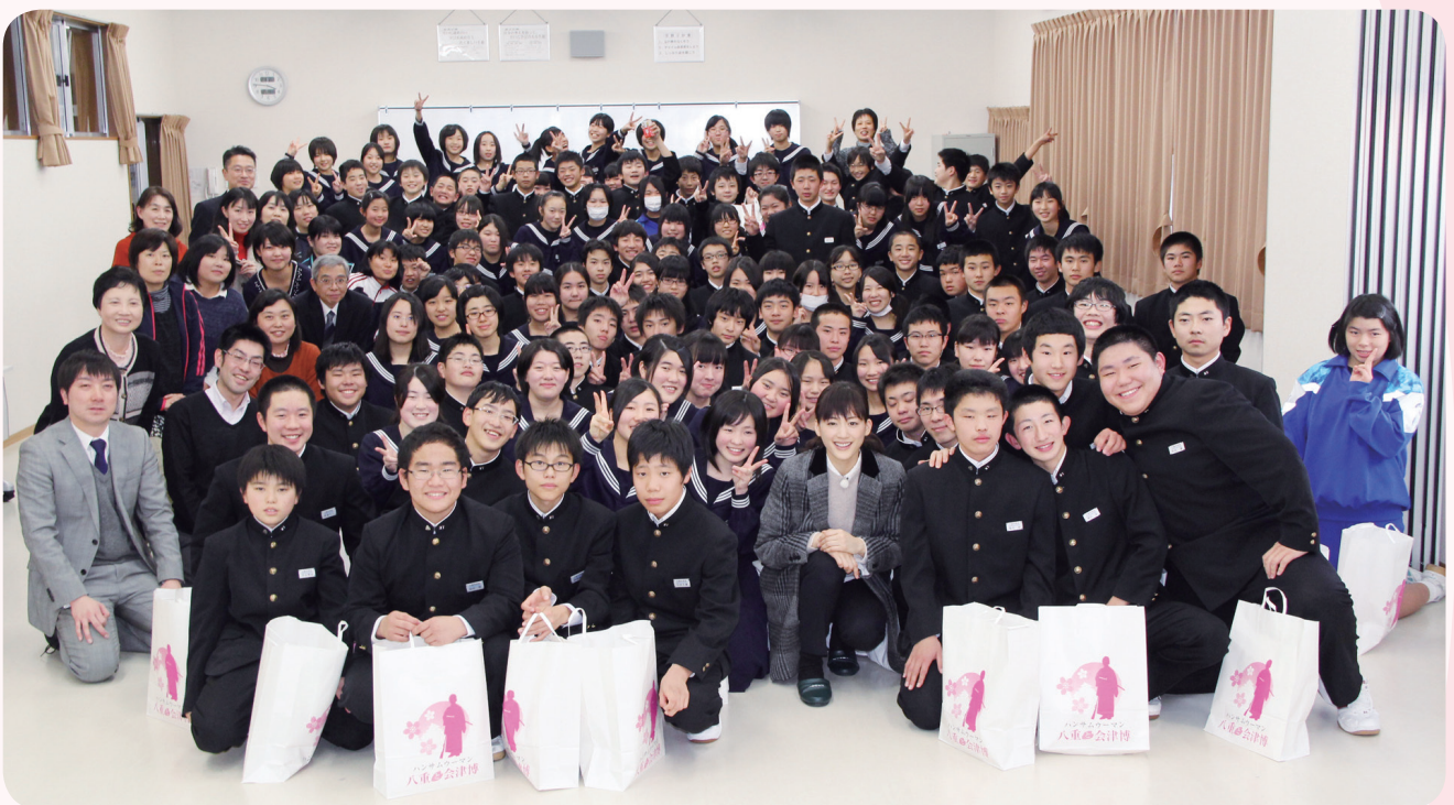
綾瀬さんを囲んでの一枚

綾瀬さんは、前日にも会津若松市内12カ所の仮設住宅を訪問し、避難している町民の皆さんを激励しました。