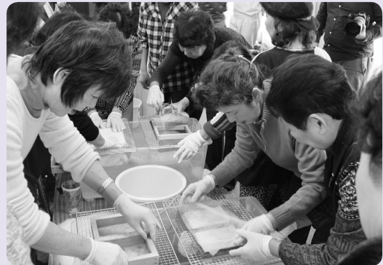
和紙すきに取り組む参加者

大熊町から柏崎市で避難生活を送っている懐かしい人もやって来て、柏崎市、会津若松市のお互いの近況を報告し合いながらの楽しいひとときとなりました。