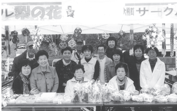
サークル梨の花の皆さん

渡辺町昼野応急仮設住宅内のサークル「梨の花」の皆さんが10月6日、陸上自衛隊福島駐屯地で開催された創立60周年記念行事に参加しました。出展したブースでは、サークルで製作した籠や人形などの手芸品を販売し、会場を訪れた大勢の人たちとのふれ合いを楽しんでいました。