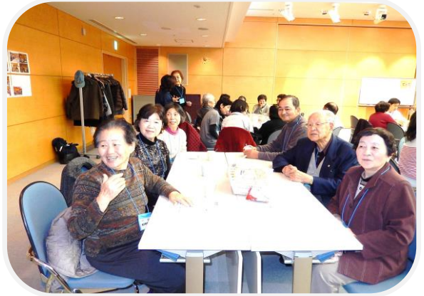
「てとて」に集う大熊町民の皆さん

このサロンでは、健康教室や趣味の講座、ゲーム大会、歌や演奏、温泉に入っでの保養、更にミニ旅行などとバラエティーに富んだ内容となっています。大熊町民の参加も多く、とても好評で、「次回のテーマは何か？開催が待ち遠しい。」「こんどは何処に行くのかな、ミニ旅行が楽しみ。」などと期待が寄せられ、参加者から待ち望まれております。まだ、参加されたことのない方もぜひ一度会場にお越しください。お待ちしております。