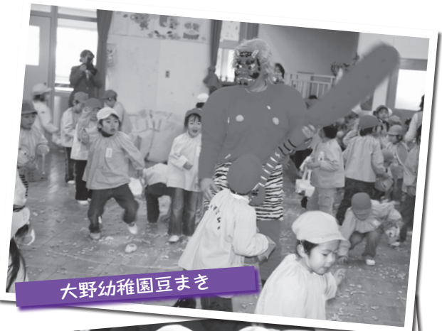
大野幼稚園豆まぎ

※掲載する文章は、インタビューした内容をもとに記者が作成しますので、インタビューをお受けいただいた方が文章を作成する手間はございません。