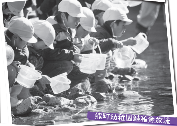
熊町幼稚園鮭稚魚放流