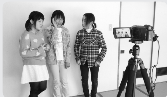
将来の夢を話す中学生たち