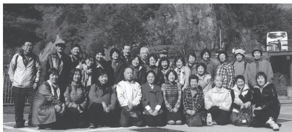
参加者で記念撮影

「おおくま町会津会！田子倉ダム遊覧船・柳津虚空蔵尊日帰り研修」を11月6日に開催し、秋晴れの中32名が参加しました。