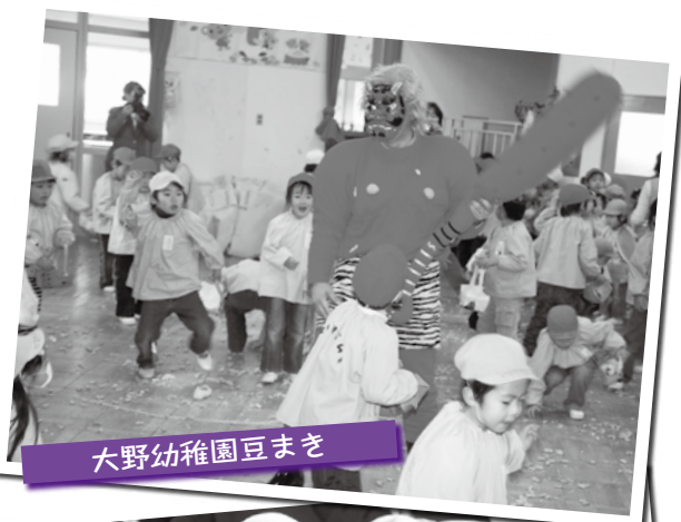
大野幼稚園豆まき

※掲載する文章は、インタビューした内容をもとに記者が作成しますので、インタビューをお受けいただいた方が文章を作成する手間はございません。