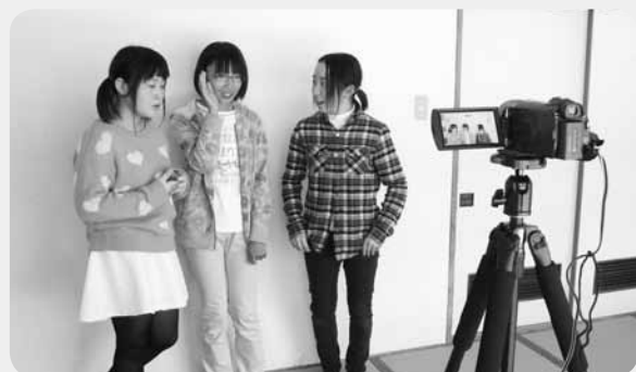
将来の夢を話す中学生たち