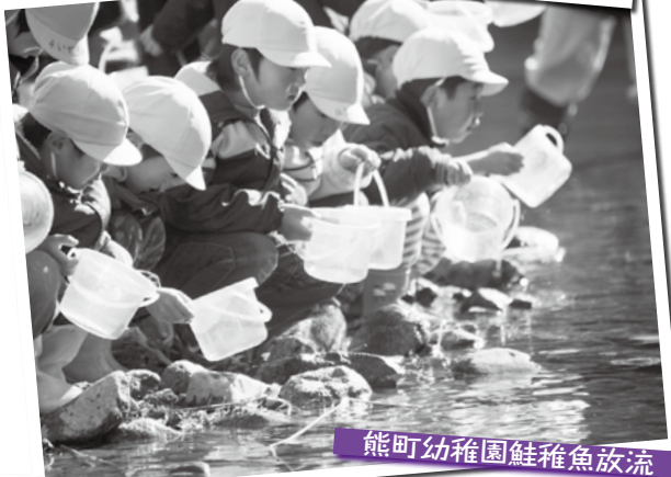
熊町幼稚園鮭稚魚放流