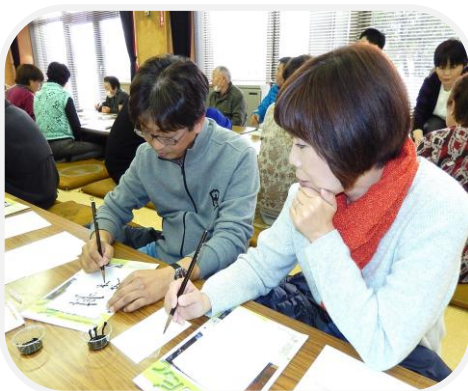
「新年の書初め」に挑戦する参加者

伊達市社会福祉協議会では、伊達市内で避難生活を送られている方を対象に、「気軽に集える憩いと安らぎの時」を過ごしていただければと、保原中央公民館をメイン会場として、「げんきが〜い」の名称でサロンを開いております。