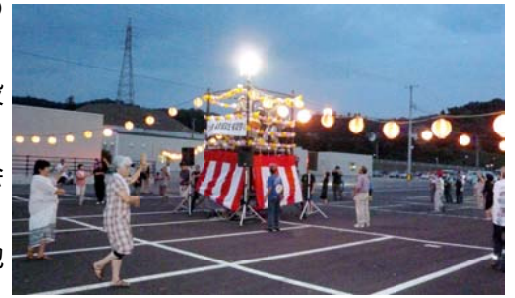
長原仮設住宅盆踊り