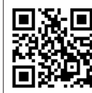
労働安全衛生 総合研究所 ホームページ

国内で取り扱われている化学物質の中には、危険性や有害性を持つ物質が多くあるため、労働者が安全に働けるように化学物質規制があります。労働安全衛生法関係法令の改正により、4月から職場での化学物質規制が大きく見直しとなっています。詳しくは、労働安全衛生総合研究所ホームページをご覧ください。