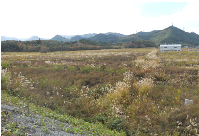
雑草に覆われた除染予定地