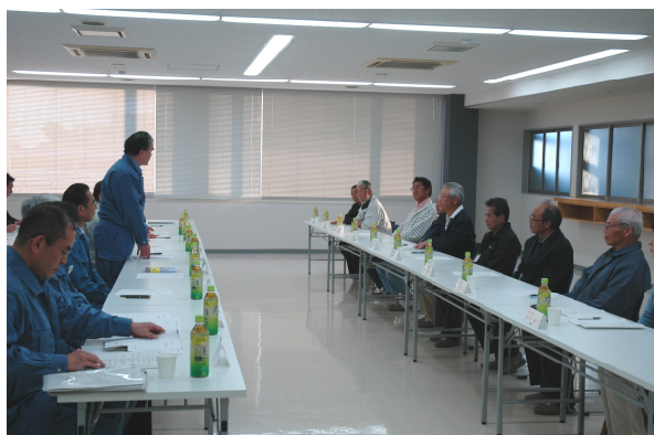
町民と懇談する平野大臣