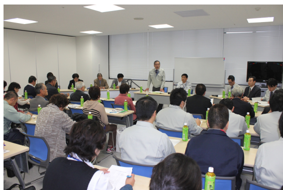
全体会議であいさつする町長

各部会は、11月から2月までの期間に3～5回の会議を開催し、意見集約を行います。そして、今年度は平成25～27年度の間3年間の短期的な課題の解決に焦点をあてて議論していきます。また、この課題について