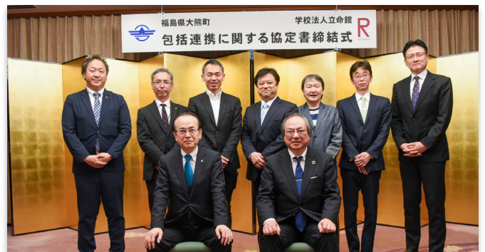
協定式で記念撮影に収まる町、立命館関係者ら