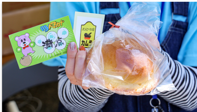
満点の myベアカードと交換できた UFO パン

当日は来場者限定の「myベアカード」が配布され、買い物やトークショーを楽しんでポイントを集めると、駅前商店街で営業していたカムラ洋菓子店さんの UFO パンと交換できる特典がありました。