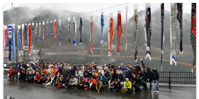
集合写真に収まる参加者ら

春の坂下ダムウォーキング2024が4月6日、大川原地区で開かれ、約200人が参加しました。