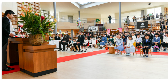
南郷園長・校長のあいさつを聞く子どもたち