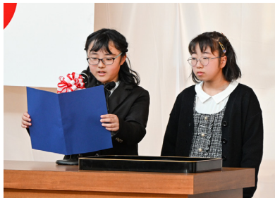
送辞を述べた在校生ら