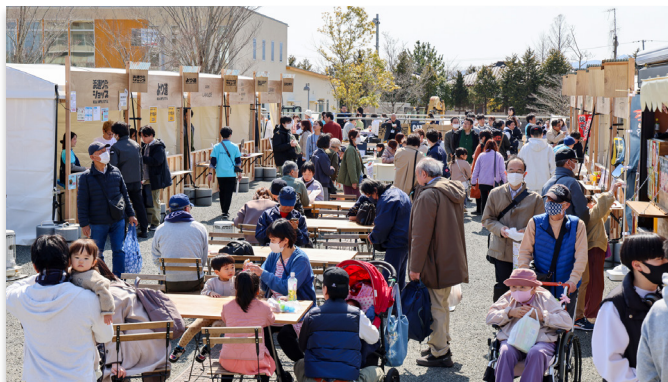
来場者らでにぎわう会場

開発の進む JR 大野駅西口のにぎわい創出や町民間の交流促進を目的としたイベント「おおくま商店祭」が3月16日、KUMA・PRE で開かれました。