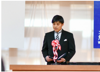
式辞を述べる南郷校長