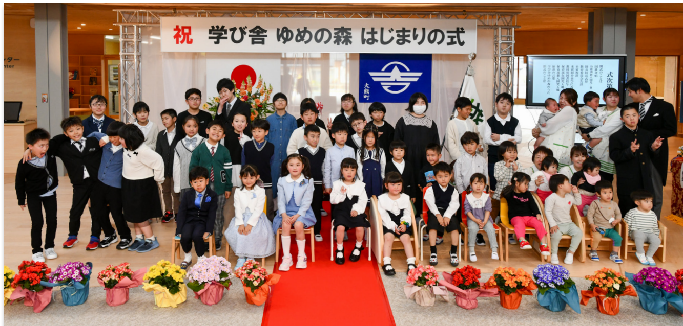
集合写真に収まる子どもたち