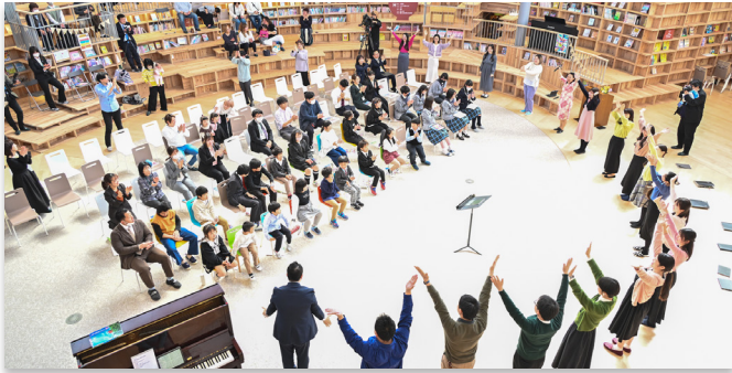
全身を使って曲を楽しむ合唱団

心に花を咲かせよう合唱団の「心の復興コンサート in 福島～能登半島地震復興への願いを込めて～」が3月16日、学び舎ゆめの森の図書広場で開かれました。