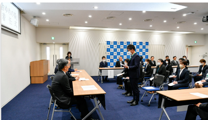
着任のあいさつをする猪狩教頭（中央）

町立学び舎ゆめの森の着任式は4月1日、大熊町役場で行われ、16人が着任しました。