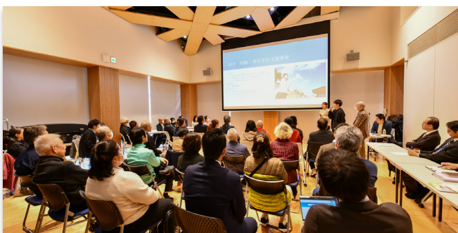
自己紹介や自身の業務を報告する支援員ら

町民間のコミュニティ作りや地域活性を担う目的として委嘱している復興支援員の報告会が3月27日、大熊町役場で行われました。