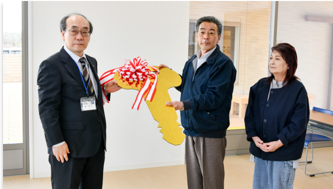
入居代表者に鍵のレプリカを手渡す島副町長

下野上地区に完成した原再生賃貸住宅と大野南再生賃貸住宅の鍵引き渡し式、入居説明会が3月28日、それぞれのコミュニティスペースで行われました。