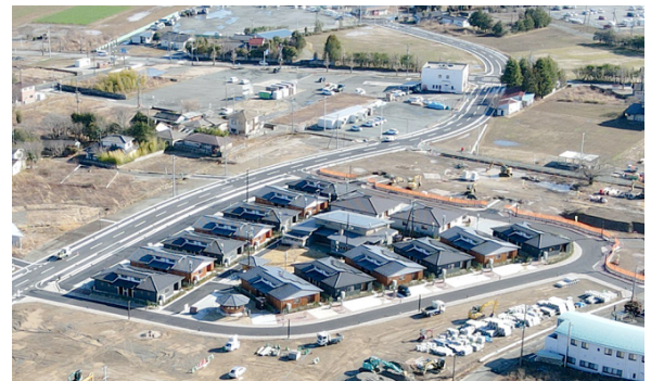
大野南住宅エリア