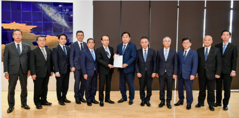
赤羽本部長への要望

町は、富岡町、双葉町、浪江町とともに公明党東日本加速化本部に対して町の復興・再生に向けた要望・意見交換を行いました。