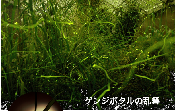
ゲンジボタルの乱舞