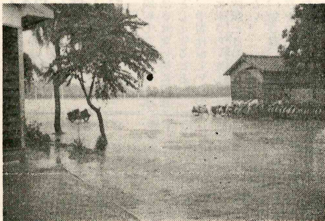
【7月1日午後】雷鳴と共に降雹する。

まず各家庭では、この休み中は健康の保持にじゅうぶんに注意し、ひとりひとりの子どもの年齢や平素の体力を考えて、できるだけ体力を鍛えることが、こ