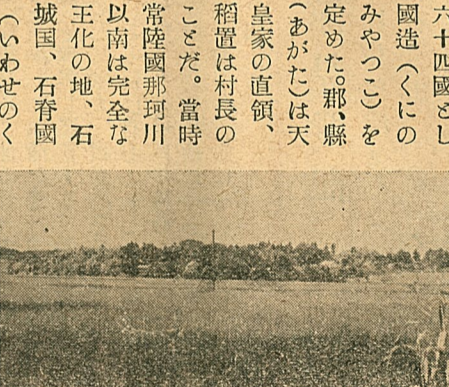
古代柵跡 女迫・小館を望む

新開田七〇町歩の見込人力は常に自然を改造し利用する。億余の予算と數ヶ年の歳月を費した小塚溜池(野上川上流)が遂に完成し満々たる用水をたゞいて居る。貯水量 約五七萬立方メートル 堤防高 最高二四米 堤防幅 上巾六・五米 波返二・六米 計一〇・一米 下巾一・二六米 之により野上原開墾地七〇町歩が黄金波打つ一帯の水田となる見込。