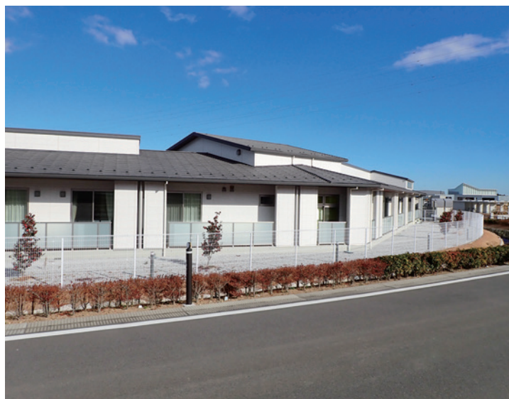
グループホーム「もみの木苑」 16名入所中

引き続き、サロンやサークル等のコミュニティ団体について、活動状況等に関する情報収集、そして課題の把握などに努めながら支援に取り組んでいく。