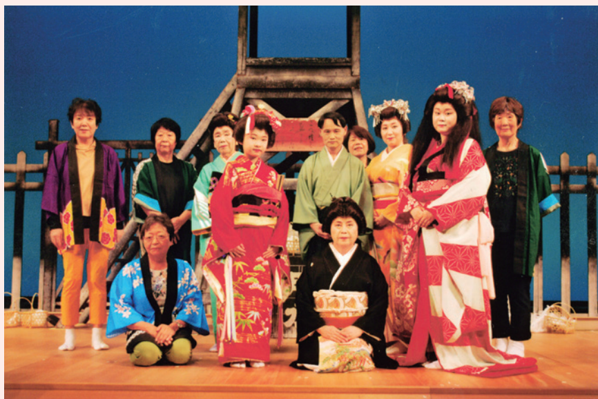
藤咲流松寿会舞踊発表会 絆舞う～郷愁編～ 令和5年8月27日(日)