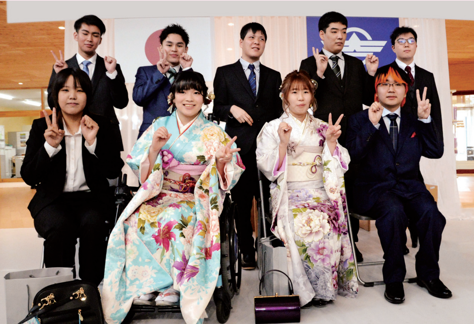
学び舎ゆめの森で夢と希望に向かって（1月7日 二十歳の成人式）