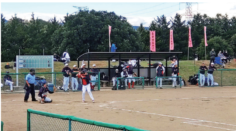
スポーツで心も体もリフレッシュ