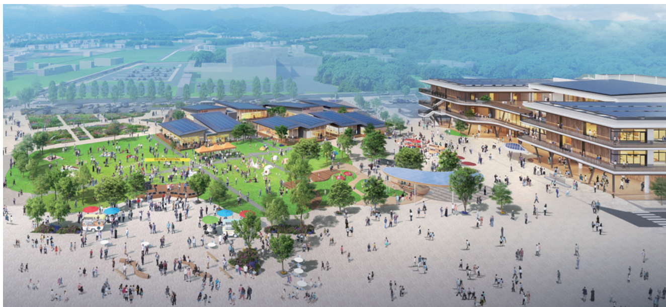
多様な交流が生まれ賑わいが戻る施設へ