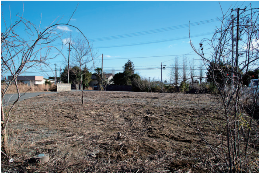
こんなにきれいになりました