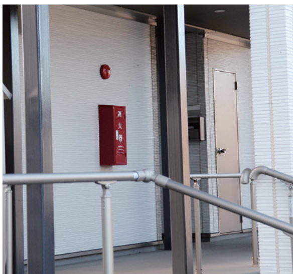
消火器の設置場所を確認しよう

大川原地区にある災害公営住宅や下野上地区に建設中の再生賃貸住宅全戸に消火器を配付する事業であり、火災発生時の初期消火に備えます。