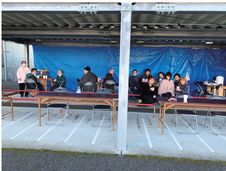
団地の人たちがくつろぐひとときです

高齢者や障がいをお持ちの方に限らず、ひとりでも多くの皆様に参加していただけるようこれまで以上に開催時期や場所、そして時間等を検討し実施していく。