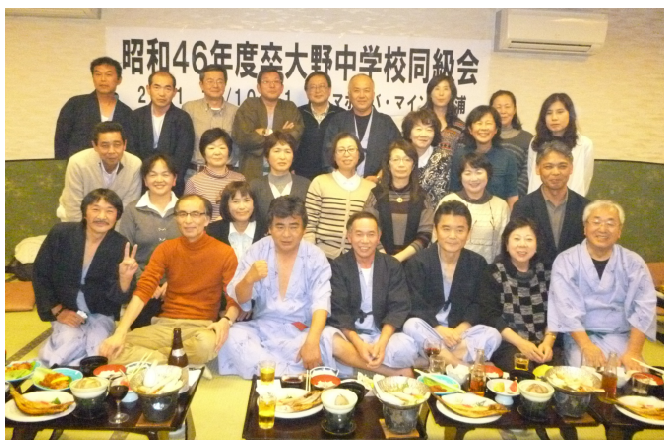
(昭和46年度卒大野中学校同級会)

多くの人に支えられている喜びを感じながら、大熊中学校の後輩へ私たちの想いを寄せ書きとして贈ることにしました。次回は来年、いわき市で開催する予定です。