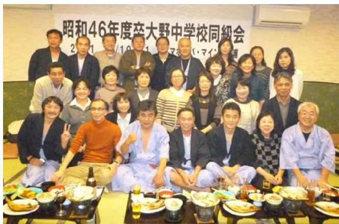
(昭和46年度卒大野中学校同級会)

多くの人に支えられている喜びを感じながら、大熊中学校の後輩へ私たちの想いを寄せ書きとして贈ることにしました。次回は来年、いわき市で開催する予定です。