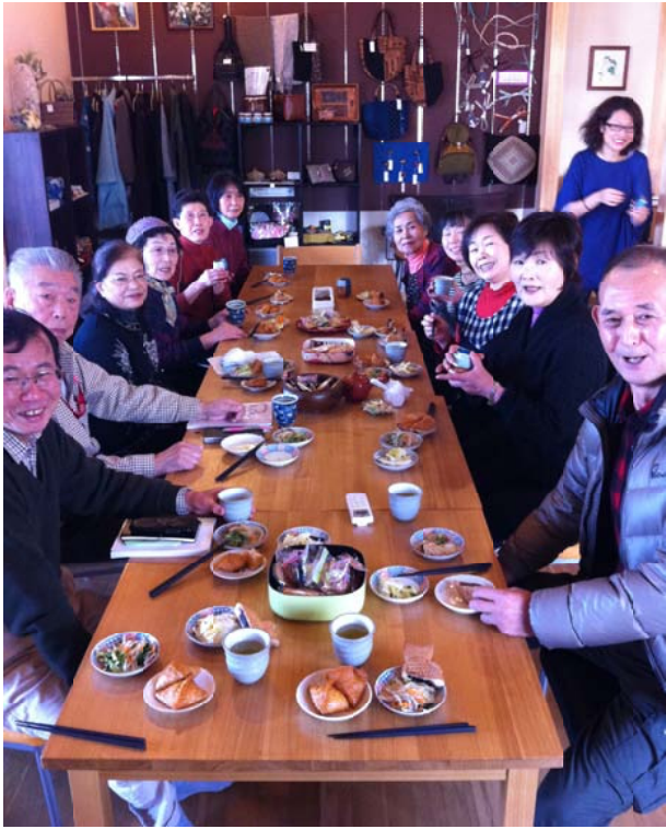
お昼ごろには12人が卓を囲みました

◎大熊町民の皆さんへメッセージ シをお願いします ここへは、どなたでも、男 女や年齢の別なく、いらっし います。今のところ子どもた ちは来ていませんが、子ど もたちも歓迎です。 何か相談事のある方でも、 とくに困っていることのない 方でも、ここへたまに顔を出 すと、いろいろな話やつなが りができます。 もし、みんなで勉強をした いねということになれば、勉 強会や講演会もやります。双 葉郡の方をお呼びして音楽を