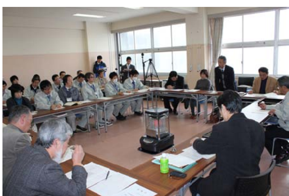
方向性の確認を行いました。