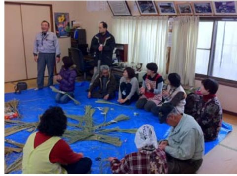
公民館でしめ縄作りをしました