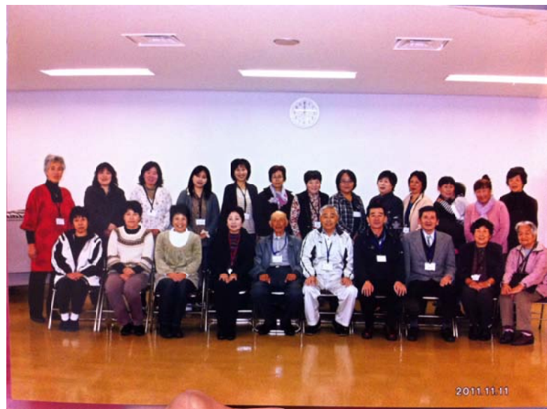
第一回(上)、第三回(下)の集合写真

「定例会だけではなく色々な方との交流もありました。中越地震の被害にあった山古志へ行つて、自分達も何ができるのかを勉強しようという意見があり、協力してくださる方々の支援で実現しました。その時も山古志のみなさんから「私達も大変でしたがこうして復興できたから、頑張つて下さい」と声をかけていただきました。嬉しかったです。」 「今回の忘年会では、中越地震で被災した村のひとつ、川口村のみなさんが参加してください、とっても楽しい忘年会になりました。餅つき、蕎麦打ち、しめ縄作りと笑いのたえない日になりました。みなさんに心から感謝です。」