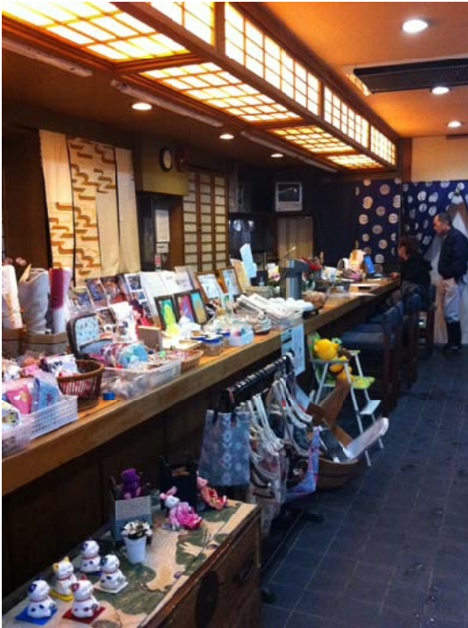
サロンの中の様子 <アクセス>