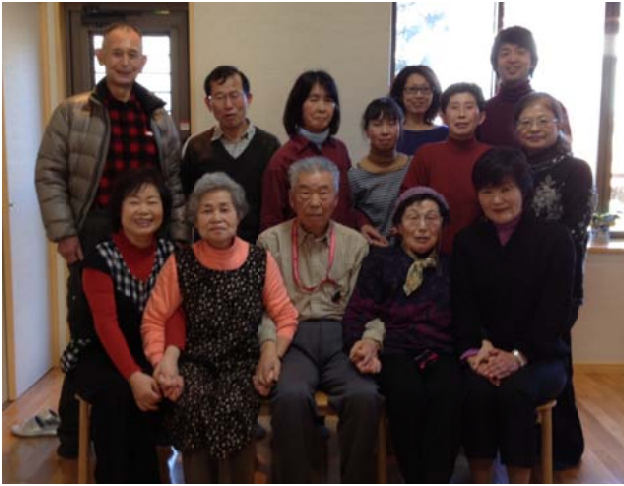
この日集まった皆さん