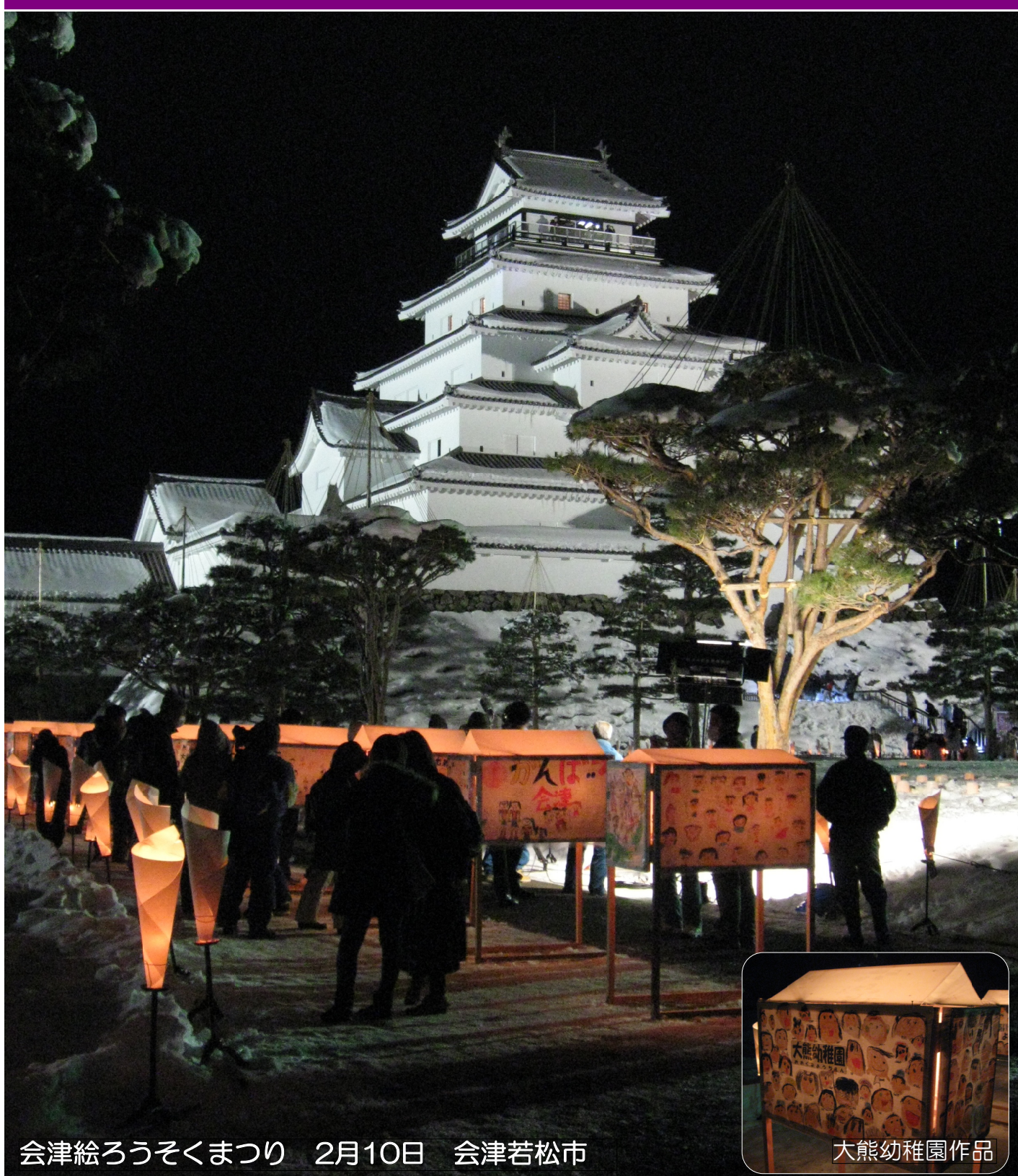
会津絵ろうそくまつり 2月10日 会津若松市

発行：大熊町役場企画調整課 所在地：福島県会津若松市追手町2番41号 電話：0242-26-3844（代表） E-mail:okuma@town.okuma.fukushima.jp ブログ大熊町 http://blog-okuma.jugem.jp/ 大熊町公式ホームページ暫定版 http://www.town.okuma.fukushima.jp/