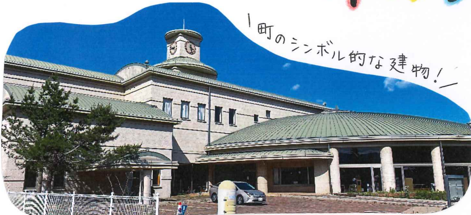
町のシンボリックな建物!

解体が予定されている町の図書館。先日、希望者に対し館内にある図書の無償譲渡(リサイクル)が行われたので参加しましたよ☺