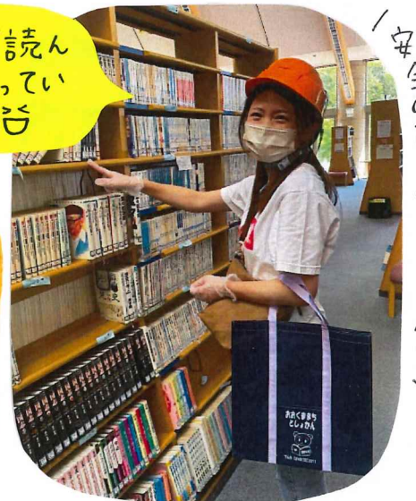
安全のためヘルメット着用!