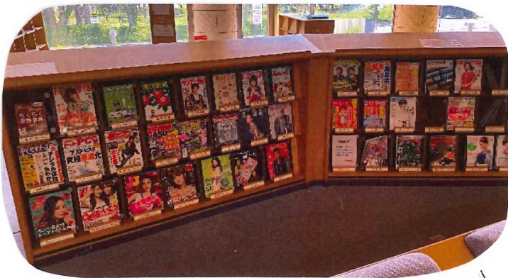
個人的に大好きだった雑誌コーナー! 最近のファッション誌もあってうれしかったなあ♡

館の解放は当初4日間の予定でしたが問い合わせが多数あり、日程を追加して行ったんだとか! 改めて町民に愛されていた場所だったんだなと思いました♡