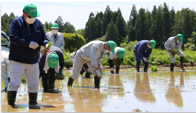
試験田に苗を植える町農業委員ら

中屋敷と熊の2地区で水稻の試験栽培が始まりました。5月10日に田植えが行われ、町農業委員ら関係者約20人が熊旭台の試験田1.8 アール aに天のつぶの苗を植えました。