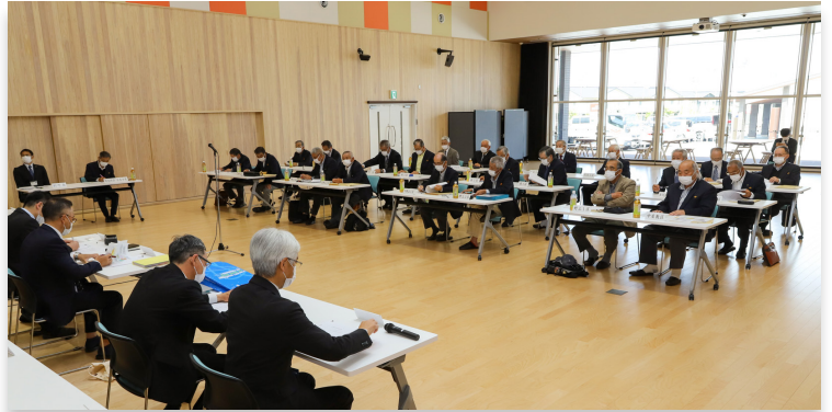
町から重点事業の説明を受ける行政区長ら