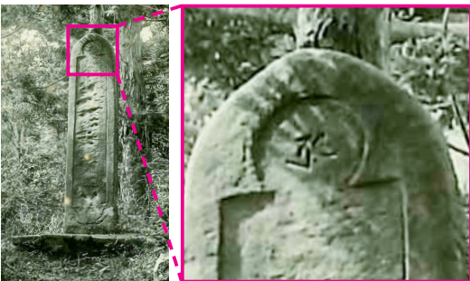
今回見つかった写真（左）と碑の拡大部分（右）

ところがつい最近、この石碑に関して新たな発見がありました。町民の方から町内の風景を撮影した古い写真をご提供いただいたのですが、なんとこの石碑を写した写真も見つかったのです。よく見るとそこには今は風化して削れてしまった梵字がはっきりと刻まれているではありませんか！