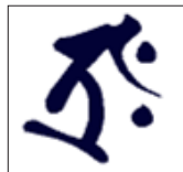
梵字「タラク」 (虚空蔵菩薩)