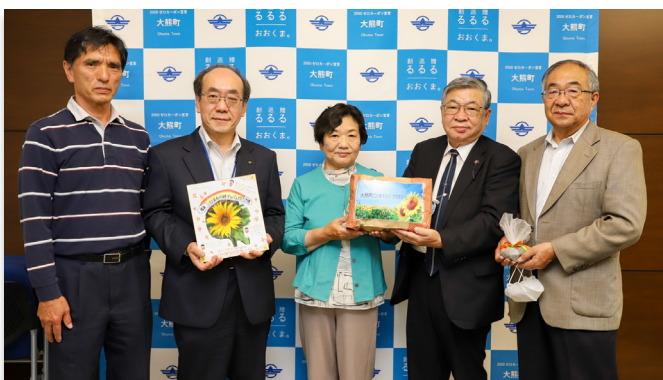
鈴木副理事長（右から2人目）から種を受け取る関係者

沖縄県の福島・沖縄絆プロジェクトから大熊町ひまわりプロジェクトにヒマワリの種が贈られました。