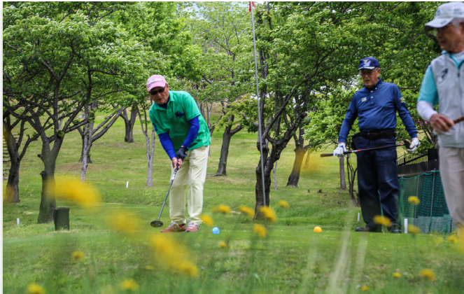
プレーする参加者

おおくまパークゴルフ協会は5月12日、広野町の二ツ沼総合公園パークゴルフ場で春の大会を開きました。新緑の中、町民60人がプレーと仲間との交流を楽しみました。