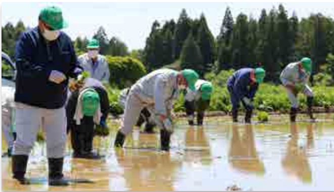
試験田に苗を植える町農業委員ら

中屋敷と熊の2地区で水稻の試験栽培が始まりました。5月10日に田植えが行われ、町農業委員ら関係者約20人が熊旭台の試験田1.8 アール aに天のつぶの苗を植えました。