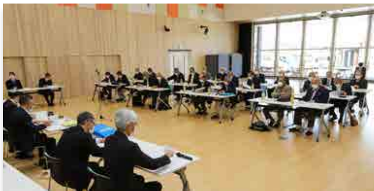
町から重点事業の説明を受ける行政区長ら