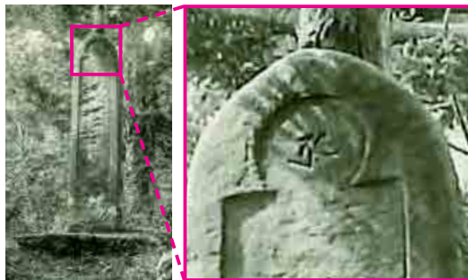
今回見つかった写真（左）と碑の拡大部分（右）

ところがつい最近、この石碑に関して新たな発見がありました。町民の方から町内の風景を撮影した古い写真をご提供いただいたのですが、なんとこの石碑を写した写真も見つかったのです。よく見るとそこには今は風化して削れてしまった梵字がはっきりと刻まれているではありませんか！