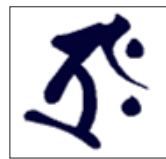
梵字「タラク」 (虚空蔵菩薩)