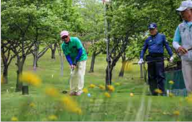
プレーする参加者

おおくまパークゴルフ協会は5月12日、広野町のニッ沼総合公園パークゴルフ場で春の大会を開きました。新緑の中、町民60人がプレーと仲間との交流を楽しみました。