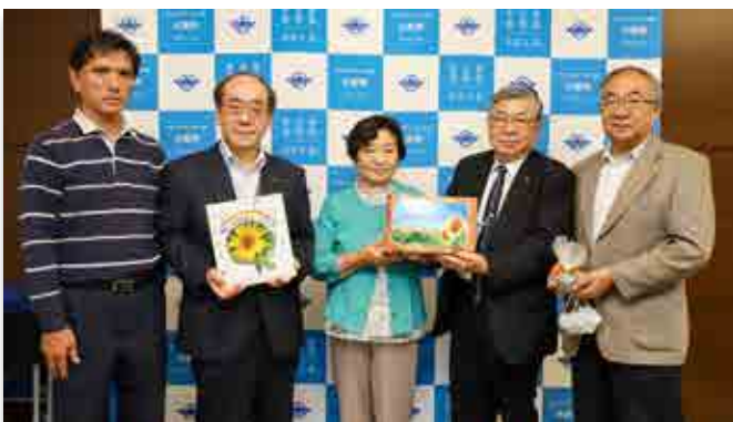
鈴木副理事長（右から2人目）から種を受け取る関係者

沖縄県の福島・沖縄絆プロジェクトから大熊町ひまわりプロジェクトにヒマワリの種が贈られました。