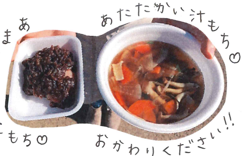
あま ま い あん もち

もちつき体験の後は汁もち、あんもち、きなもちが振る舞われました♡おなかか満たされたところで始まったのが三輪車レース🚲ちびこたちはもちろん、大人も本気を出してペダルをこぐ姿に会場は大盛り上がり👏