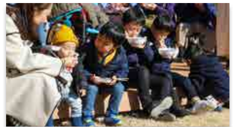
もちを味わう参加者