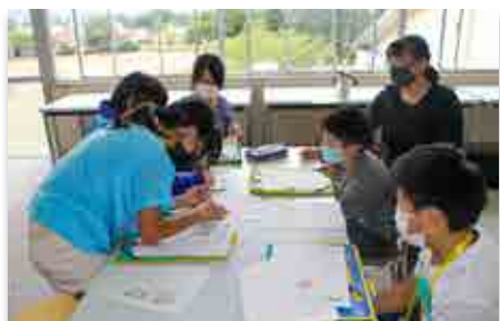
合同ワークショップを行う児童ら