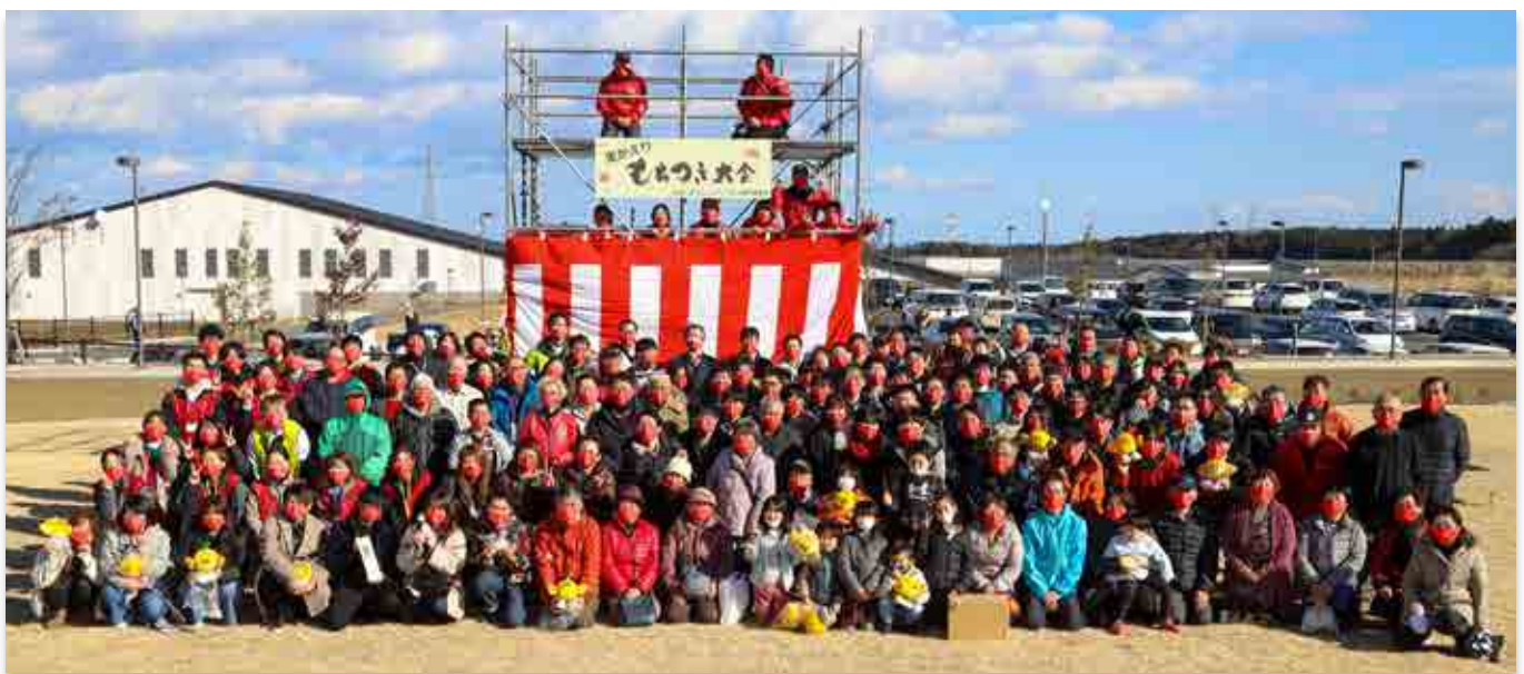
記念撮影に収まる参加者