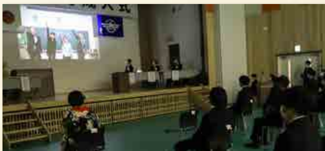
恩師ビデオメッセージの上映