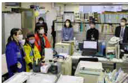
県庁で弁当を販売する町立校の児童ら