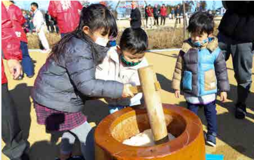
もちをつく子どもたち

おおくまコミュニティづくり実行委員会によるイベント・里がえりもちつき大会が1月9日、大熊町役場前の広場で開かれました。