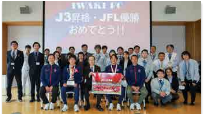
記念撮影に臨むいわきFCの皆さんと町職員ら

いわき市および大熊町など双葉郡の町村をホームタウンとして活動するプロサッカークラブのいわきFCは12月16日、シーズンの終了報告で町を訪れました。