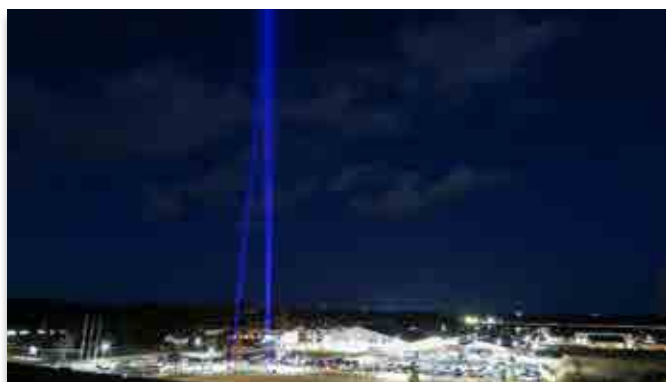
町内で点灯されたサーチライトの光

光のモニュメント2022が1月12日、町内大川原地区で行われました。光のモニュメント実行委員会の主催。午後5時、大熊町役場前の広場で3つのサーチライトが上空に向けて点灯されると、日が沈んだ空に青い光の柱が立ち上がりました。このサーチライトは南相馬市にあった無線塔をかたどったもので、震災で亡くなられた方への鎮魂と地域再生の願いを込めて照らされました。