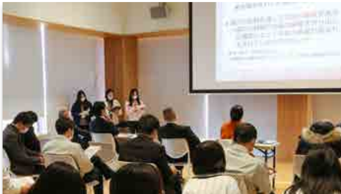
発表を行う学生ら

福島大は、現地での調査活動でその地域の課題解決策を考える地域実践学習「むらの大学」を町内で行いました。受講した同大の1年生19人が、町のPR、まちづくり、コミュニティ、農業、教育をテーマにした5班に分かれて現地調査を実施。学生らは、住民からの聞き取りやイベントでの交流などで町の復興策を探りました。