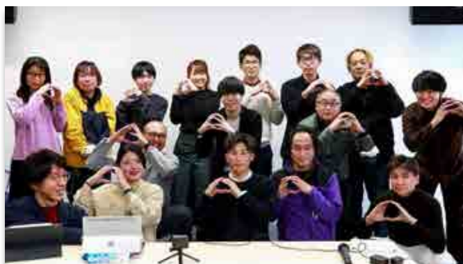
記念撮影に収まる参加者

町出身者が抱く課題の解決を通して町再興を考えるワークショップ「NEXT 大熊」が昨年12月から4回にわたり開かれました。