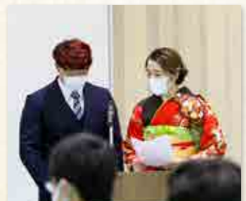
司会進行を務める新成人