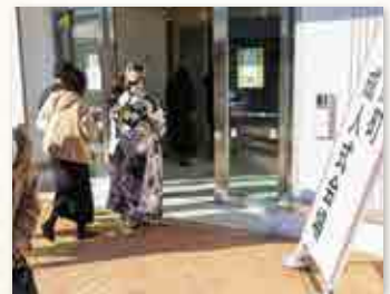
会場に集まる新成人