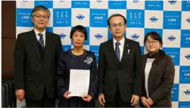
吉田町長に受賞を報告する大竹さん（左から2人目）