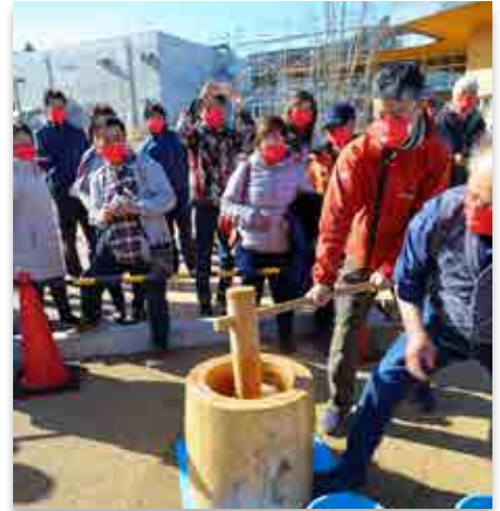
順番にもちつきを行う参加者