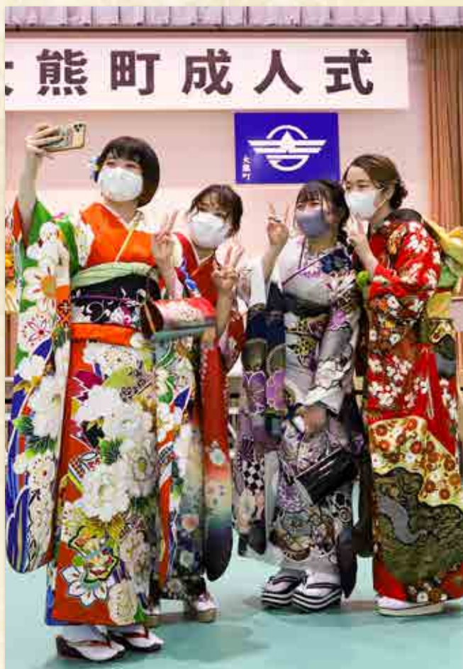
写真を撮る振袖姿の新成人