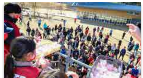
もちまき抽選会の様子