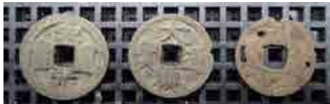
出土した銭3点、左から宋元通宝、大観通宝、もう1点は判読できず

宋は博多などの商人と民間貿易を活発に行っており、12世紀中ごろに勢力を強めていた平清盛が現在の兵庫県神戸市周辺に港を開き、日宋貿易を拡大させました。これが大きなきっかけとなり宋銭が日本全国に流入するようになったといわれています。宋銭の流入時期を考えると、製鉄遺跡は鎌倉時代のものではないかと考えられます。