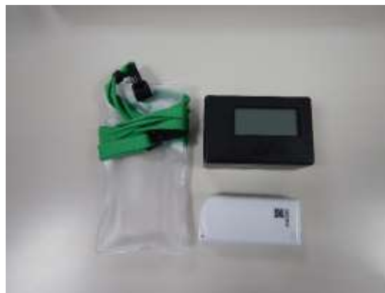
積算線量計（Dシャトル）

○準備宿泊される前に、世帯の代表者の方は、当日、必ず町役場環境対策課窓口までお越しください。