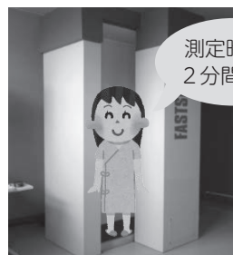
ホールボディ・カウンタによる測定