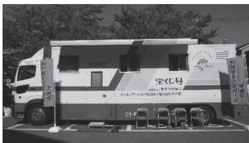
ホールボディ・カウンタ車

*令和3年度原子力災害影響調査等事業（福島県内における住民の個人被ばく線量把握事業：内部被ばく）