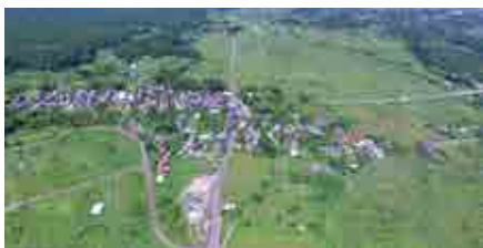
苦麻の村と記録に残る町区

大熊町は昭和29(1954)年に大野村と熊町村が合併して誕生しました。第1回は、町名「大熊」の「くま」にまつわるお話です。