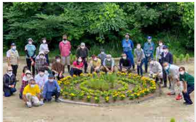
やすらぎ霊園前の花壇で記念撮影に収まる参加者

ルドやルドベキアなどの苗を植え、災害公営住宅と公営墓地やすらぎ霊園入り口の2か所に花壇をつくりました。