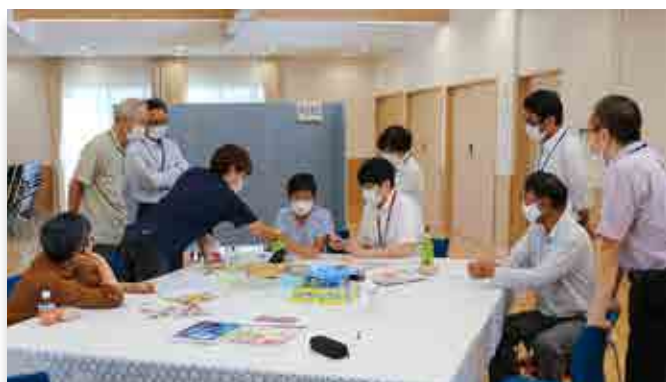
いちごカフェで交流する参加者

町の認知症カフェ「いちごカフェ」が7月15日、町住民福祉センターで町社会福祉協議会のサロンとともに開催されました。認知症カフェは、地域の人たちが気軽に集い、認知症の人や家族の悩みを共有しながら、専門職に相談もできる場所です。