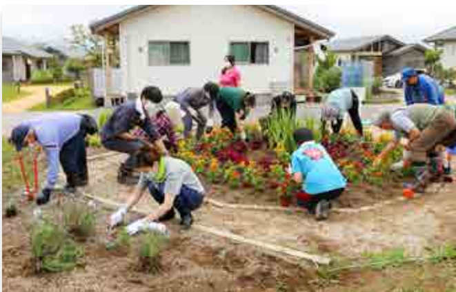
災害公営住宅の花壇に花の苗を植える参加者

福島高専が町民と協力して花畑をつくる交流イベント「大熊町花舞台」が7月10日、町内大川原地区で行われました。