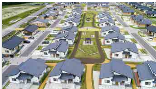
全建賞を受賞した第2期災害公営住宅

大熊町大川原地区災害公営住宅等整備事業（第2期）が、優れた社会資本整備事業を顕彰する全日本建設技術協会の全建賞を受賞しました。災害公営住宅の受賞は、第1期整備事業に続いて2回目です。