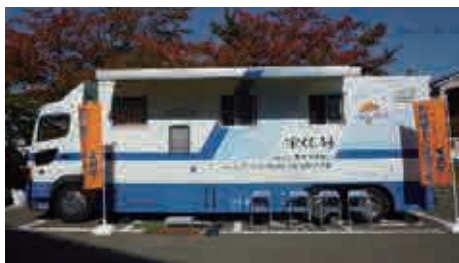
ホールボディ・カウンタ車

*令和3年度原子力災害影響調査等事業（福島県内における住民の個人被ばく線量把握事業：内部被ばく）