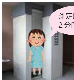
ホールボディ・カウンタによる測定