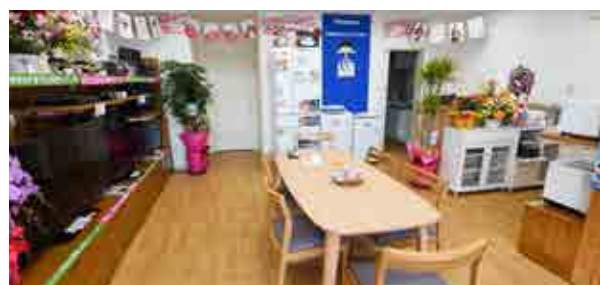
テーブルで落ち着いて相談できる店内

仮設店舗から移転し、震災前のお店のようなアットホームな雰囲気に。各種電化製品を取り扱っています。