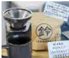
オリジナルコーヒー豆