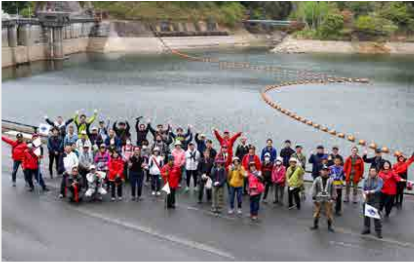
坂下ダムに到着し、記念撮影に収まる参加者

春の坂下ダムウォーキングイベントが4月17日、町内大川原地区で行われました。参加した町民ら約80人は、大熊町役場をスタートし、坂下ダムまでの約4kmの道のりを歩きました。当日は、普段封鎖されているダム堤体と湖岸南側道路が開放され、ダム湖を一周することが可能に。時折小雨が降る空模様でしたが、参加者は