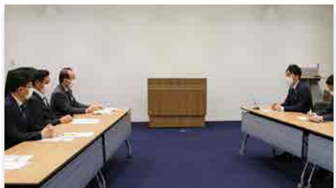
説明する小泉環境相（右）

小泉進次郎環境大臣が4月17日、大熊町役場を訪れ、東京電力福島第一原発のALPS処理水の海洋放出に関するモニタリング体制について説明しました。