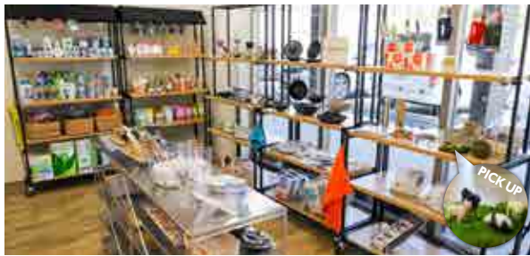
日用品や食器、かわいい小物などが並ぶ店内

日用品雑貨や化粧品のほか、おすすめグッズやオリジナルブレンドのコーヒー豆など暮らしが楽しくなる品揃え。ネイルサロンも併設。