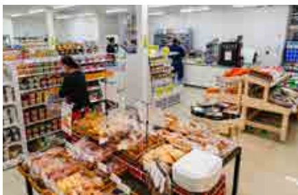
野菜やパンの特設コーナーがあります