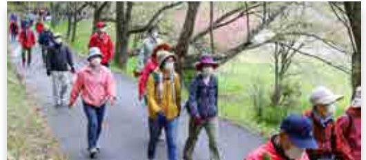
ダム湖の周りを散策する参加者

春の坂下ダムウォーキングイベントが4月17日、町内大川原地区で行われました。参加した町民ら約80人は、大熊町役場をスタートし、坂下ダムまでの約4kmの道のりを歩きました。当日は、普段封鎖されているダム堤体と湖岸南側道路が開放され、ダム湖を一周することが可能に。時折小雨が降る空模様でしたが、参加者は