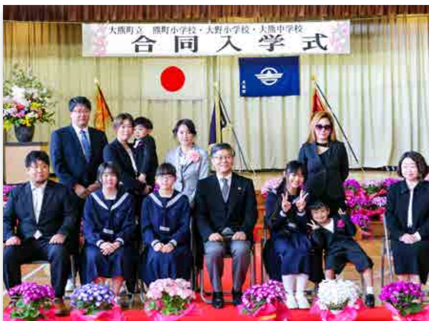
記念撮影に収まる新入生と保護者ら