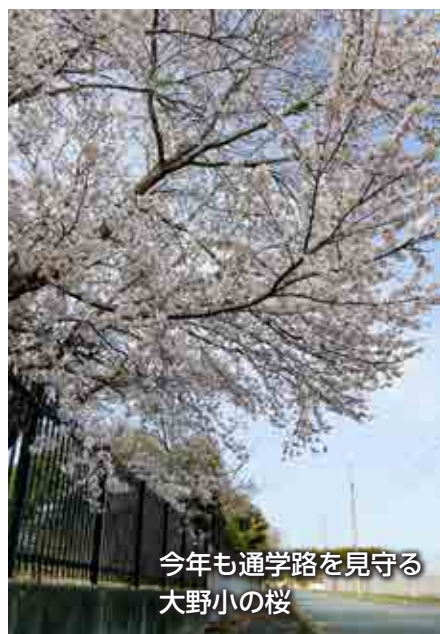
今年も通学路を見守る 大野小の桜