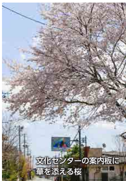
文化センターの案内板に 華を添える桜