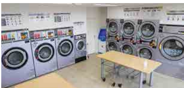
洗濯乾燥機などが並ぶ店内

洗濯機1台、洗濯乾燥機3台、乾燥機7台を備えています。天気を問わずにいつでも洗濯できます。くつ用の洗濯乾燥機もあります。