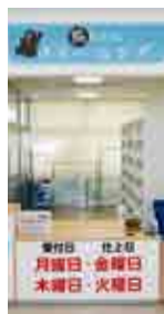
クリーニング窓口

店内で焼いたパンや手作りお弁当のほか、生鮮食品など品揃えが充実。店内のイートインスペースは15席。クリーニングも受付中。