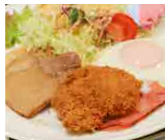
テーブル14席、カウンター2席 レインボーランチ

一番人気のレインボーランチや定番のハンバーグランチ、ナポリタンのほか、サイフォンで入れたブレンドコーヒーでおもてなし。ランチタイムはコーヒーをサービス。