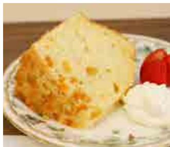
シフォンケーキセット

モーニングとランチタイムに、酵母からこだわった日替わりパンをドリンクとのセットで提供。シフォンケーキセットも人気です。カウンターに並ぶパンはテイクアウトできます。