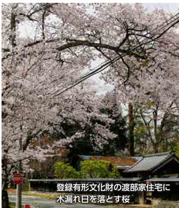
登録有形文化財の渡部家住宅に 木漏れ日を落とす桜