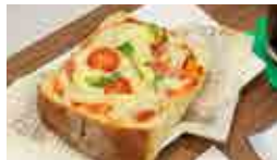
日替わりパンセット