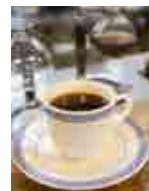
ブレンドコーヒー