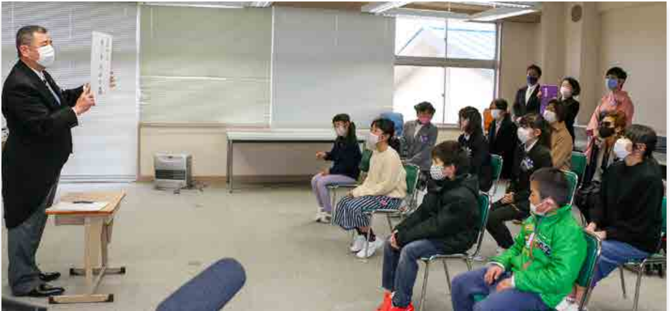
新しい校名を伝えられた町立小の児童ら

校長先生から校名を発表された子どもたちは、「夢がある名前」、「町内にできる新しい学校にも行きたい」と校名の感想を笑顔で話していました。