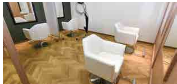
落ち着いた雰囲気の店内

震災後初めて町内でオープンする美容室。予約制なので待ち時間がなく、自分の予定に合わせて利用できます。