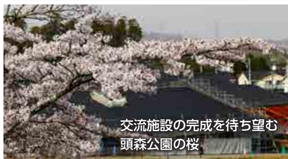
交流施設の完成を待ち望む 頭森公園の桜