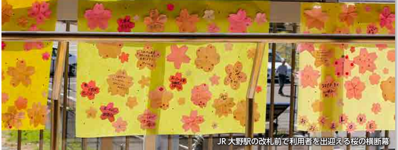
JR 大野駅の改札前で利用者を出迎える桜の横断幕