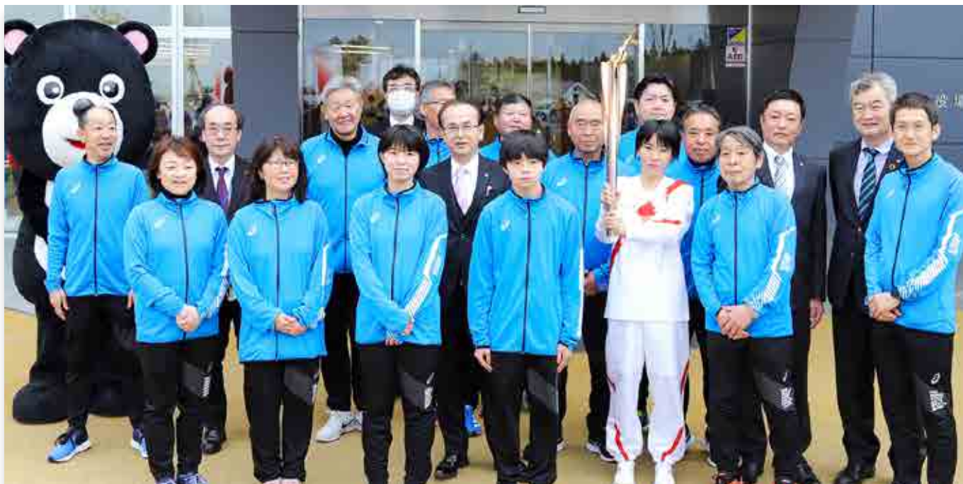
町内の聖火リレーをゴールし、記念撮影に収まるランナーと関係者ら

町内で実施された聖火リレーに、サポートランナーとして町民を中心とした13人が参加しました。