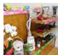
調理家電や美容家電も

仮設店舗から移転し、震災前のお店のようなアットホームな雰囲気に。各種電化製品を取り扱っています。