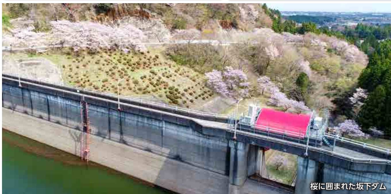
桜に囲まれた坂下ダム