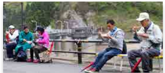
振る舞われた豚汁を味わう参加者