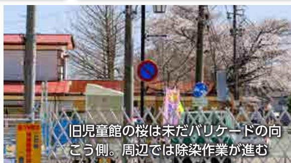
旧児童館の桜は未だバリケードの向 こう側。周辺では除染作業が進む