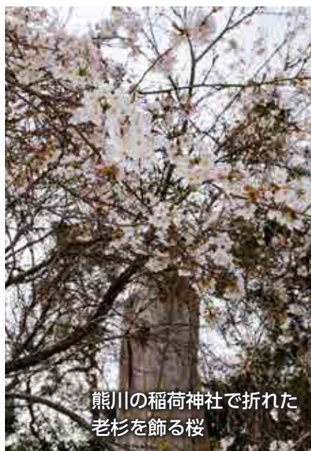
熊川の稲荷神社で折れた 老杉を飾る桜