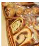
カウンターのパン