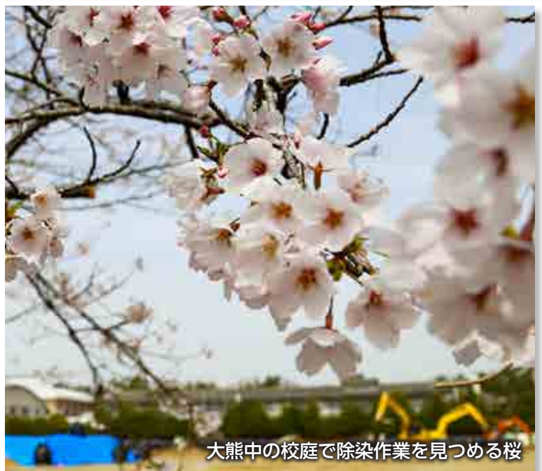
大熊中の校庭で除染作業を見つめる桜