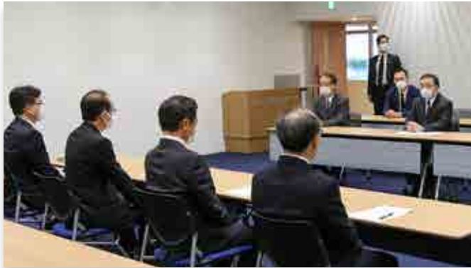
処理水の処分方針を説明する梶山経産相（右）

梶山弘志経済産業大臣が4月13日、大熊町役場を訪れ、東京電力福島第一原発で増え続けるALPS処理水の処分に関し、国は海洋放出の方針を正式に決定したことを吉田淳町長に報告しました。