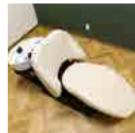
快適なシャンプー台

震災後初めて町内でオープンする美容室。予約制なので待ち時間がなく、自分の予定に合わせて利用できます。