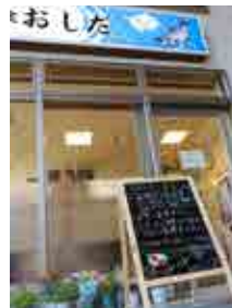
テーブル16席、カウンター5席 海鮮丼