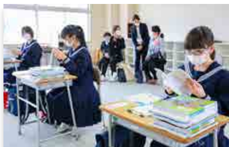
受け取った教科書を確認する中学生