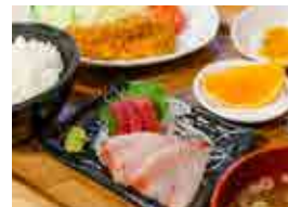
フライ・刺身定食