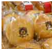
ま～るいおおくまパン

店内で焼いたパンや手作りお弁当のほか、生鮮食品など品揃えが充実。店内のイートインスペースは15席。クリーニングも受付中。