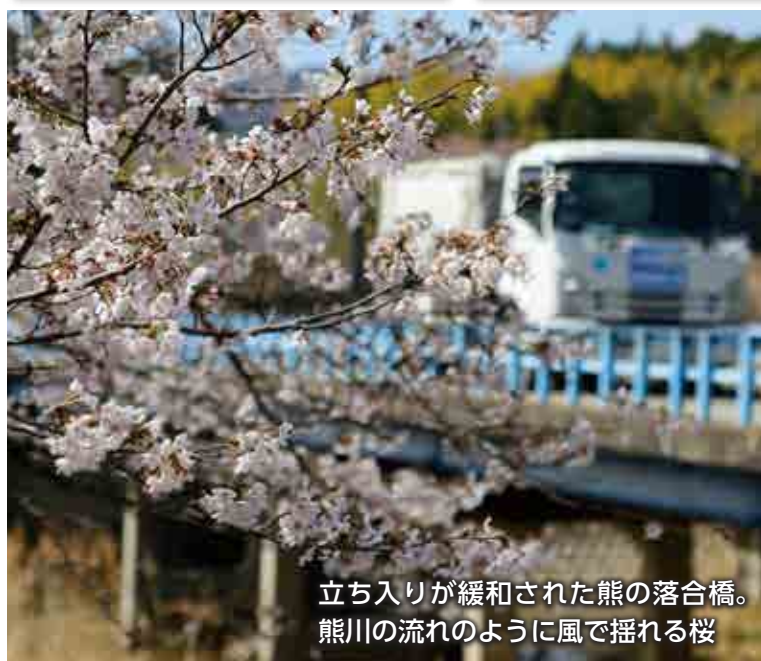
立ち入りが緩和された熊の落合橋。 熊川の流れるように風で揺れる桜