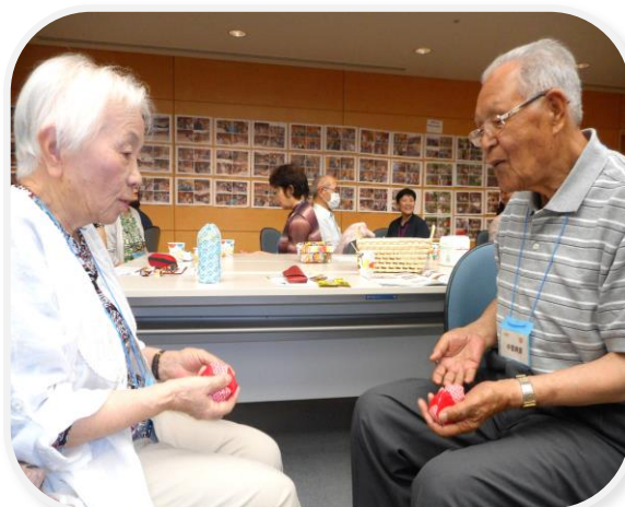
お二人とも息がピッタリ！

参加者は体を動かした爽快感と終始笑い声が絶えない雰囲気の中で心身共にあたたかな気持ちになれたひとときでした。