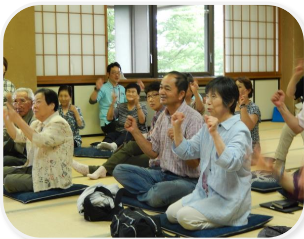
ゲーチャキパーで何作る？

伊達市社協主催のサロン『元気が〜い』が伊達市保原中央交流館において定期的に行われています。