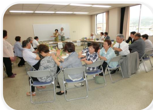
アイスブレイクでリフレッシュ

今回は、総会の中で日々見守り支援活動に力を注いでいる各会長に、リフレッシュして頂く為、福島県社会福祉協議会から講師をお招きしアイスブレイク等で楽しんで頂きました。会場内は、会長達の楽しい笑い声で一杯となりました。また、今後のサロンや訪問活動にも活かせるとの声もあり、更なる活動強化に繋がる事を実感しました。