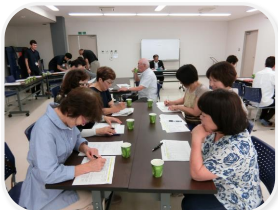
楽しいサロンを計画中

7月9日（木）いわき地区にお住いのボランティア登録者の方々と活動打合せ会を行いました。