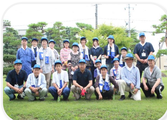
気分爽快！また頑張るぞ！

次回は9月19日（土）、続いて10月17日（土）、11月21日（土）に行います。