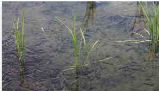
大川原の実証田に植えられたコガネモチの苗

今年は試作品を作り、来年度以降に商品化して町の新たな特産品とすることを目標にしています。