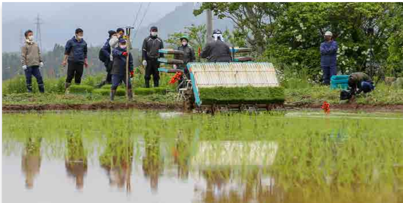
下野上の試験田で田植えを行う町農業委員会関係者ら