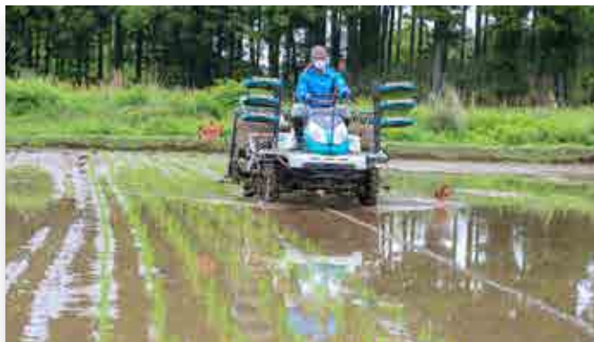
酒米の栽培が始まった大川原の水田