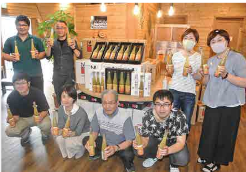
キウイリキュールの完成を喜ぶ有志の皆さん