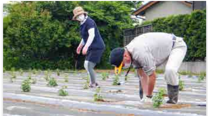
ざる菊の苗を植える参加者

大熊町ひまわりプロジェクトの種まき作業が6月6日、町内で行われました。今年は町役場近くにざる菊の苗も植えました。