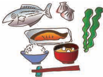
図；出典；放射線・放射性物質Q&A（2）；長崎大学

もし放射線と健康影響に関する疑問や質問がありましたら、大熊町役場を通じて、長崎大学のスタッフに、お気軽にお問い合わせください。