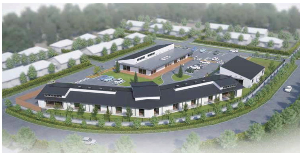
安心安定した生活には福祉施策が重要

働きやすい環境を目指し町独自の支援策を今年度中に策定し、町内外から多くの介護職員確保に努めていく。