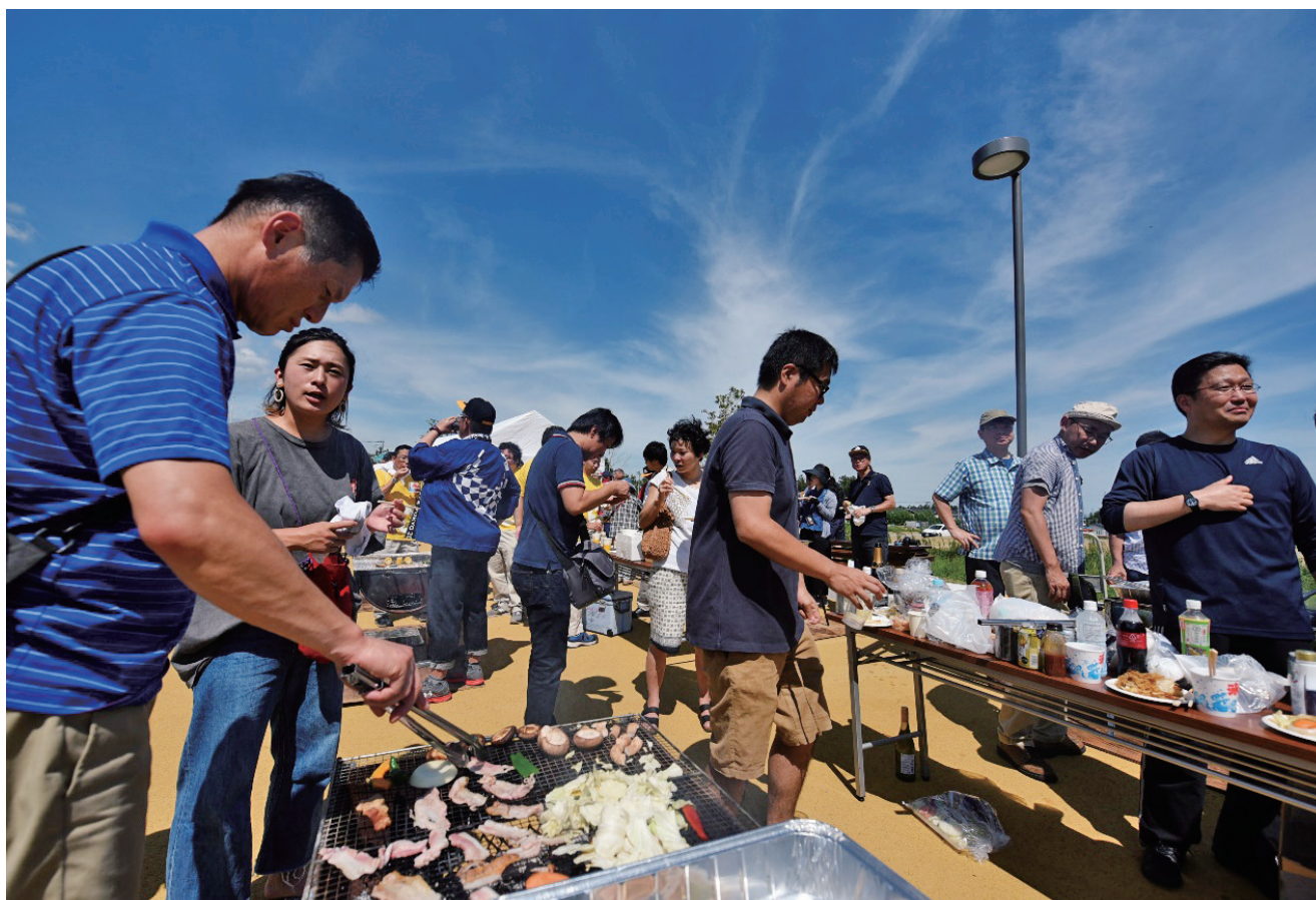
楽しい交流の場が多くあります ぜひご参加を（庁舎前での夏まつり）