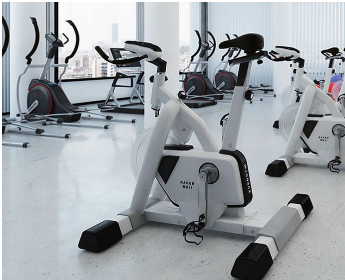
良い仕事につながる施設の整備を

福利厚生を含めた健康管理については、臨時職員、派遣職員も含めた全職員を対象に健康診断を実施している。メンタル面はストレスチェック事業に加え講演会、各種講座の開催を計画している。安心して職務に従事できるよう引き続き取り組んでいく。