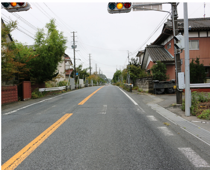
国道側からの解体はむずかしい

熊町地区の特性、地域の特徴をよく考慮し変更等についても町民の意向を尊重する形で十分前向きに検討していく。