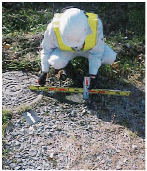
生活に下水道はかせない