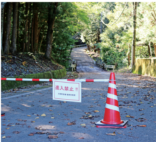
山に入ってはいけません

登山道の整備にあたっては周辺の放射線量が十分に把握し、作業員の安全を確保することが欠かせない。JAEAによる調査および福島高専と協力してドローンを使い線量調査を行っている。この調査結果を十分に踏まえ整備の検討をしていきたい。