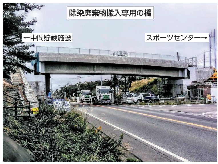
渋滞緩和に貢献 国道6号横断橋

答 スポーツセンターから中間貯蔵施設までの区間1180mは令和元年11月頃完成予定である。 またインターからスポーツセンターまでの区間2100mは令和2年9月頃完成の予定であり、全線開通の見通しは令和2年11月頃になる。