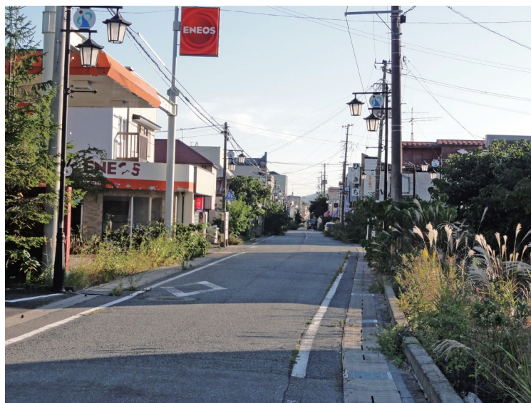
令和4年には生まれ変わります