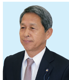
伊藤 昌夫 議員