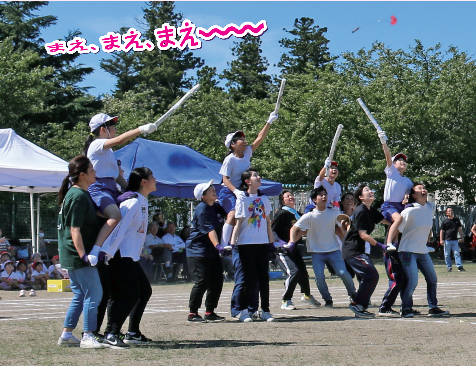
晴天のもと 顔晴ろう大熊っ子大会 (神旗争奪戦 in 河東)