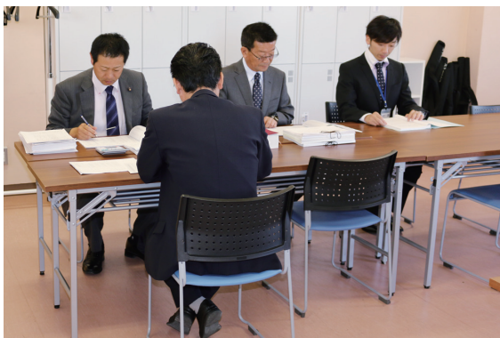
監査委員が適正な予算執行を検証

項については全庁内で共有し、速やかに改善を図ること。管理職員等は、法令等を遵守したより適正な事務執行に向け、職員が担う事務の進捗管理や情報の把握、共有を徹底すること。また複数職員による業務のチェック体制の強化や事務指導体制の充実に努め、全庁的な取り組みとして、職員一丸の体制で事務処理等のミスを防ぐよう要望する。