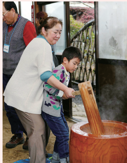
会長も お餅をついて