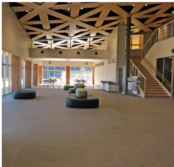
この一画に喫茶を（新庁舎1Fおおくまホール）

多目的スペースには給排水設備がないことや衛生面でクリアしなければならぬ問題もあるため、コーヒーショップを営業することは運営方法など含め設置は難しいと考えている。今後の状況を見ながら検討していきたい。