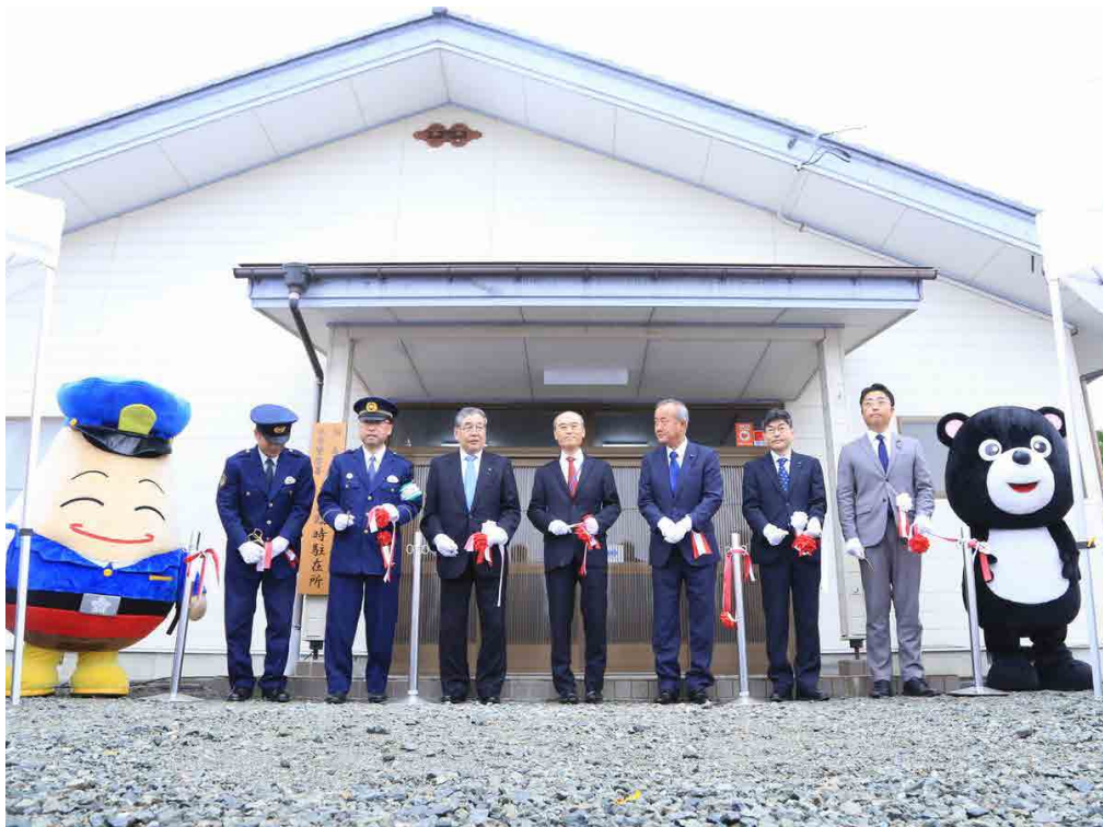
テープカットで駐在所の開所を祝いました

双葉警察署大熊臨時駐在所が5月29日、旧大熊町役場大川原連絡事務所（大川原第一集会所）内に開所しました。