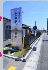
さくらモール・ とみおか診療所