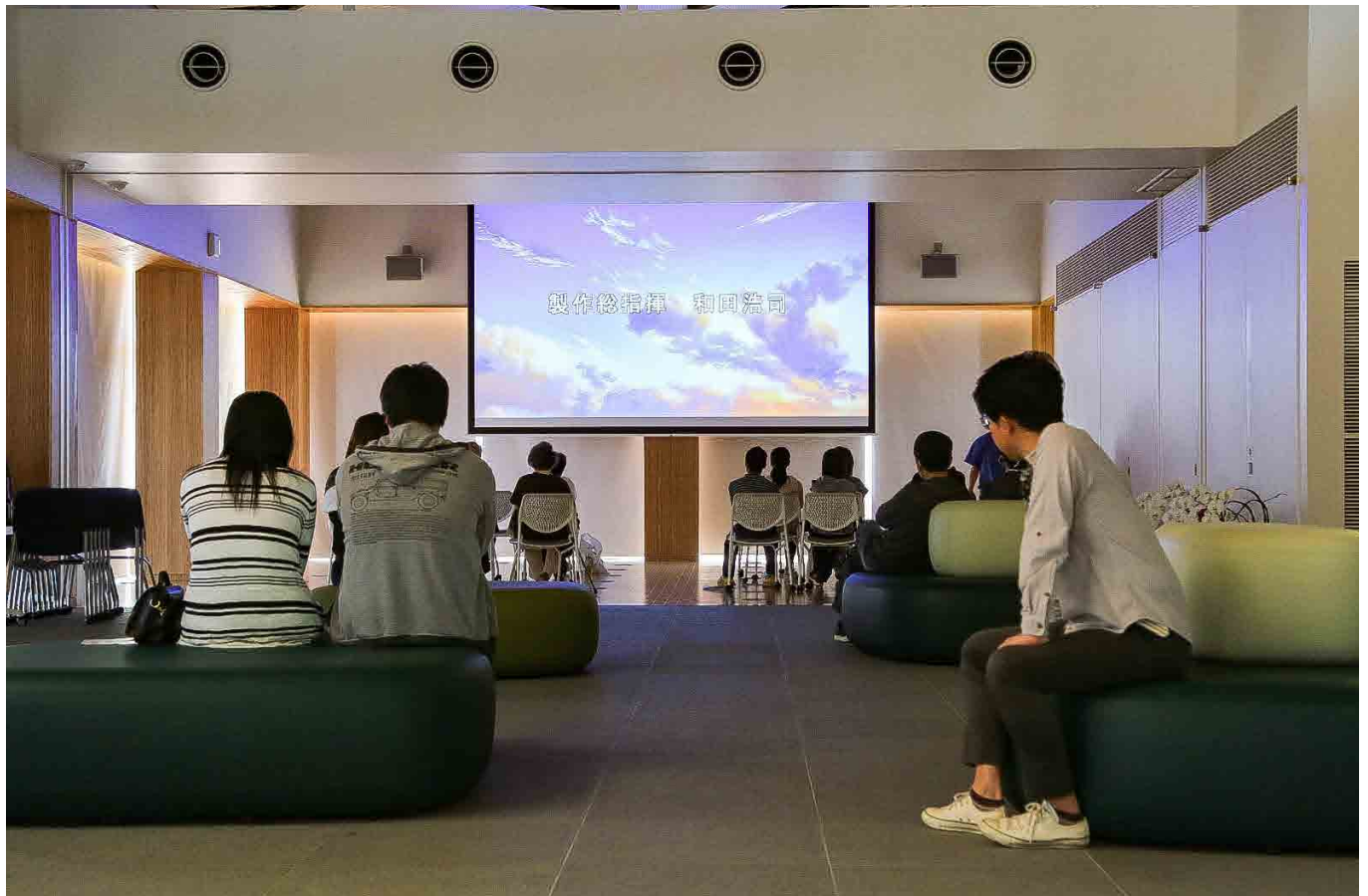
おおくまホールで開かれた上映会