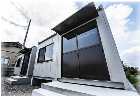
これが仮設店舗です