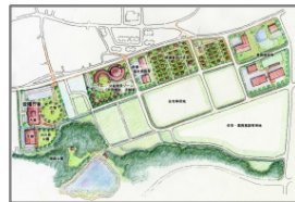
【復興拠点（大川原）イメージ】