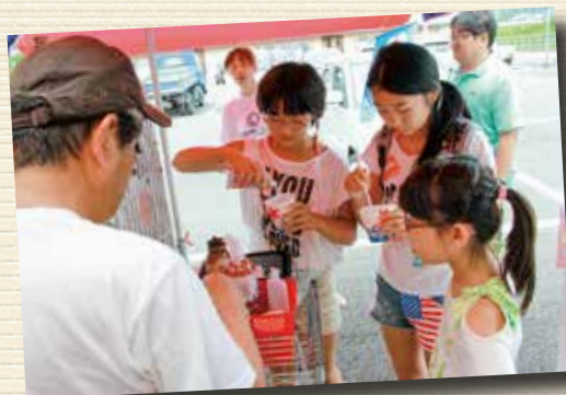
▲かき氷には子どもたちみんなが こぞって食べ始めます。