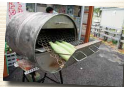
▲今回作ったのはかき氷に ドラム缶窯の焼トウモロコシ！