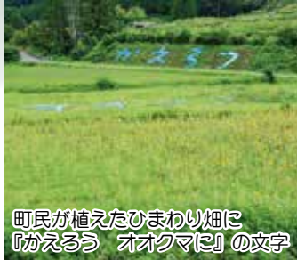
町民が植えたひまわり畑に『かえるう オオクマに』の文字