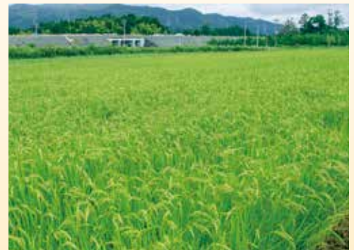
▲収穫間近の試験田