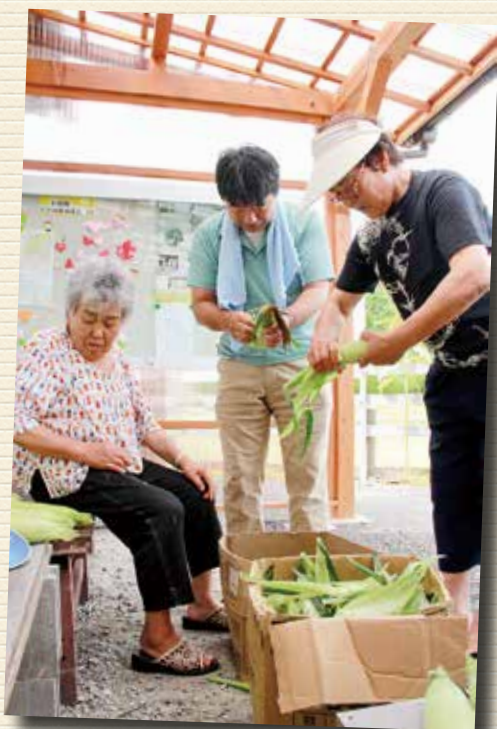
▲皆でトウモロコシの皮を むいていきます。