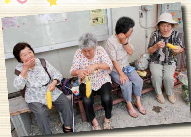
▲あつあつを頼張るのは格別です！