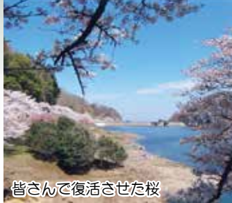
皆さんで復活させた桜