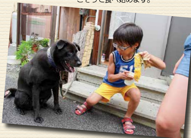
▲「ぼくのものだ！」と言わんばかり。 うらやましそうに見ていました。