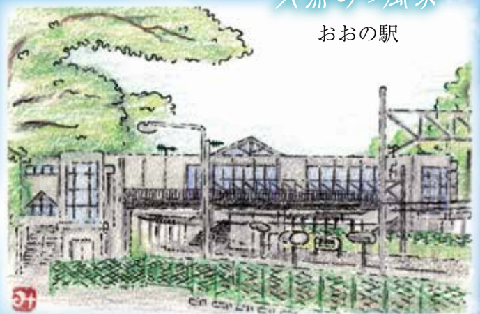
イラスト：早川みどりさん