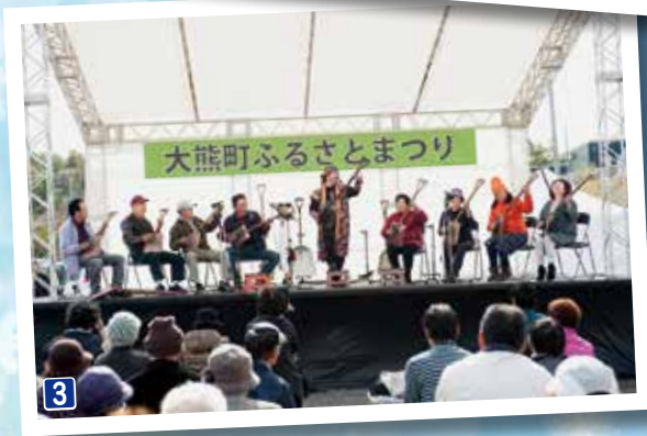
1~4.....ふるさとまつり 5...デイサービスときめき倶楽部