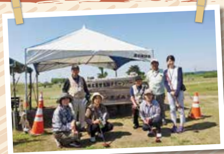
平成28年5月に行われた 栃木おおくまの会の パークゴルフ大会の様子