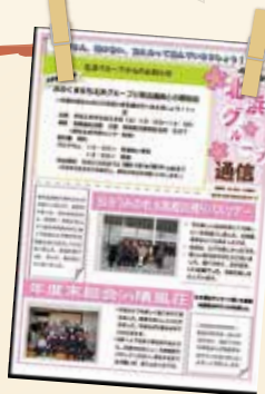
コミュニティ補助金を活用して 作成されている おおくままち北浜グループ通信