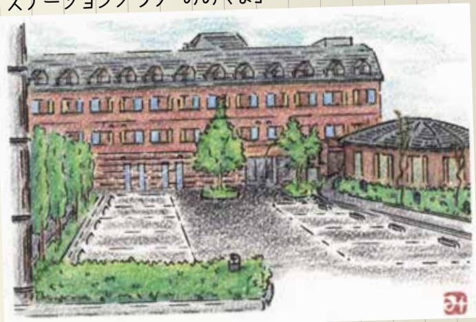
イラスト：早川みどりさん