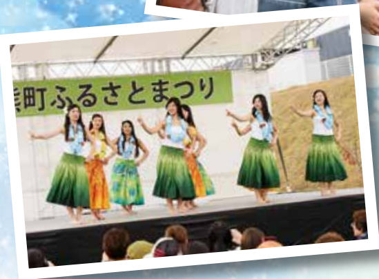
「ステーションプラザ おおくま」