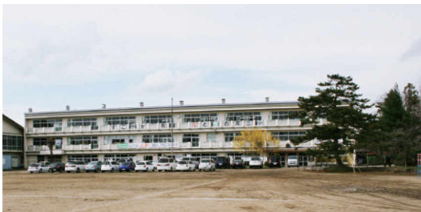
熊町・大野小学校 (旧河東第三小学校)

大熊中学校が40周年、熊町小学校、大野小学校が140周年を迎え創立記念事業を行います。 この事業は10年ごとに行い、今回は秋ごろに予定しています。