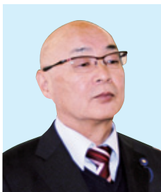
松永 秀篤 議員