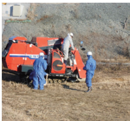
機械による草刈り・ロール