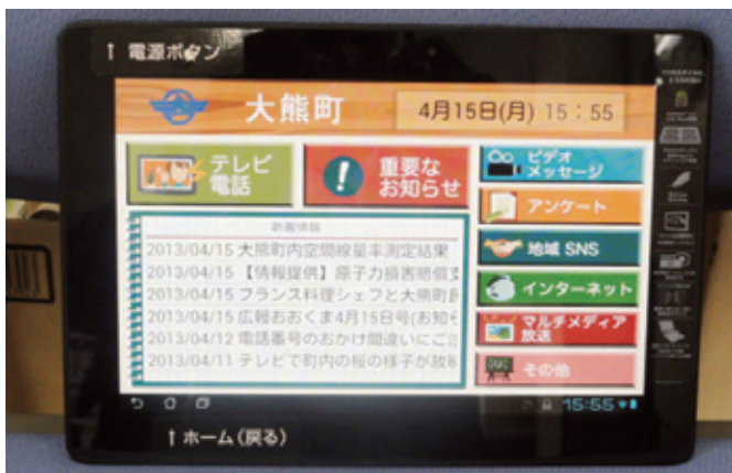
どんどん活用しましょう

タブレット端末を利用し、町民のきずなを維持する事業です。アプリケーションメニューの充実などきめ細やかなサービスを町に要望しました。 大熊町では通信料を無料とするだけでなく、ウイルス対策や使用方法に関する相談室も設置します。