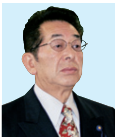
堀川 巨夫 議員