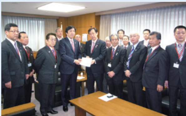
菅原一秀経産副大臣に要望