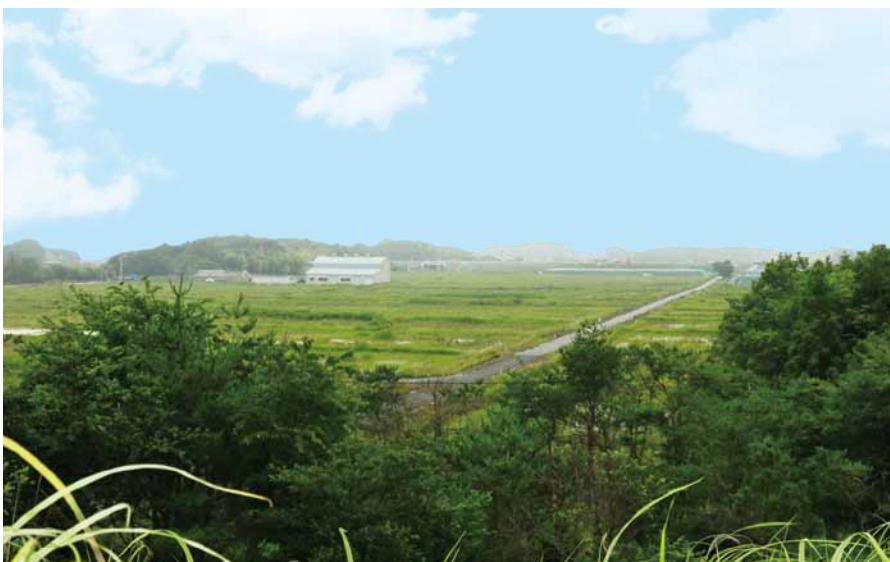
みんなで創ろう 新しい街