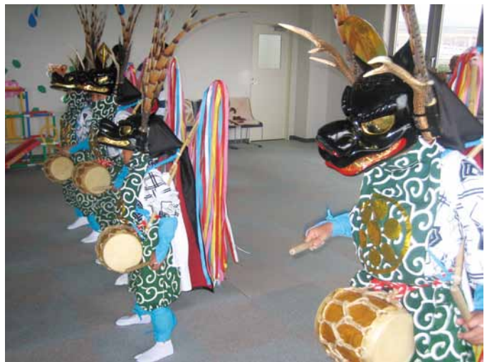
伝統を絶やすな！熊川稚児鹿舞本番に向け練習