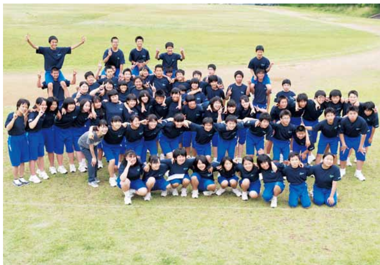
未来はまかせた！スポーツ大会から大熊中学校68人の生徒たち

また、帰還を断念せざるを得ない住民への支援策としては金銭面だけの問題ではないと考えているので町独自策については今後よく検討する。