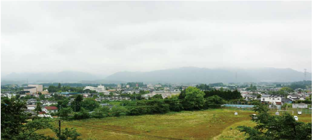
期待される町中心部の復興（平成26年7月撮影）