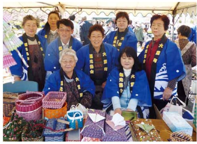
一緒につくってみませんか

私たちは、鹿島地区の方々との交流のため、当地区で開催される春の恒例イベント「かしまふれ愛さくら祭り」に参加しました。 このイベントは、鹿島ショッピングセンター「エブリア」の北側駐車場を会場に開催されました。 鹿島地区では平成10年から、「鹿島千本桜」と銘打ち、矢田川沿いの桜植樹を続けてきました。約600本以上の美しい花が咲くのに合わせて、毎年行われているイベントです。