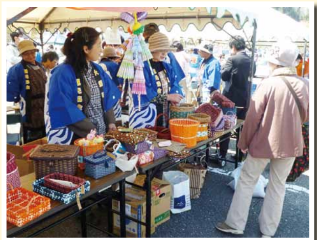
これ使いやすいのよ

私たちは、鹿島地区の方々との交流のため、当地区で開催される春の恒例イベント「かしまふれ愛さくら祭り」に参加しました。 このイベントは、鹿島ショッピングセンター「エブリア」の北側駐車場を会場に開催されました。 鹿島地区では平成10年から、「鹿島千本桜」と銘打ち、矢田川沿いの桜植樹を続けてきました。約600本以上の美しい花が咲くのに合わせて、毎年行われているイベントです。