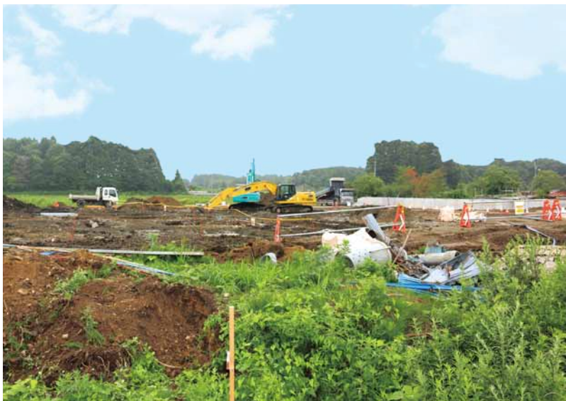
まずは食から 建設が始まった給食センター現場

答 魚類を採取し調査しているが、川魚は比較的高いが、海魚は低い。山菜、キノコ類は高い汚染数値がでてくる。