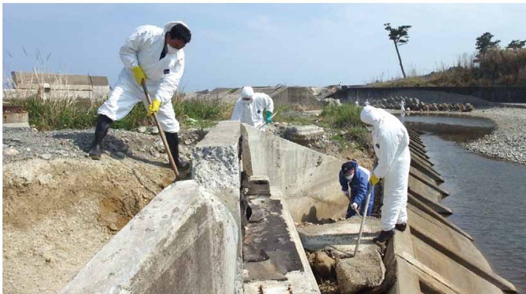
消防団による行方不明者捜索

アンケートの結果、165名の団員が今後の活動に参加できる回答を得たので、その不足分を補正するものがある。