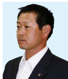
仲野 剛 議員