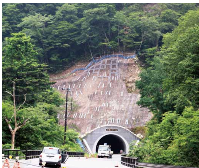
行き違いなしで安全通行

答 残念ながら国の構想には乗っていない。今後、福島県の復興計画に反映するよう要望していく。