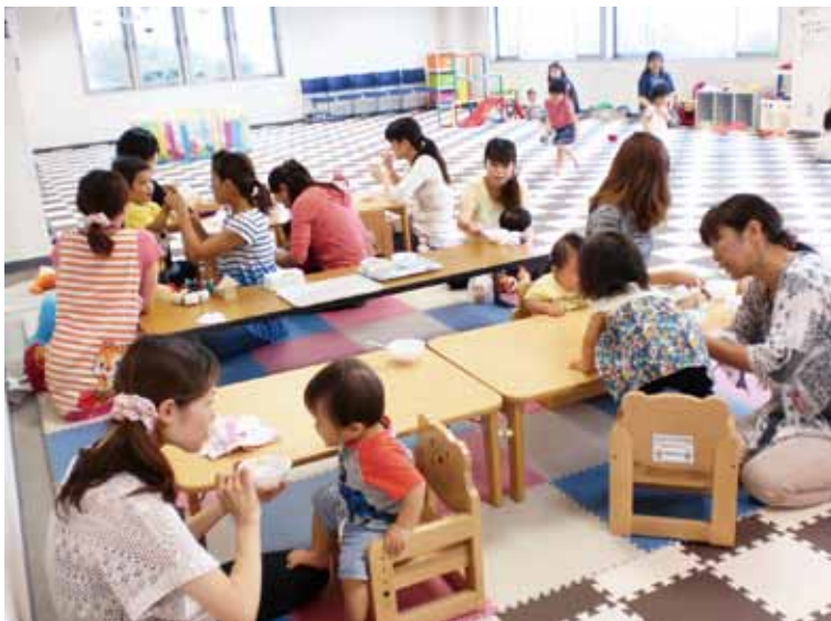
町の宝、子どもたちのために いわき出張所2階