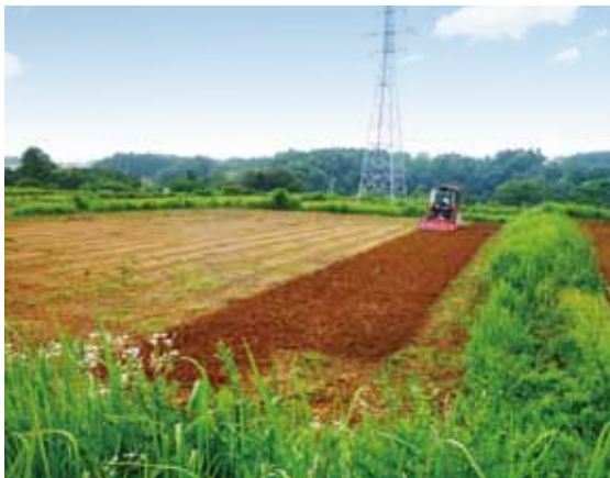
農地の荒廃を防げ

組合運営に町は直接かわらないが町、双葉農業普及所で全力でサポートする。大川原地区の認定農業者14人でスタートする。