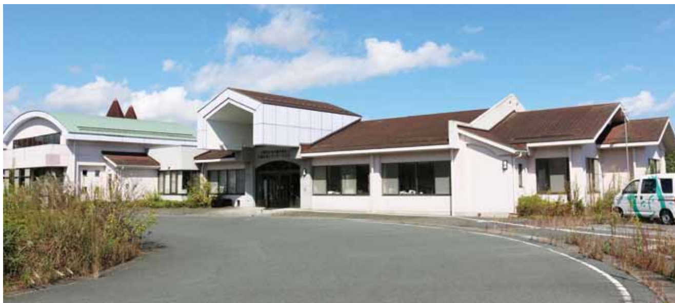
施設運営が可能な人材確保

また、福島県では介護福祉士等修学資金貸付制度があり「社会福祉士及び介護福祉士法」に基づく学校、養成施設に在学し、卒業後に福島県内で1年以内に介護業務に従事し、引き続き5年以上従事した場合、返還を免除する制度もあるので活用できる様PRしていく。