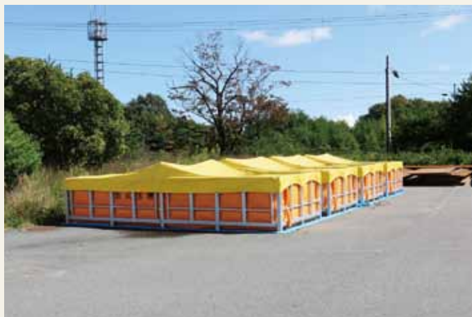
初期消火に有効 40mの水槽確保

町内の消火栓が利用できない状況であり火災発生時の水利確保のため、町内7カ所に仮設の防火水槽を設置しました。