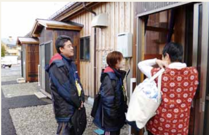
おかわりないですか