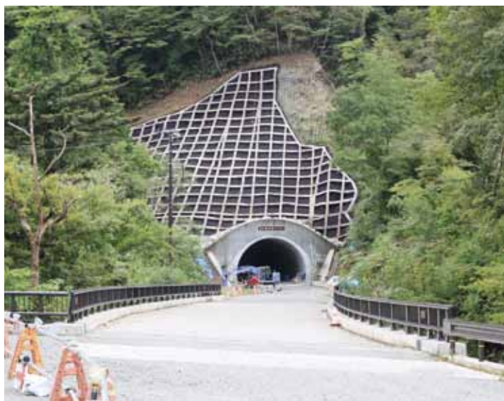
復旧が進む玉ノ湯トンネル

現地事務所にあるジオラマ（立体地図）をつくり会津若松出張所といわき出張所にも設置する。