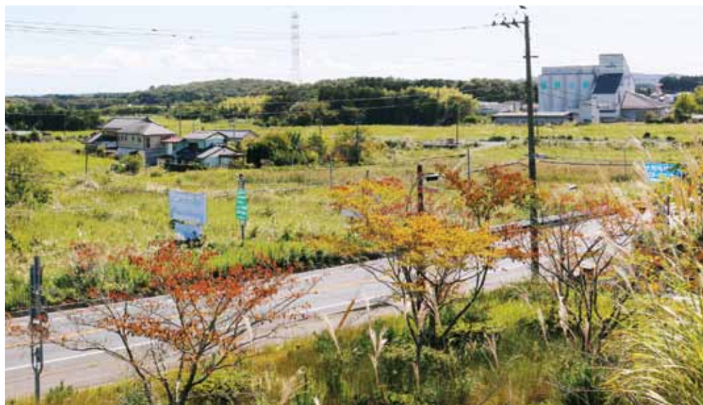
東西の境目 国道6号線

できる限り地権者のみなさんに還元できる施策を示していきたい。復興ビジョンについては現状が刻々と変化しており、将来を見据え、必要であれば町民の希望につながる見直しをしていく。