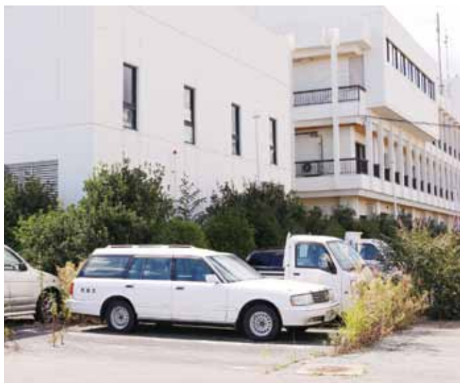
使用していない公用車も町の財産