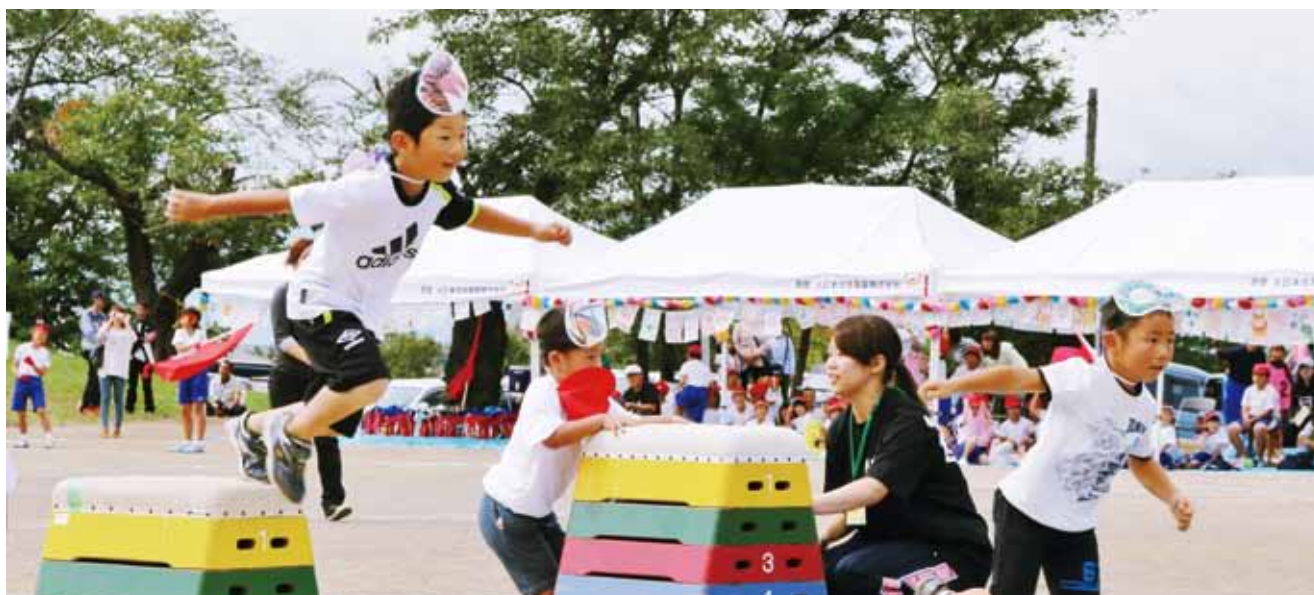
将来を担う子どもたちのために