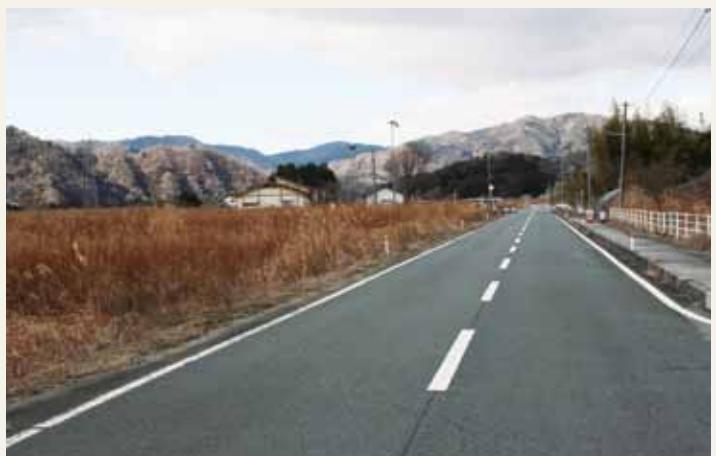
乾燥時の野火延焼を予防 西20号線