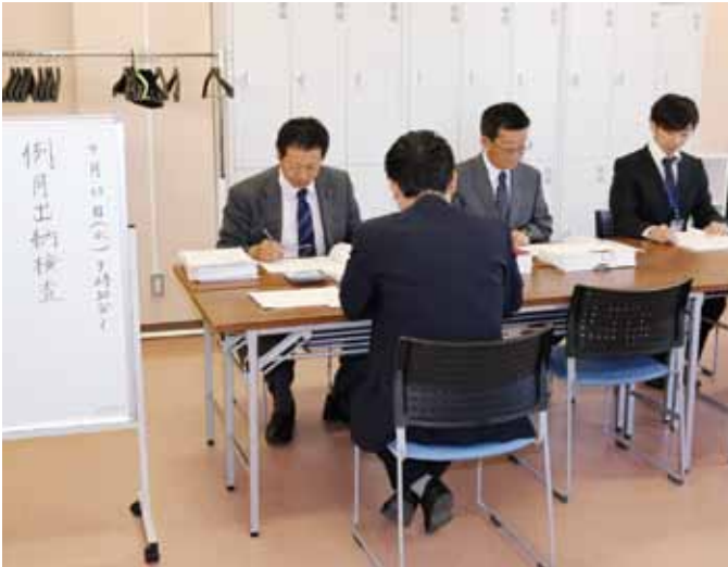
監査委員が適正な予算執行を検証

平成26年9月定例会は、9月10日から19日の10日間の日程で開かれました。定例会では平成25年度決算認定や平成26年度補正予算、条例改正、人事案件など26議案、議会提案の「手話言語法」制定を求める意見書を審議し、いずれも全会一致で可決されました。