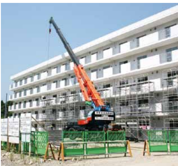
新たなコミュニティの場