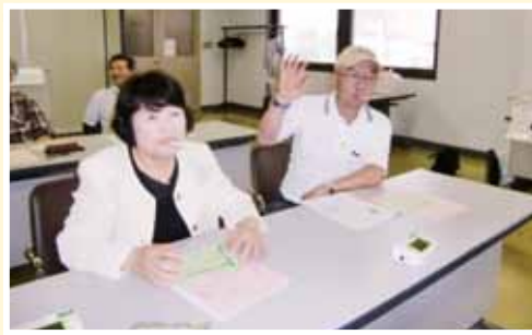
ストレスチェック

柏崎市の保健師さんに唾液でできるストレスチェックをしていただき、標準よりストレス値の高い方は、ストレスの話を聞いたり、ハンドマッサージやケーキとハーブティーなど癒しの時間が持てました。