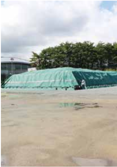
ここに置けないの 総合グラウンド

くともゴミを片付けたのでフレコンバッグを配布してほしいと要望があるが、容量が大きく室内に保管した場合、そのまま搬出できないため回収時に表にだす二重の作業になる。また屋外に置けば回収できないことから動植物に荒らされ、周辺にゴミを飛散させることになる。 町長 環境省からは、何力所かの仮置き場の提示があるが、仮置き場の容量や収集量の問題、住宅からの離隔などがあり、再検討をしている。 このような事情から仮置き場、回収方法が確定するまで、片付けゴミは室内に保管してもらいたい。