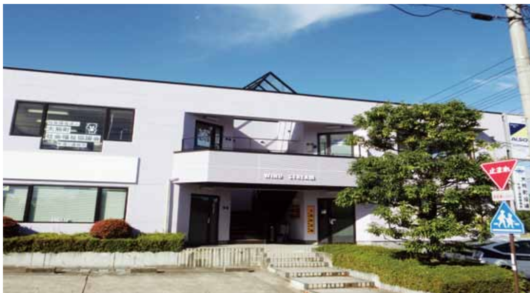
活用しよう 中通り連絡事務所