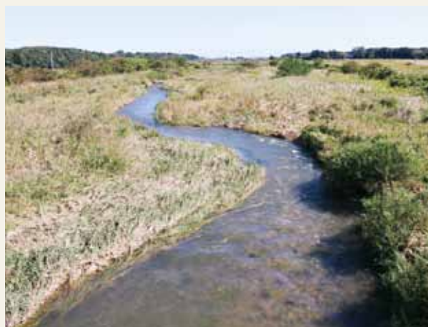
川のセシウムは検出限界値以下 行津橋付近

放射性物質による人体への影響が懸念されるため、空気中、土壌中、水中（井戸水・河川）に含まれるセシウム、ヨウ素を中心に放射能分析を行いました。