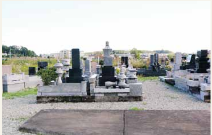
きれいになった墓地に墓まいり 鈴内墓地

町内33カ所の公営墓地の除草、倒壊の恐れのある墓石を崩れないよう仮置きしました。併せて環境省による除染も実施しました。