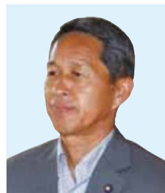
伊藤 昌夫 議員