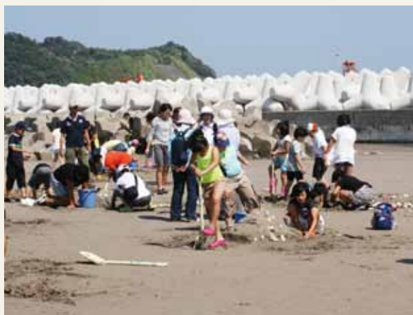
仲間とサンドアート いわき市四倉海岸