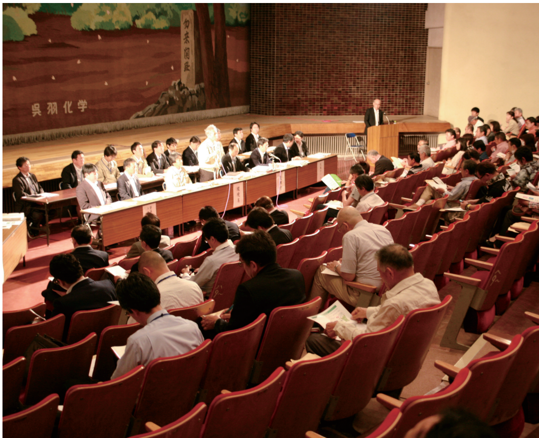
地権者に響かない説明会

現在、町は相談窓口を設置しており、環境省も県内4力所に相談窓口を開設している。その上で事業主体の環