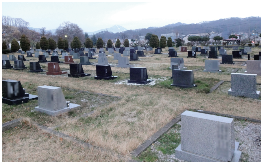
整然と並ぶ霊園墓地

伊藤 中間貯蔵施設建設予定地や帰還困難区域内に墓地を所有している方々から、自由にお墓参りできる場所に共同墓地建設の要望が数多く寄せられている。これに対し先般町から、大川原西平地区内に建設される予定地が示されたところである。建設するにあたっては、四季折々に花が咲き墓石もコンパクトで景観にも優れる洋風タイプの墓地公園建設を提案する。 最近墓地に対する考え方、価値観も大分変わってきているが、先祖を敬い感謝の心で供養していく気持だけは持ち続けていきたい。早期建設はもちろん大事だが、永代にわたって使用する墓地だけに町民がどの様な墓地を希望しているのかを見極めることが重要であ