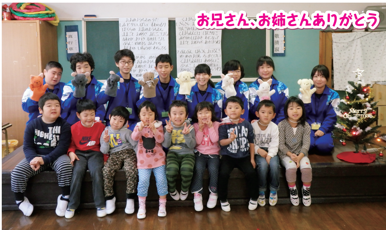
楽しかったよ～指人形劇（幼稚園、中学校の交流）