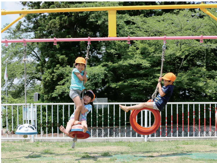
町の宝 子どもの未来をどうまもるか