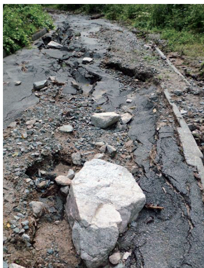
大雨で三森山林道が流されたため復旧します。 住民のため速やかに復旧