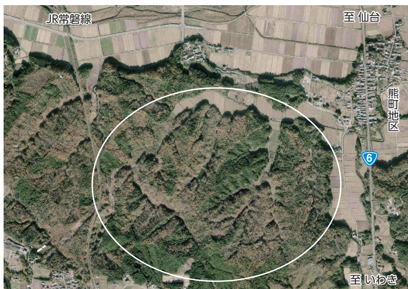
有効活用が期待される旧ゴルフ場跡地

平成28年度に調査に関わる予算を計上すべきかは、内部でよく検討しながら前向きに考えていく。