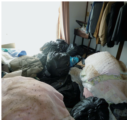
早く処分して 家庭内のごみ