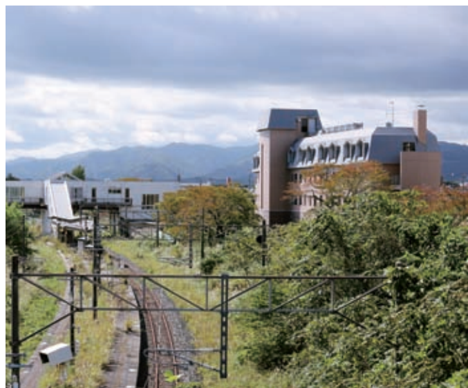
町の玄関の復興はいつになるのか