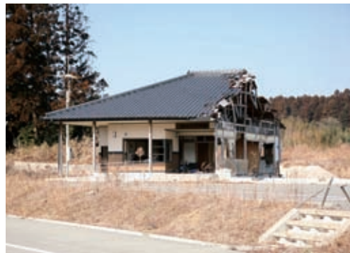
津波被害にあった建物 住宅再建が進むことを期待