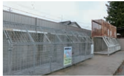
下野上3区のステーション