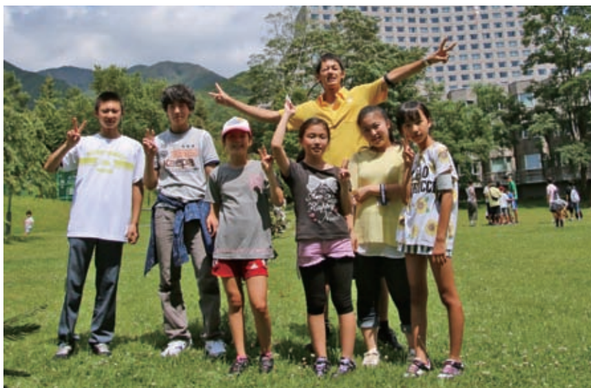
まちづくりは人づくり