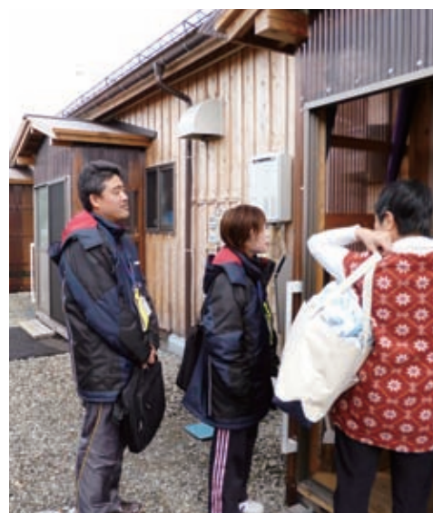
おかげんはどうですか

これ以上悪い事態にならないよう大熊町においても復興公営住宅に住む1人暮らしの男性に対し血圧を週1回測定するとか、住民の 色んな対応をしながら、みなさんが健康で一生生活できる仕組みをしっかりと作っていきたい。