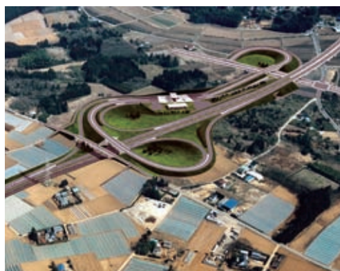
ふるさとが身近に