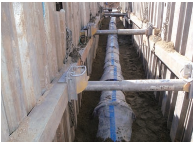
大川原地区下水道 まもなく復旧