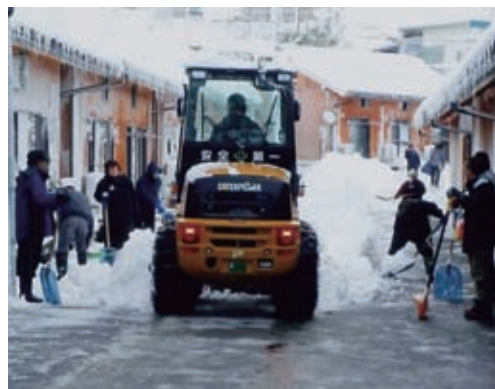
去年は大雪だったのに