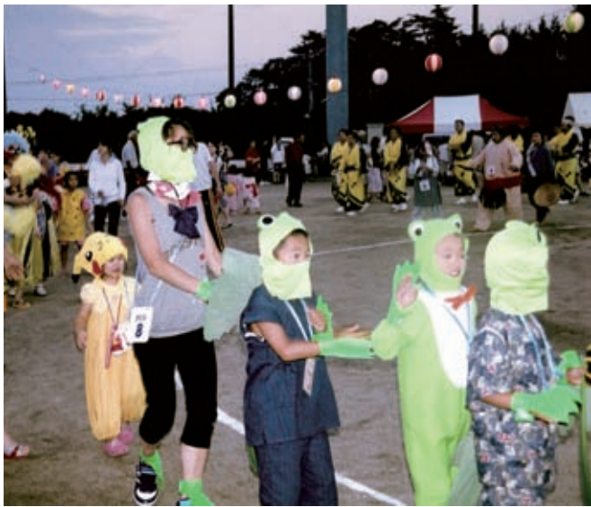
町の盆踊りを復活させよう

町長 ふるさと祭りの参加者は減少傾向にある。これで良いのかと言つ意見もあるが、それを楽しみに関東圏や北の方からも「皆さん