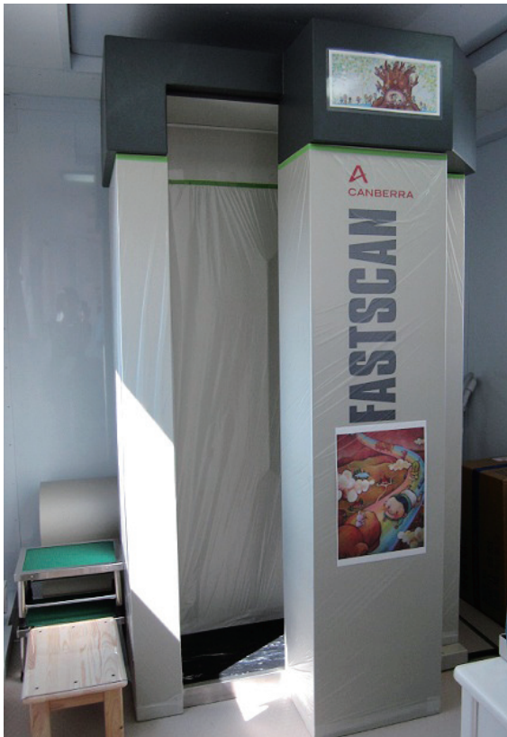
ホールボディ ふたば復興診療所では無料

答 下水道管工事に必要な資材調達の遅延により約1カ月遅れた。4月中には完了する予定である。