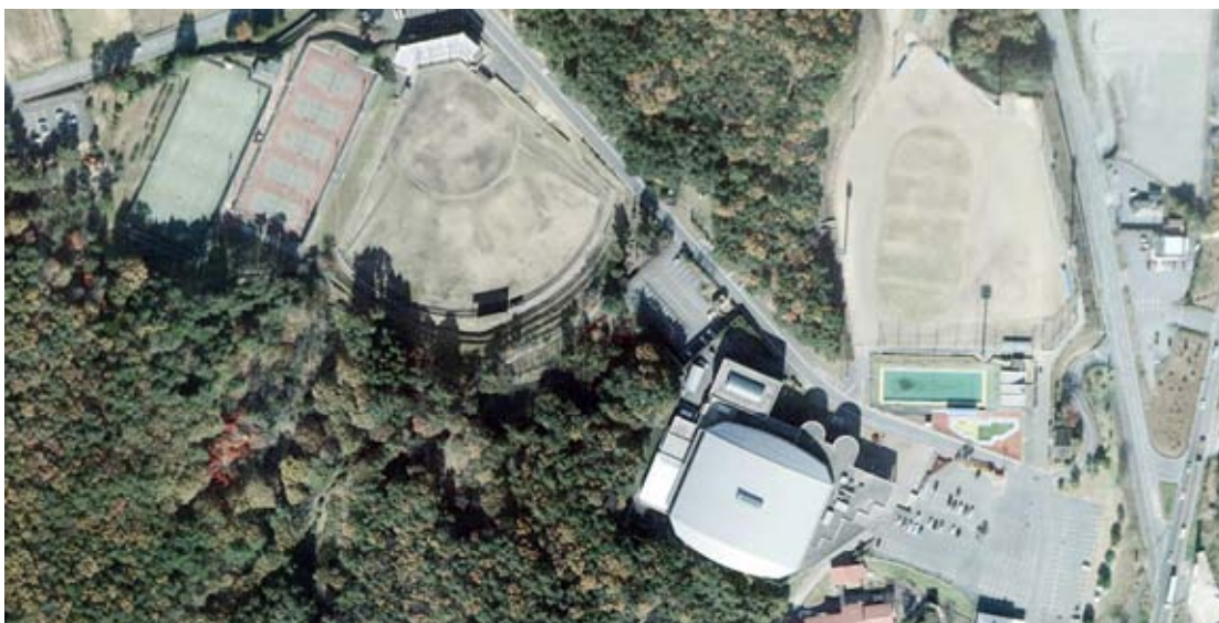
魅力ある町づくりに必要な施設を