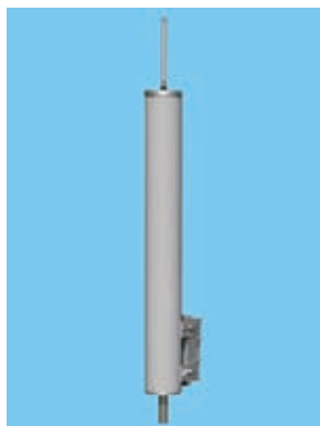
快適な生活のために

復興拠点の大川原地区は、従来から電波の入りが悪く改善を求められていたため、拠点整備にあたり町道67号線東側に親局を設置するものです。