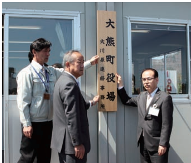
4月5日に開設されました お立寄りください

答 仮設住宅には定期的に訪問している。支援が必要な人も多数おり地域包括支援員が対応している。