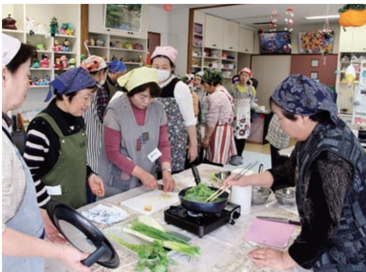
我が家に新しいメニューが増えました