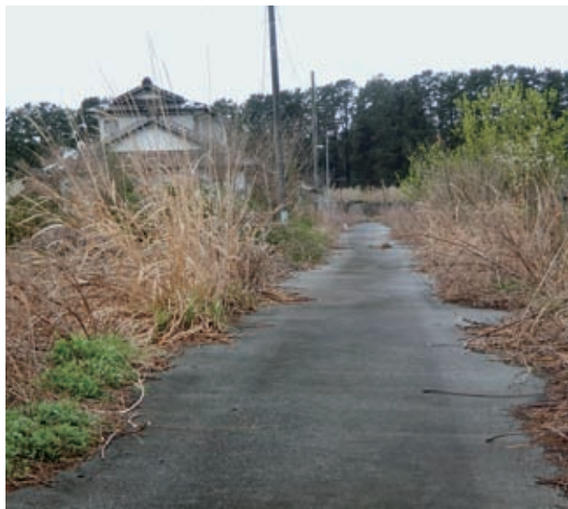
この状態では復興なんてとても

興・復旧計画に大幅な遅れが生じている。大熊町での生活再建を望んでいる方、時々戻りたいと考えている方々に道筋を付けるためにも、早急な除染の実施をすべきではないか。