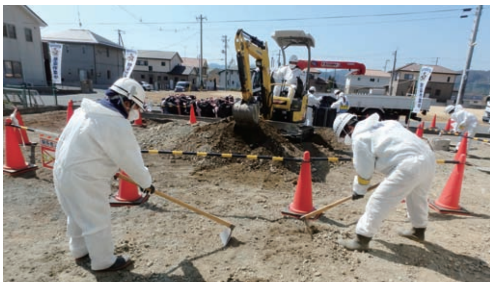
やはり除染するときれいになるね

庁、内閣府、環境省と調整中である。引き続き400軒の全域の除染を実施するよう、国に対して強く要請していく。