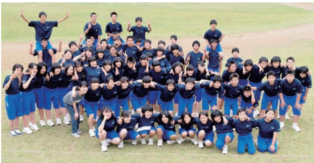
町の将来を担う子どもたちのために