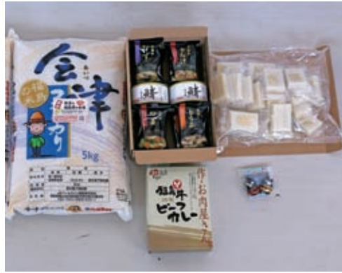
今年は何が届くのかな