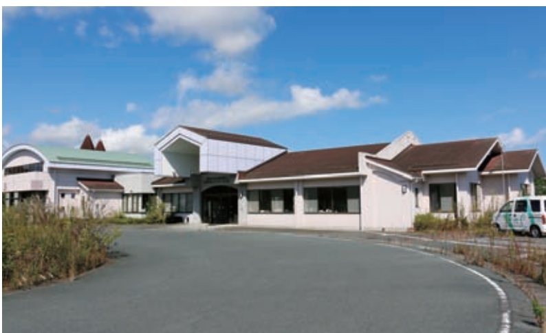
施設を待ち望む町民は多い 早く設置を

を支える生活支援体制の整備と地域密着型介護老人施設の整備を、平成30年度を目標に取り込む。