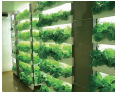
変更された野菜工場