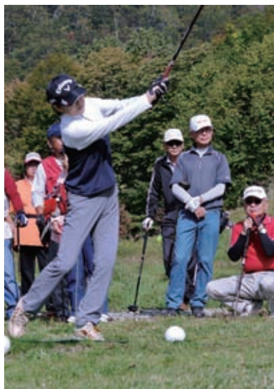
交流にも活用できる補助金