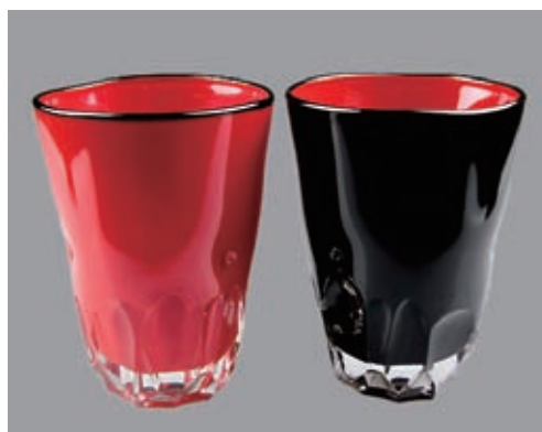
県産品を活用しよう