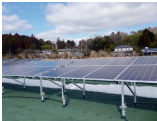
大川原地区で稼働した太陽光発電