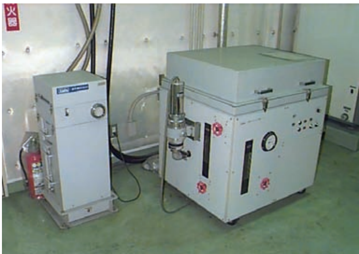
一時帰宅も不安なく 放射性物質を常時監視