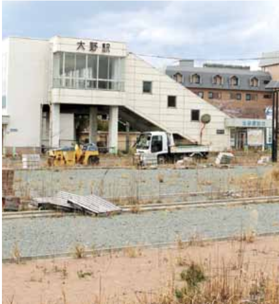
復興へ駅の復旧は欠かせない