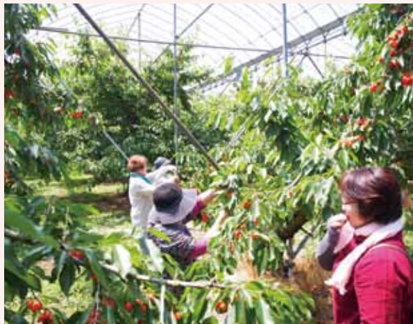
さくらんぼ狩りへお出掛け