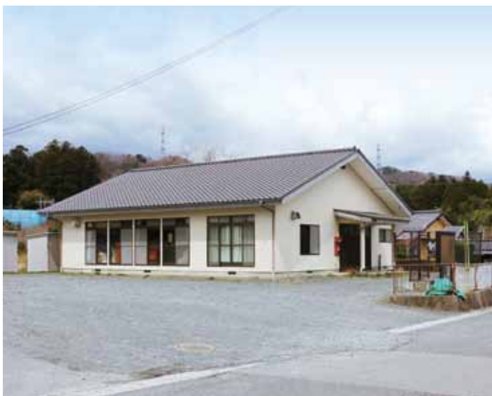
多くのお客さまがまっています