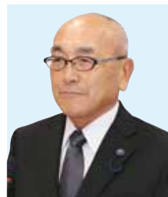
廣嶋 公治 議員