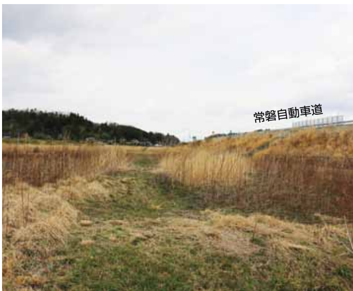
IC用地購入は進んでいる

答 設置したばかりで測定数値にばらつきがあり調整中である。落ち着き次第連携をとりたい。