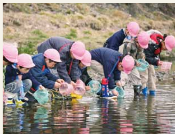
大きく育て 子も鮭も