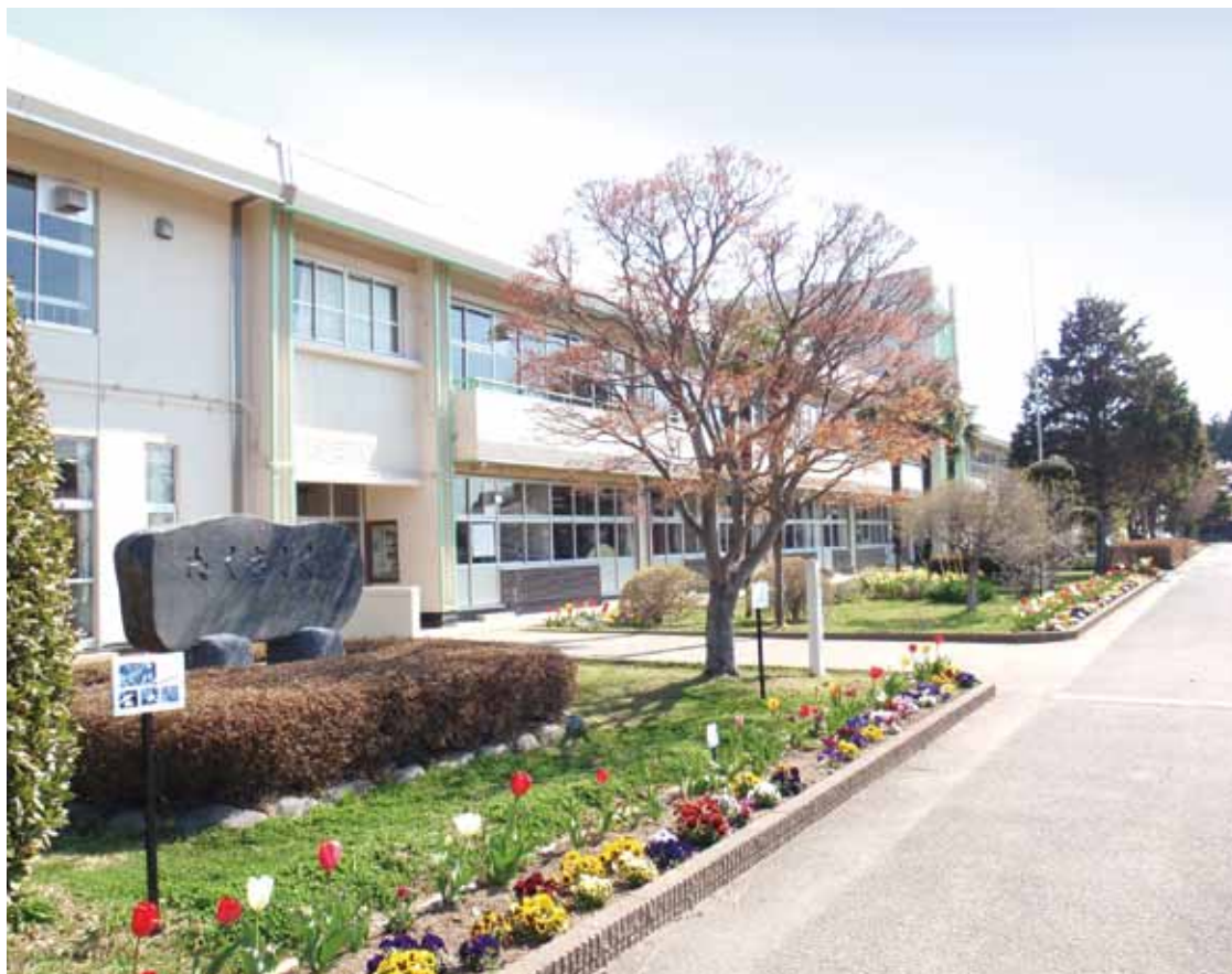
きれいなまま保存は可能か