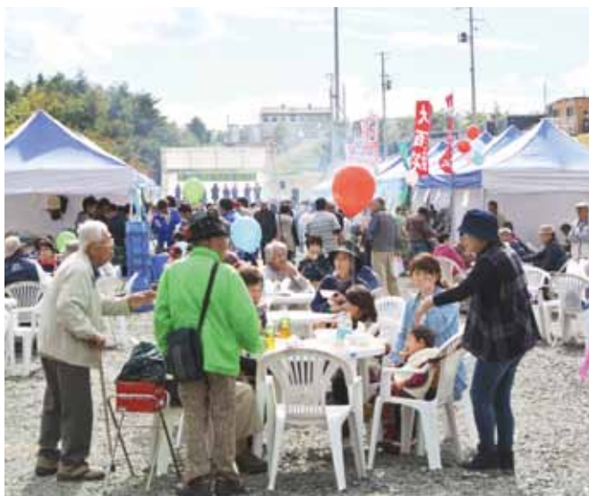
以前は盛況だったが…