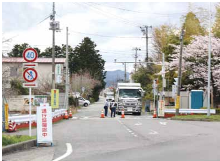
三角屋交差点につなぐ最適なルート