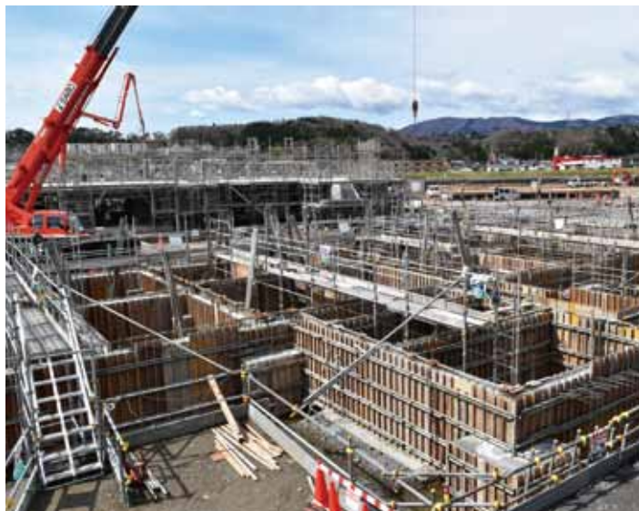
早い入居が待たれます