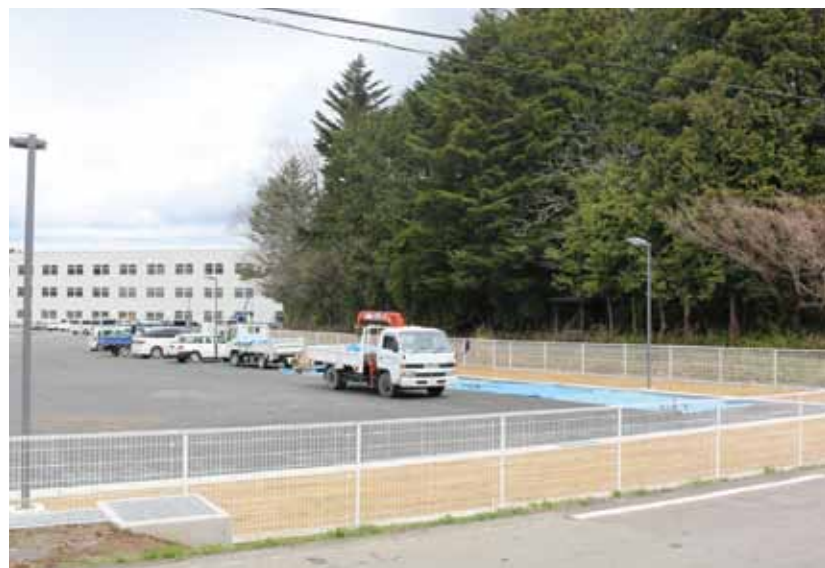
隣接する部分が課題だ

環境省と協力しながら進めて行く。 2. 山林内の未除染区域については、環境省に再三にわたり要望しているが、除染区域外で実施することはできないとの回答である。 屋敷林や里山の未除染区域は、清掃という形で実施することはできるが、環境省が事業主体でないことにより、廃棄物の処理先の確保が問題となる。 国に対しても他の機関とともに、廃棄物の処理についての対応を要望している。 3. 帰還困難区域の境界付近に居住する町民や事業所の住宅、事務所周辺の除染については、「避難指示解除準備区域および居住制限区域に住民が安心して帰還できるようこれらの区域の宅地に隣接する部分についても国は