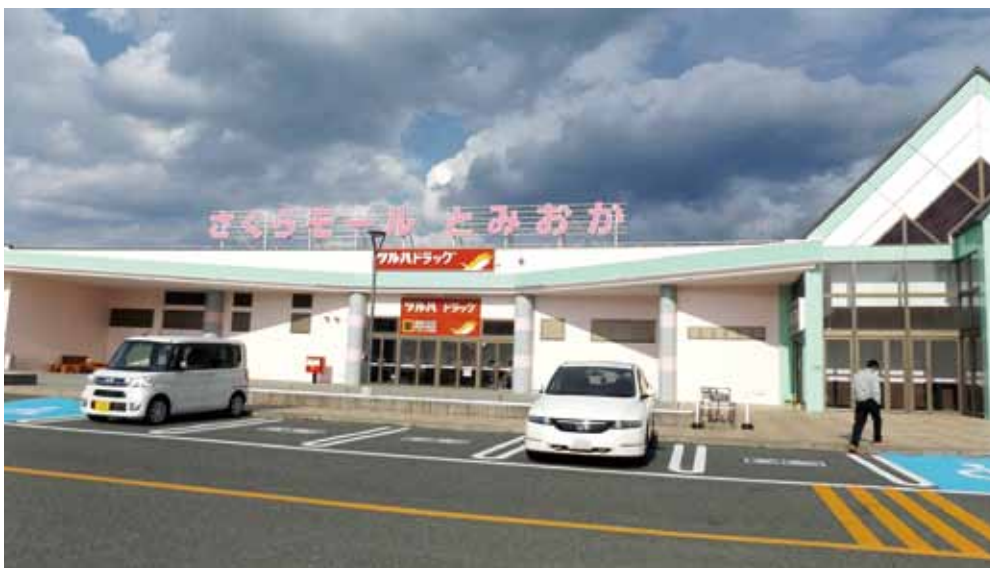
買い物ができるお店は大事です

基金等の様々なメニューがあるので事業展開にあつた制度を有効に活用して頂きたいと思う。