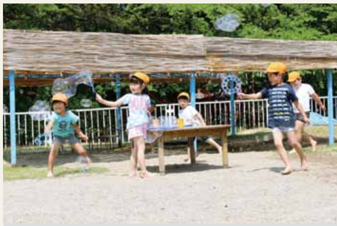
将来を担う子ども達へ

平成23年3月12日以降の転入者、出生者のうち結婚祝金および出産祝金支給条例に該当している町民に、平成29年度～平成37年度まで年間5万円を支給する支援策です。