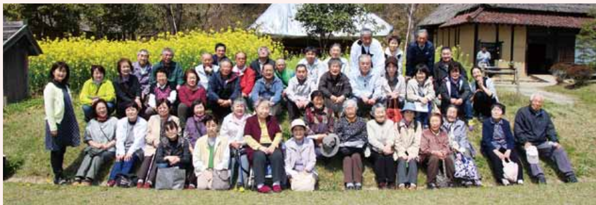
いわき伝承館にて ハイポーズ!!