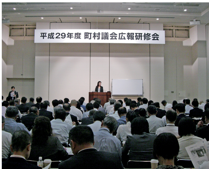
長い文章は伝わらない

平成29年9月28日、全国町村議会広報研修会に参加しました。 伝える広報から伝わる広報へ、電子広報なにがどう変わってきたか、議会広報コンクール優秀賞受賞誌から学ぶの3講演を受けました。 ①長い文章は伝わらない、短く書くこと。 ②難しい言葉を使うと読まれない、常用漢字を使いひらがなを多く使用する。 ③余計な情報は入れない、シンプルに伝えたいことを書く。 今回の研修を活かし町民のみなさんが読むことを意識し、伝わる広報を目指します。