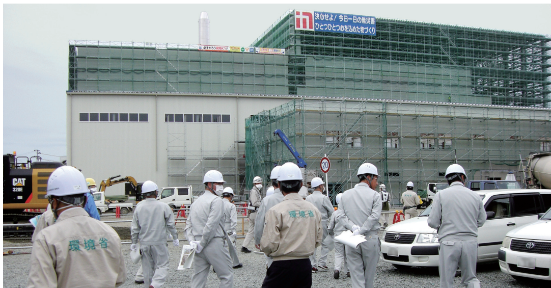
完成間近な仮設焼却炉 早期の運用が望まれる

平成29年7月27日、会津若松出張所において環境省より中間貯蔵施設の現状について説明がありました。その説明を受け10月6日に現地視察を行いました。 主な質疑内容を報告します。