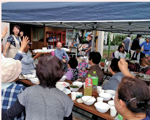
ゲームで笑いがたえない