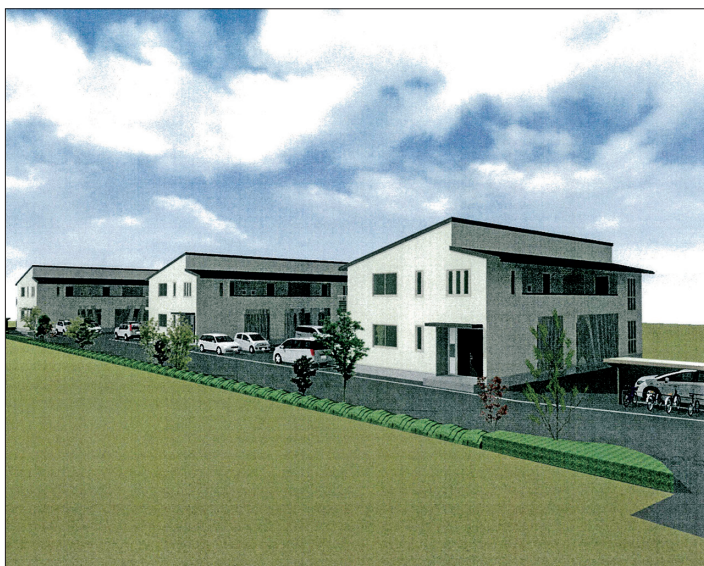
安心して生活できる宿舎をイメージ図

月に2回の会議を開催するとともに、ワークショップ（体験型講座）や新しい町づくりの先進地への視察などを実施してきたが、自分たちで町を創っていくとの意識の高まりを感じる。