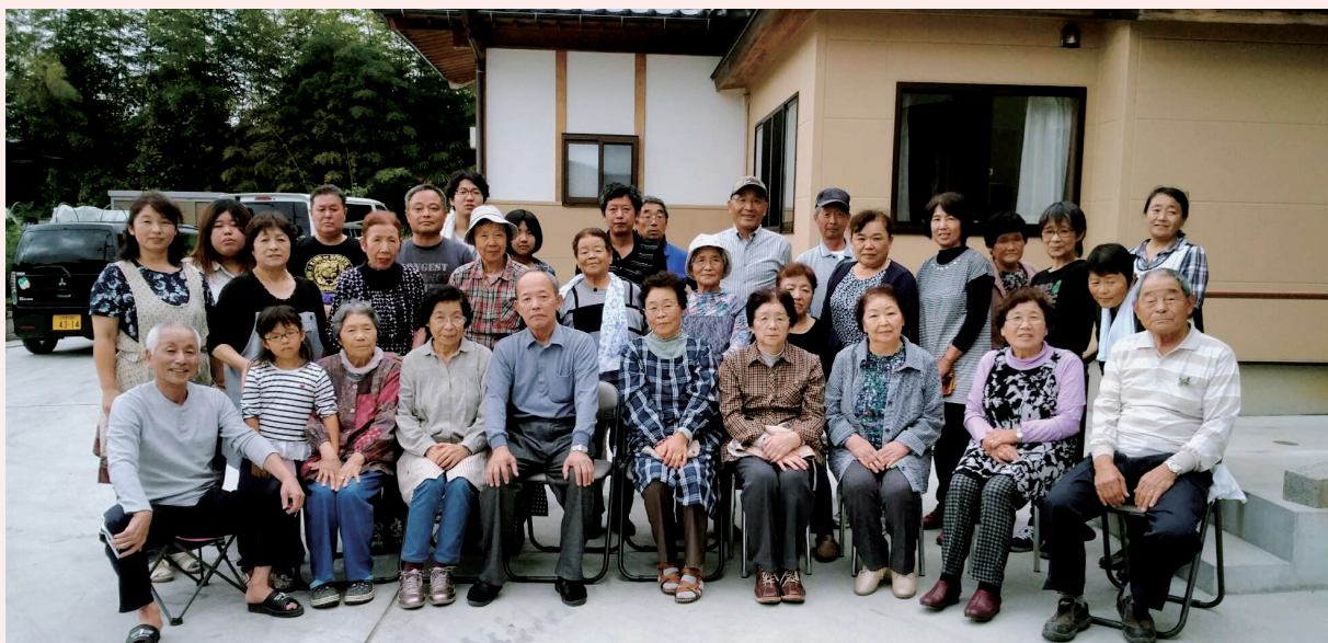
みんなで良い会にしましょう