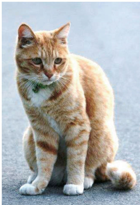
ペットも家族です

町長 震災直後すぐに帰れるものと思い、着の身着のまま避難したためペットを連れ出すことが出来なかった。現地にそのままにされ行方不明や餓死するなど動物にとっては厳しい状況であった。牛に関しては畜舎での餓死、放射線の関係から放れ牛となっていた。家族同様に育ててきたペットや家畜の供養のためにも鎮魂碑の建立を検討していきたい。