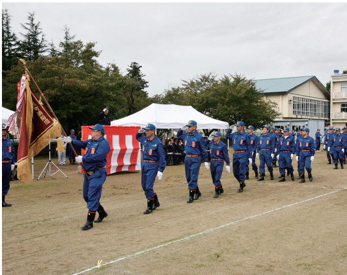
町の治安を守る頼れる消防団