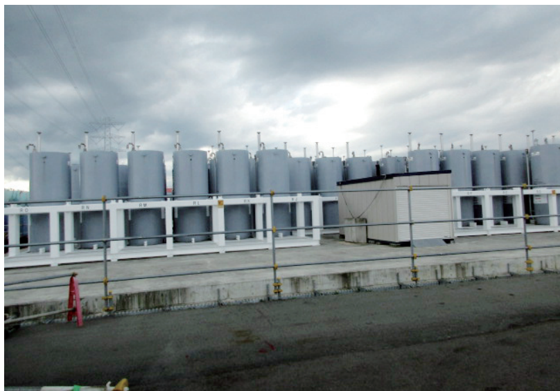
汚染水は長期的な課題