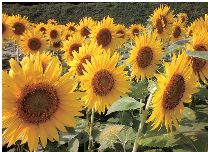
多くの町民が参加できるプロジェクトに