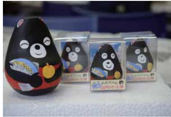
震災後につくられた「おおちゃん小法師」

町民の絆の維持、生きがい作りを目的に平成27年から始まったのが、会津地方の郷土玩具の起き上がり小法師に町のキャラクターであるクマの「おおちゃん」の姿を絵付けした「おおちゃん小法師」の作成だ。デザインは約200点の応募の中から、大熊中学校の生徒の案を採用し、町民の有志が絵付けしている。完成品は震災後、町に義援金や支援物資を送ってくれた人々への感謝の品としてプレゼント。平成27年3月から4月にかけてイタリア・ローマで開かれた「東日本大震災復興支援・起き上がりこぼしプロジェクト」ローマ総合展にも出展された。絵付け会は町民同士が顔を合わせる機会となっている。平成28年からは販売も開始している。