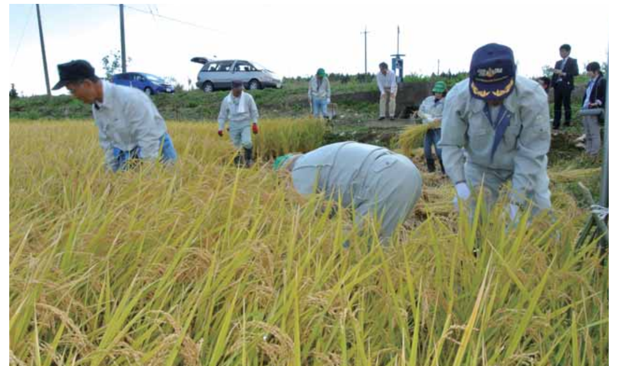
試験田で育てた稲を刈り取る農業関係者

大熊町商工会の会員数は、震災の前後で大きくは変化していない。大熊町商工会によると、平成28年4月の時点で事業再開を遂げた事業者数は161社59.6%（平成28年10月現在）。場所はいわき市が多いが、これから事業の再開を希望する会員には双葉郡での再開を望む事業者も多く、町内での事業用地整備への期待は高い。