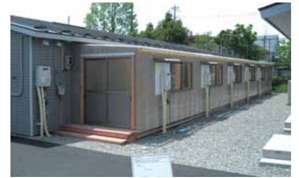
会津若松市内で最も早く完成した東部公園仮設住宅

また、田村市などの避難所に残った町民は、田村市の就業改善センターに集約され、17世帯42人が避難生活を送った。入所者数は徐々に減り、8月8日にセンターは避難所としての役目を終えている。