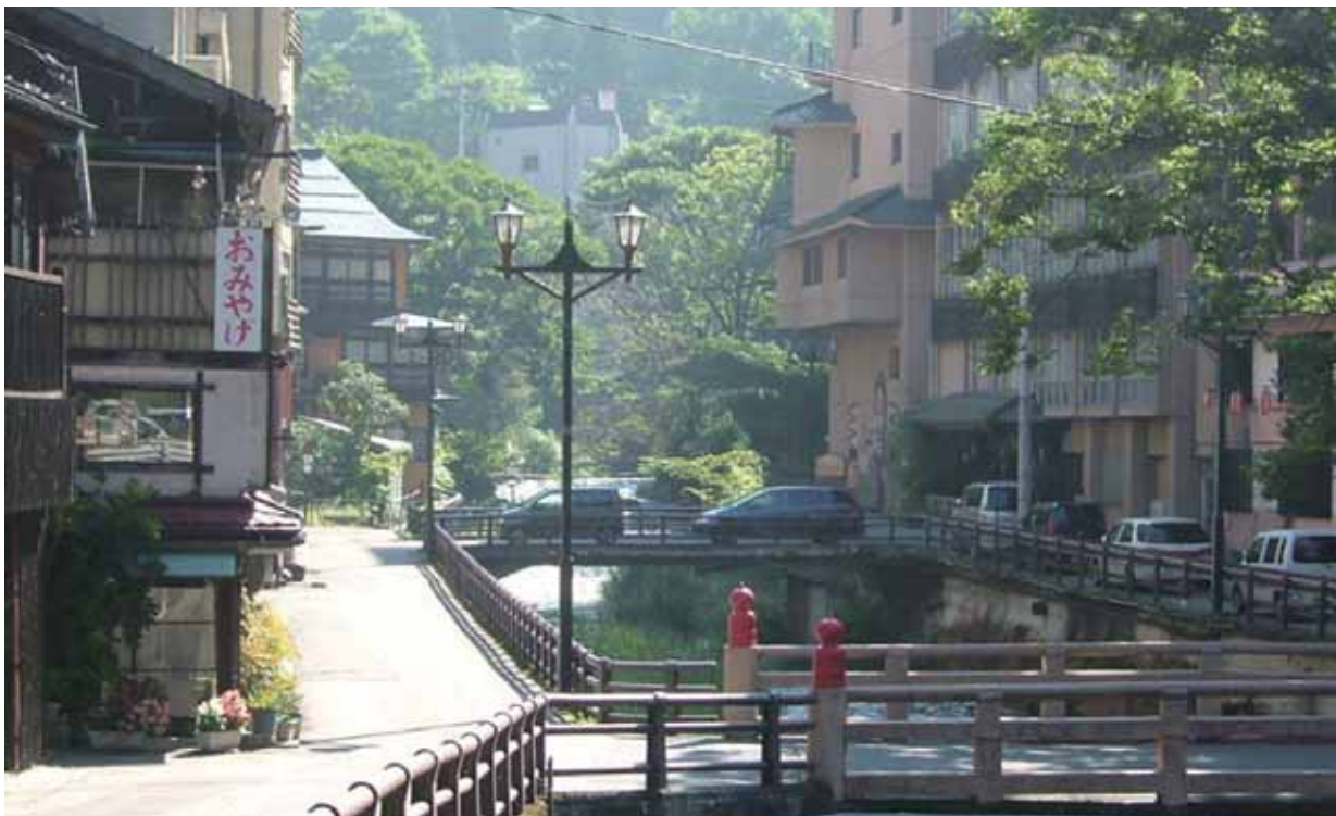
多くの町民の二次避難所となった東山温泉

問い合わせは宿泊施設側からもあった。「町民の退居により空き室が出たが、町のために確保しておくべきか」という問い合わせや、町民の移動について「出て行ってもらっては困る」という苦情もあった。ただ平成23年夏ごろになって、震災後に激減していた会津地方への観光客が少しずつ戻り始めると、宿泊施設側から二次避難所の閉鎖時期について提案されることが増えてきた。職員は町民の意見を聞いて他の宿泊施設への割り振りを進めつつ、行き先の決まらない町民がいる限り