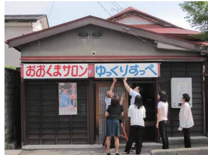
会津若松市内の町民憩いの場として開設した「ゆっくりすっぺ」

町の広報誌は、平成23年6月1日号から発行を再開した。7月以降は月に2回の発行とし、町長のあいさつのほか、一次立ち入りや保険証再発行などのお知らせ、各課の問い合わせ先電話番号などをまとめた。6月1日号は全4ページの簡易版だったが、徐々にページ数は増え、平成24年3月1日号では10ページまで回復した。