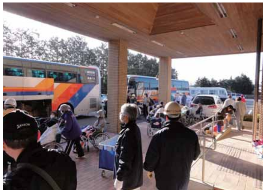
前日に避難した保健センターから町外へ避難するサンライトおおくまの入所者

保健センターに避難していたサンライトおおくまの入所者も避難を開始。茨城交通のバスのほか、施設の福祉車両も利用した。サンライトからの避難者約110人のうち、自力で歩いてバスに乗れる人は1割ほど。町職員も避難支援に入り、1人の利用者を2人がかりで抱えた。寝たきりの人を優先して福祉車両で移送したが足らず、寝たきりで体が曲がらない人は座席に寄りかからせるようにした。点滴、酸素ボンベなどが必要な人は医療器具を装着したまま乗せた。薬や布団など、前夜施設から持ち出した物も可能な限り積んだ。保健センターの避難も午前10時ごろに完了。施設側はその後、積み残ったストレッチャーや車いすを再度取りに戻る予定だったがかなわず、保健センターの前には避難後しばらく車いすなどが放置されていた。