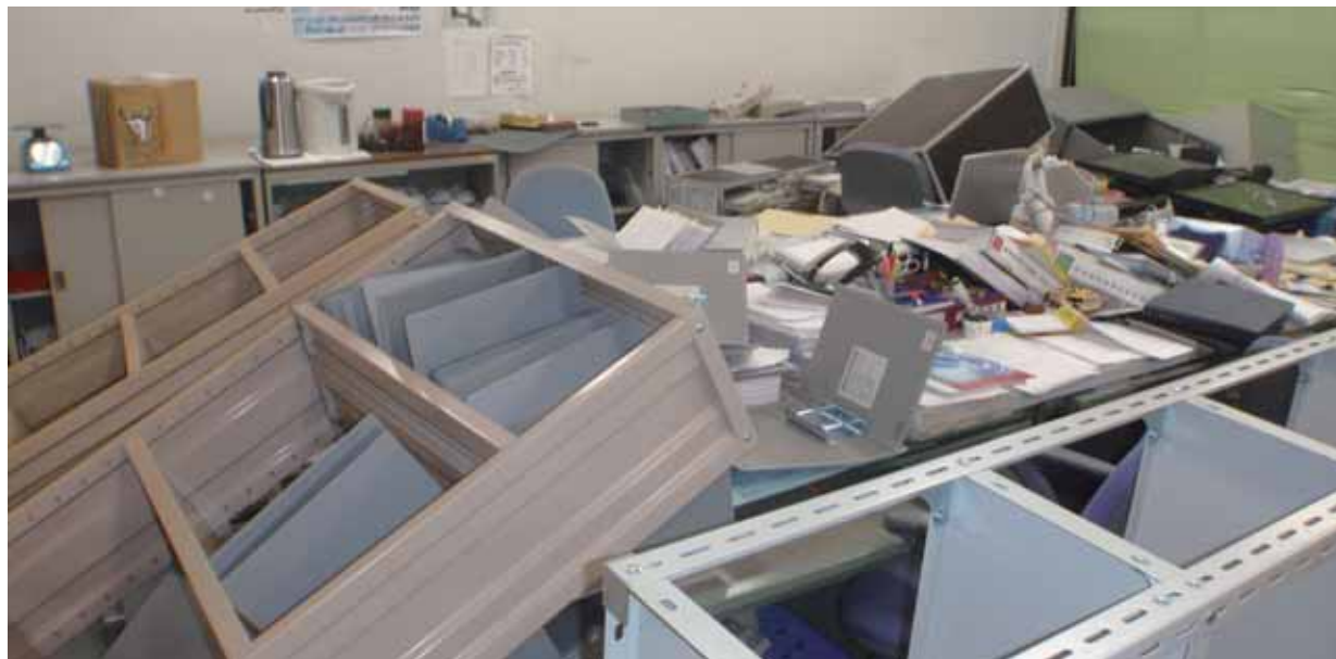
地震で棚が倒れ、物が散乱する町役場庁舎内

この日、町役場では3階正庁に確定申告会場が設けられ、数名の住民が会場にいた。議会は3月定例会の会期中で、午後には複数の委員会が開かれていた。地震発生時、多くの職員は揺れの大きさに驚きながら、机の下に潜り込んだり、棚やパソコン、テレビを押さえたりした。庁舎外に避難した職員は玄関前の舗道が波打つのを目撃した。地震により、庁舎は1階の天井が一部崩落し、2階の窓ガラスが割れた。あちこちで棚が倒れ書類が散乱。黒板や花瓶などが落ちたが、来庁者や職員にけが人はいなかった。