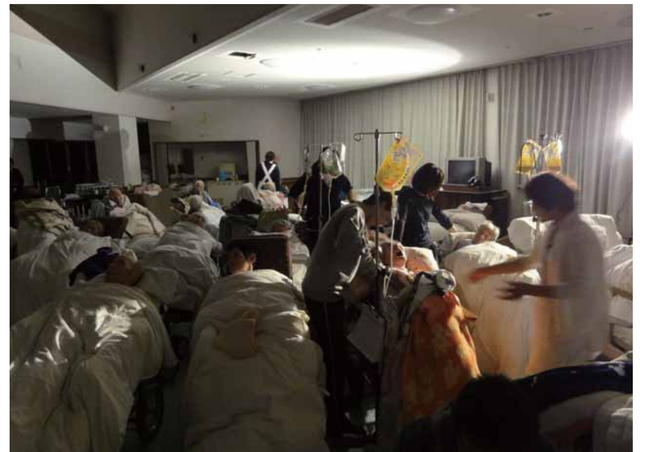
サンライトおおくまではホールに入所者が集められた

国が福島第一原発の半径3km圏内避難、10km圏内屋内待避の指示を出したのは午後9時23分。この国の発表に先立ち、複数の町幹部は連絡員となった東京電力社員から避難指示の内容を知らされ