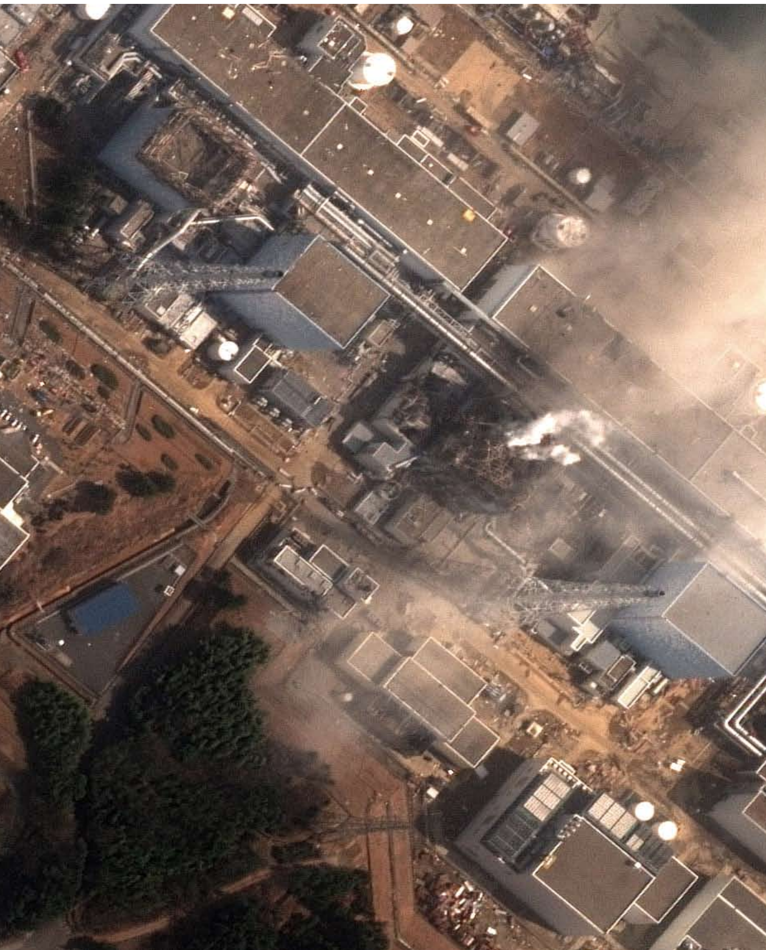
爆発後の3月14日に撮影された福島第一原発の衛星写真