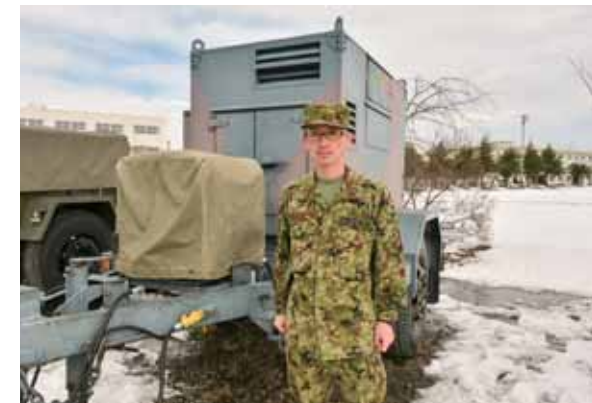
第6特科連隊第2大隊本部管理中隊 （郡山駐屯地）

※当時、2人とも陸上自衛隊郡山駐屯地の部隊に所属。平成23年3月11日夜～12日未明、自衛隊のどの部隊よりも早く福島第一原発に入った。現場の情報収集や放射線防護の対策がままならない状況下での派遣任務に応えた。