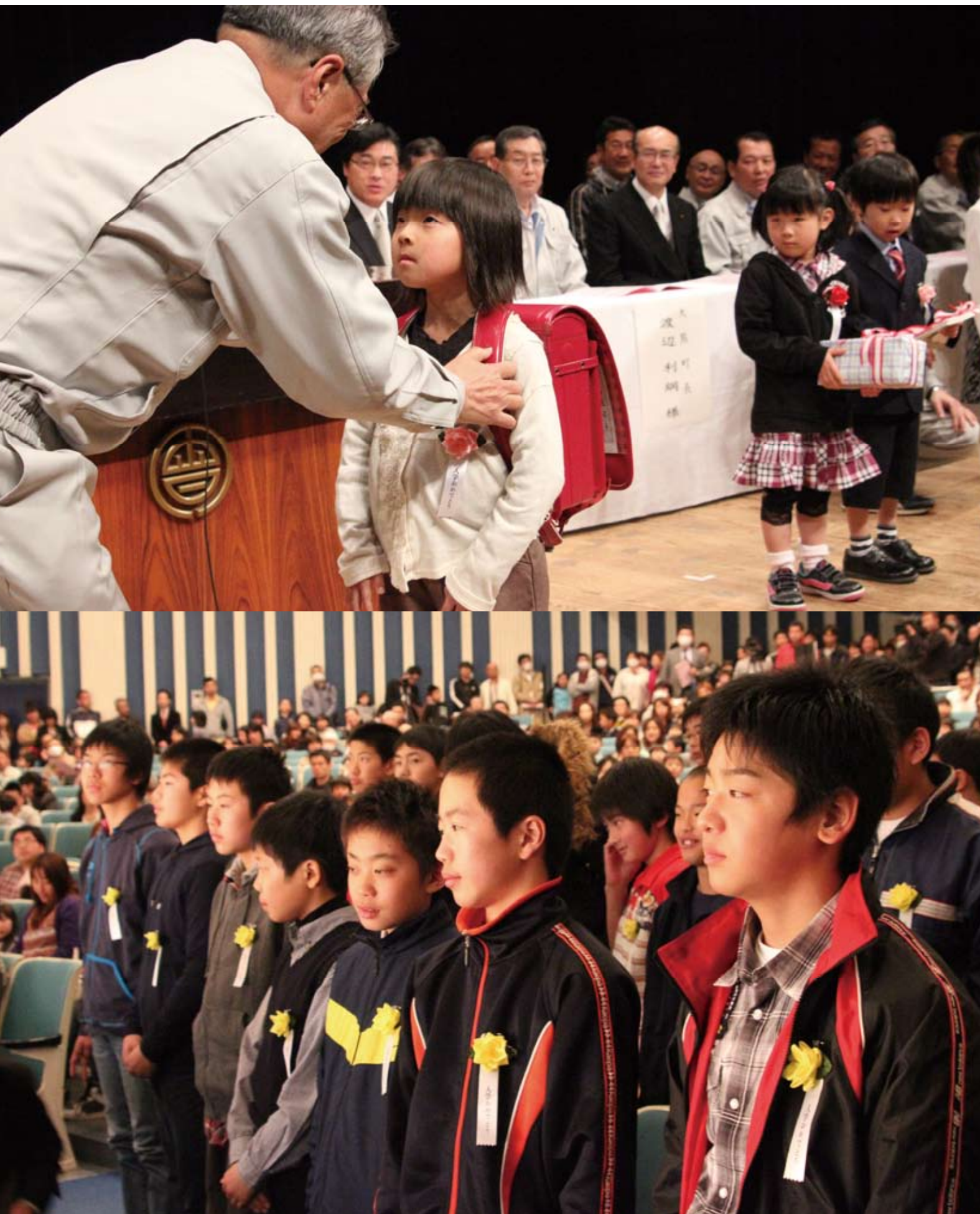
上:町立小中合同の入学式でランドセルを贈られる新入学児童 下:私服で入学式に臨む大熊中の新入生

そして震災から6年を迎える現在(平成29年3月)に至るまで、大熊町役場は同じ場所に出張所を構えている。