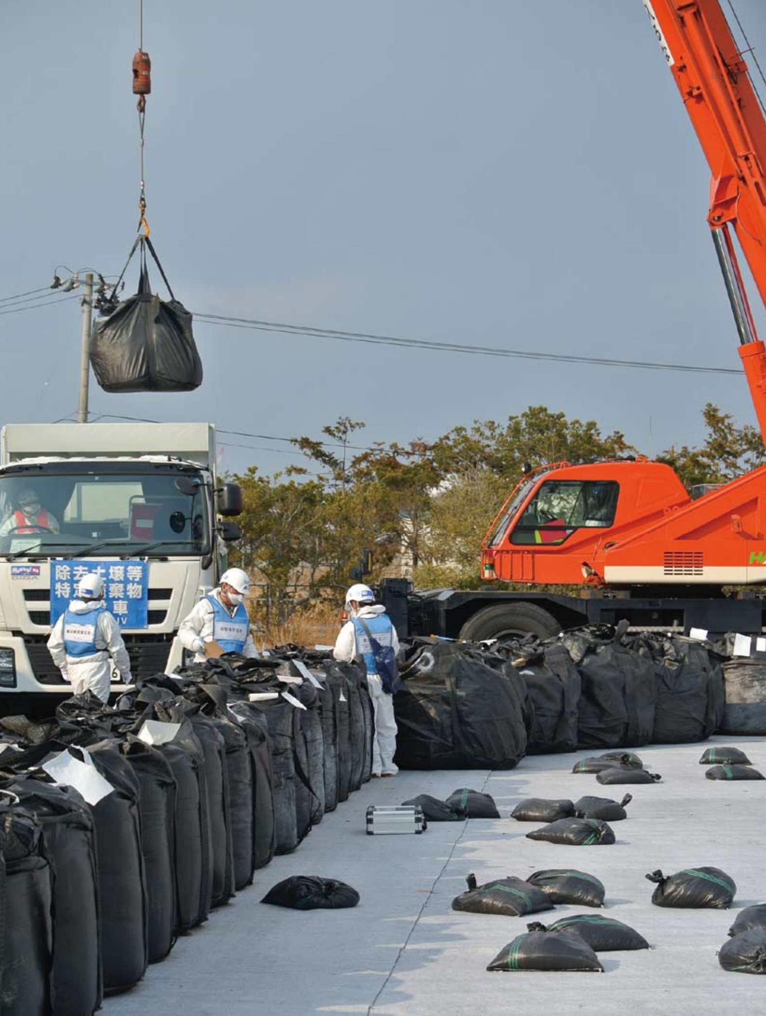
中間貯蔵施設の仮置き場に運び込まれる除染廃棄物