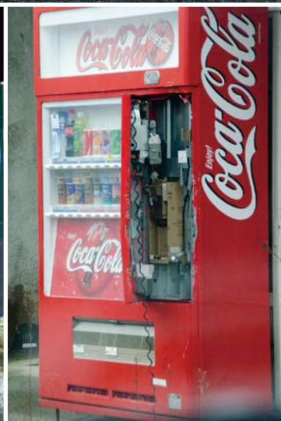
上:町内のダチョウ園から逃げ出し、無人の町をさまようダチョウ 左下:帰還困難区域への入り口で封鎖された国道288号 右下:何者かに壊され、中の現金が盗まれていた町内の自動販売機