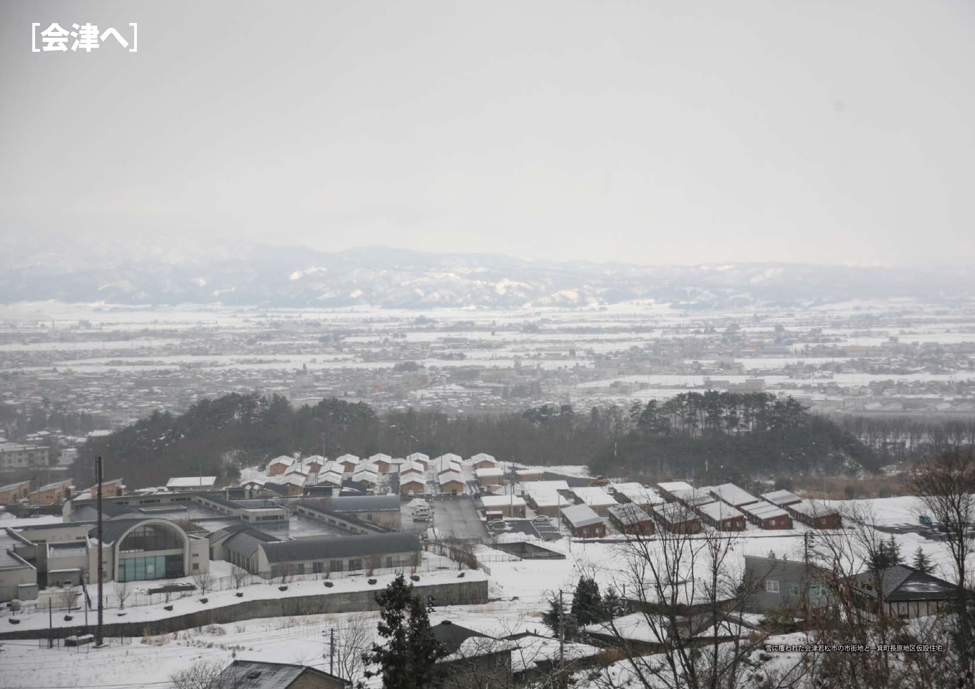
雪に覆われた会津若松市の市街地と一箕町長原地区仮設住宅