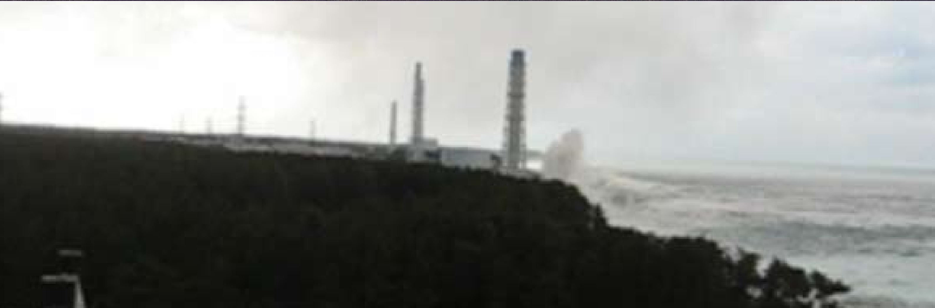
上:熊川の沿岸部に迫り来る津波。水平線のように見えるのは津波の壁 下:東京電力福島第一原発を襲う津波