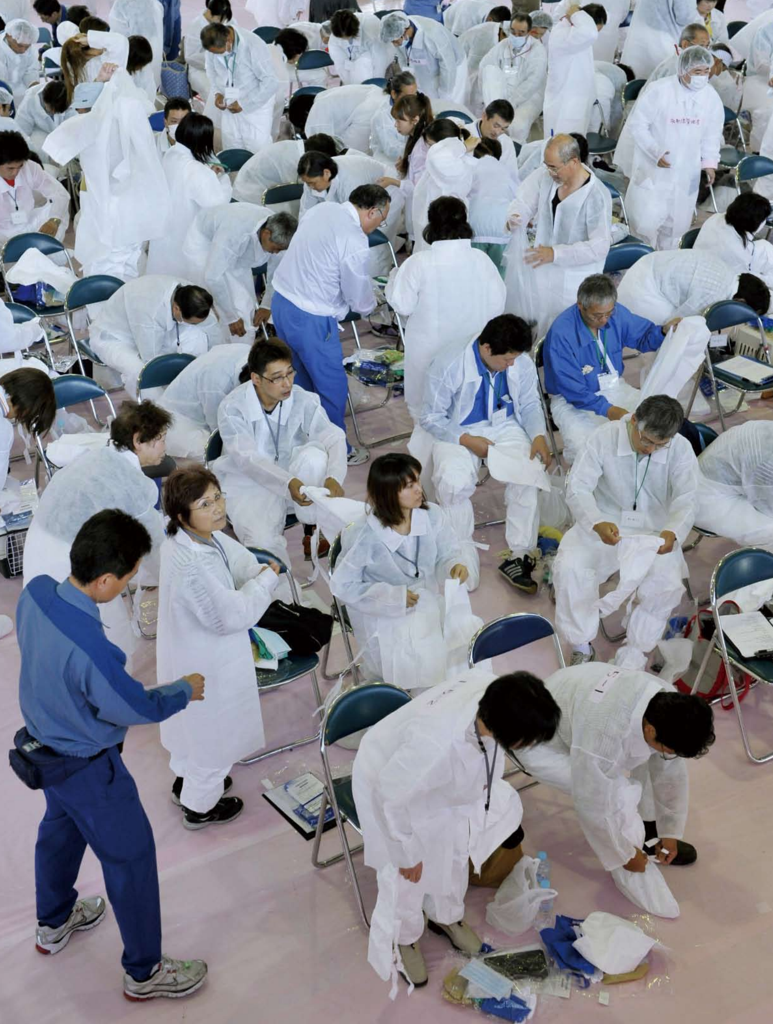
一時帰宅のため田村市の体育館で防護服を着る町民ら