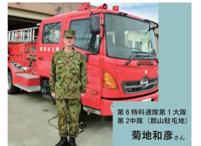
第6特科連隊第1大隊 第2中隊（郡山駐屯地）

菊地：そういう方たちが現場から戻るとソファのところで横になっている。少し会話すると「俺たちはもう先が