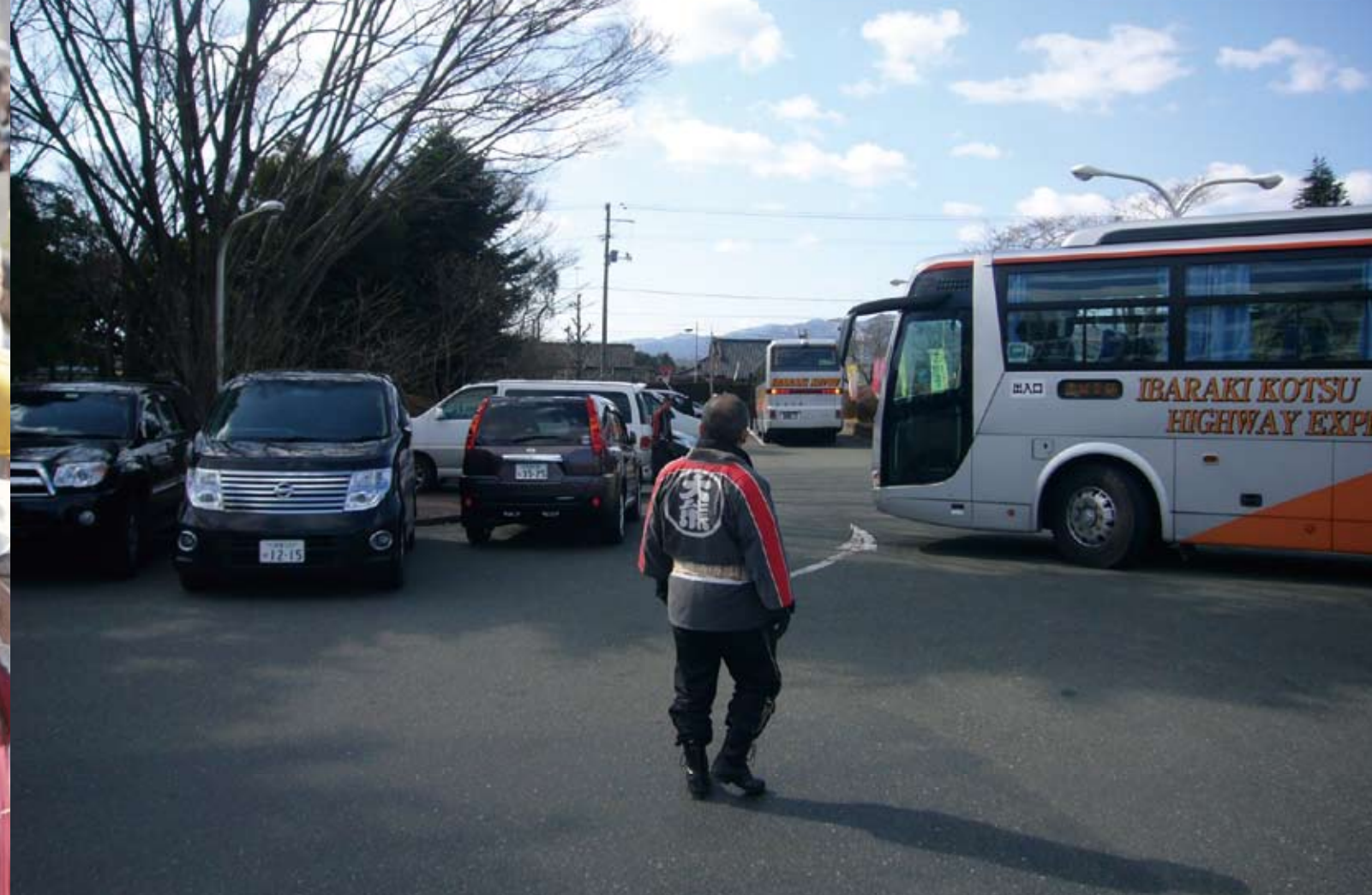
上:震災の翌日、町役場の駐車場に現れた茨城交通のバス 下:町民の避難誘導を終え、三春町の中郷小体育館で暖を取る消防団員