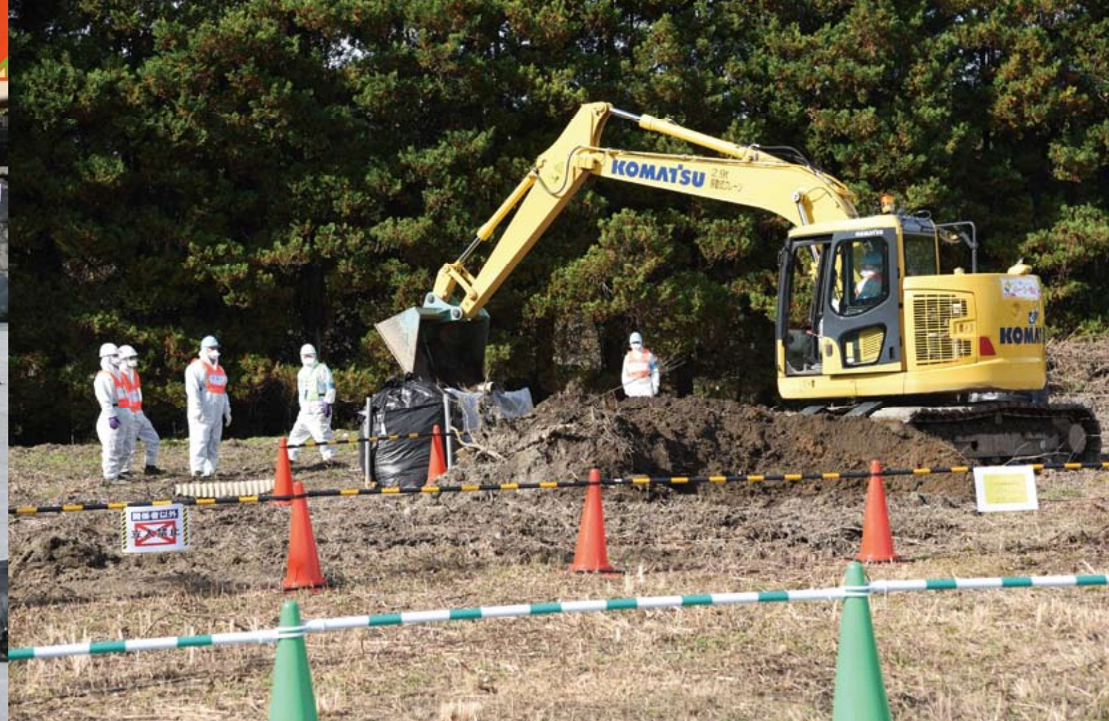
上:環境省が開いた住民説明会 下:町内で始まった中間貯蔵施設の本格施設工事