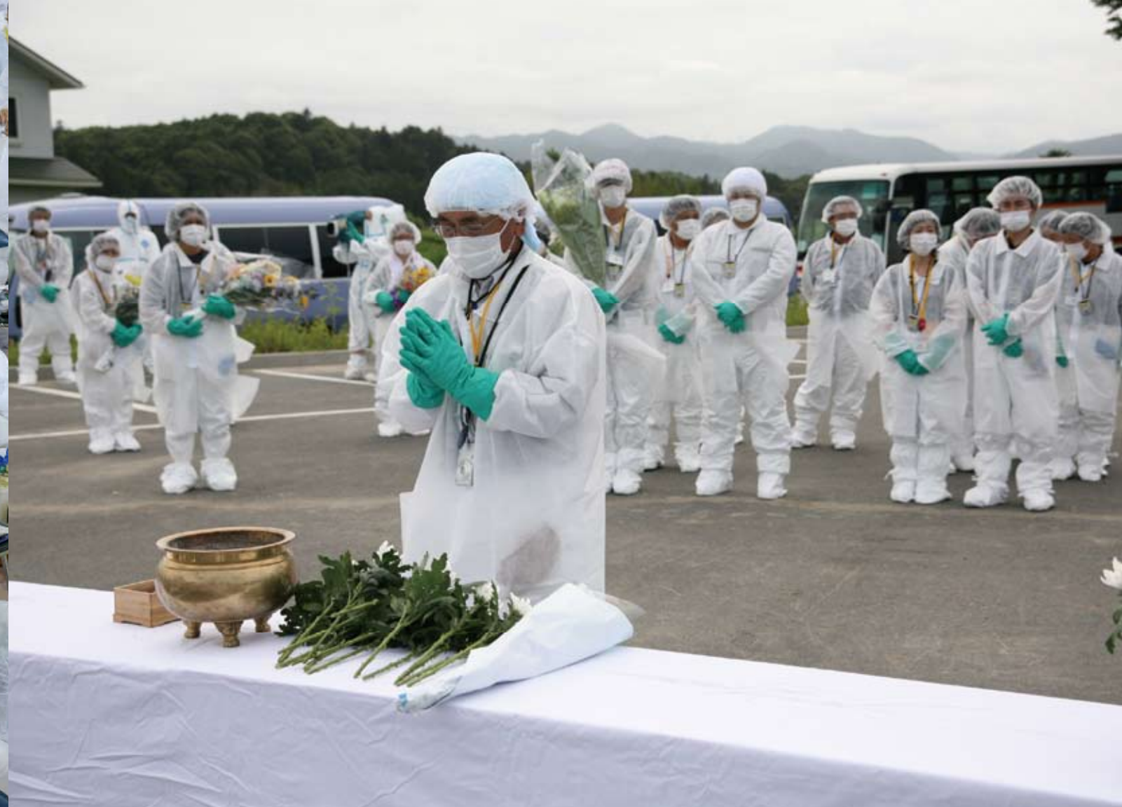
上：震災の4か月後に熊川地区で行われた津波犠牲者の慰霊祭 下：地震発生時のまま熊川小の教室に残されている児童のランドセル