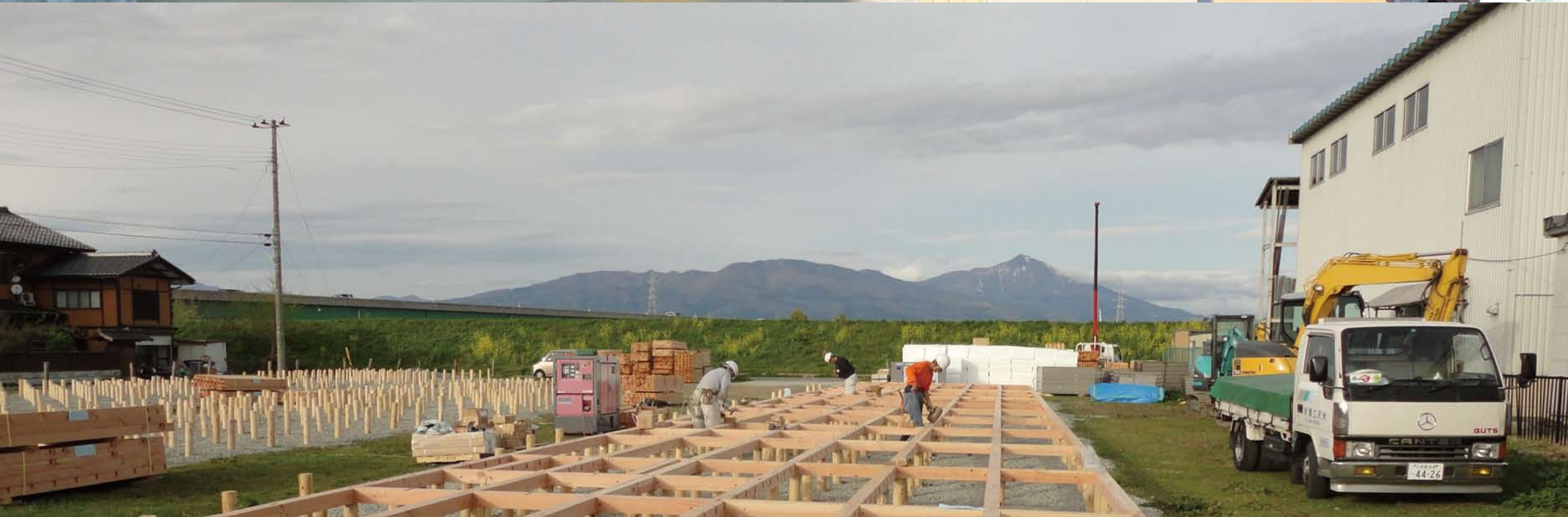
左上:会津若松市に開所した町役場出張所に入る町民ら 下:磐梯山を望む会津若松市内で進む仮設住宅の建設