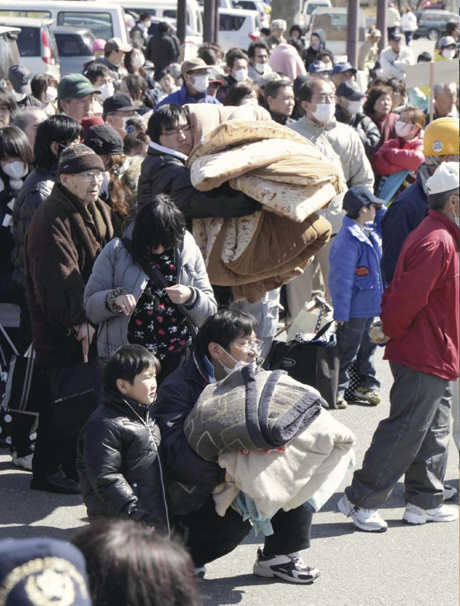
避難のため町役場に集合した人たち