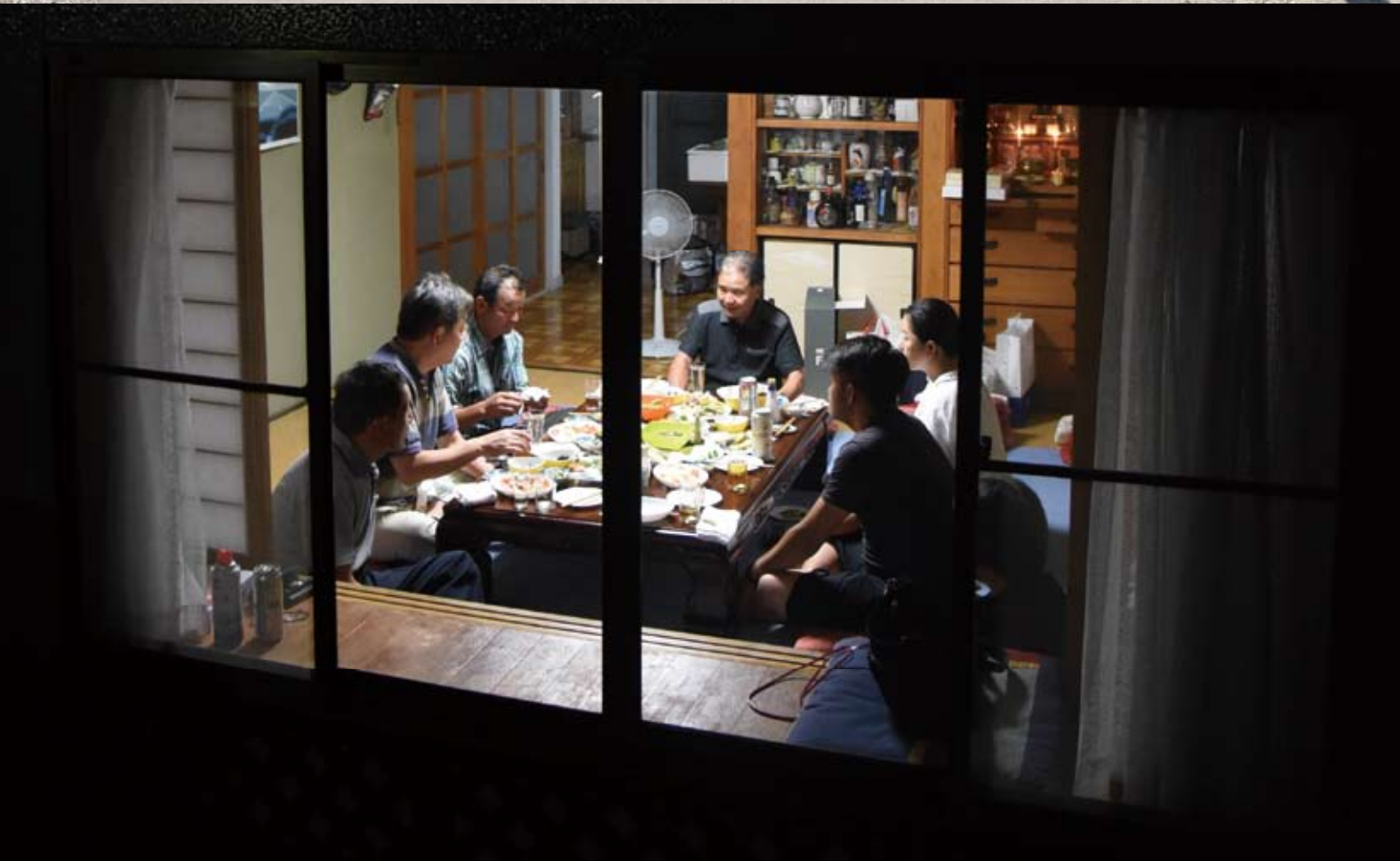
上：町役場大川原連絡事務所の開設を祝う関係者 下：特例宿泊で自宅に戻り、夜の団らんをする町民