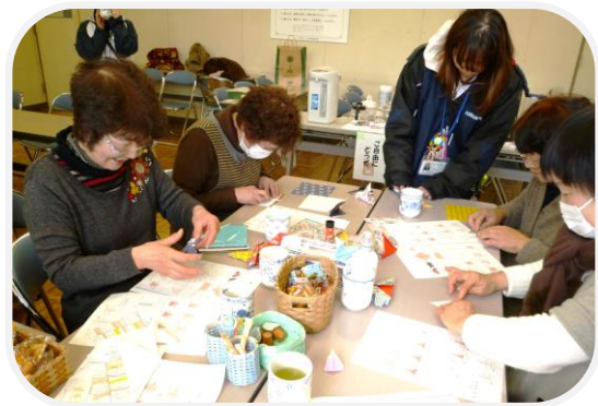
折り紙でおひな様づくり