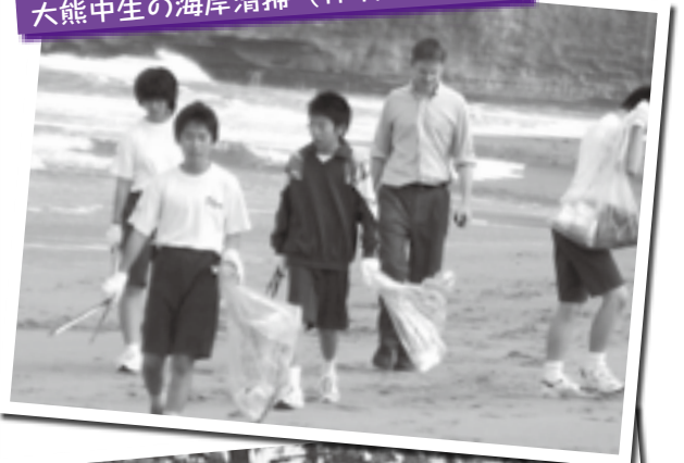
大熊中生の海岸清掃（H19・7・6）

※掲載する文章は、インタビューした内容をもとに記者が作成しますので、インタビューをお受けいただいた方が文章を作成する手間はございません。