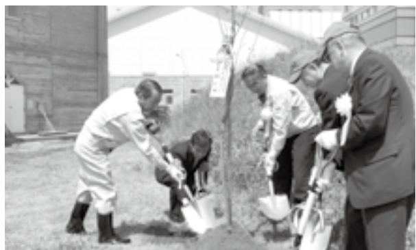
▲植樹を行う関係者

記念植樹には東日本大震災からの一日も早い復興と、子供たちの将来、地域の方々の助け合いの心がさらに広がることを願う思いが込められています。