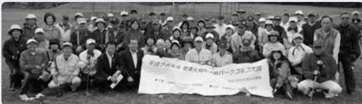
競技と交流を楽しんだ出場者

平成26年度春季大熊町長杯パークゴルフ大会は6月6日、北塩原村のグランデコリゾート・パークゴルフ場で開かれ、町民80人がはつらつとプレーしました。