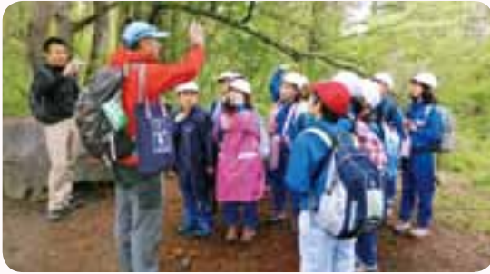
▲探勝路でガイドの説明を聞く児童

また、もくもく自然塾のガイドさんの案内で五色沼自然探勝路を散策しました。桧原湖まで約1時間30分の道のりは、時折小雨が降る天候でしたが、最後まで元気に歩きました。