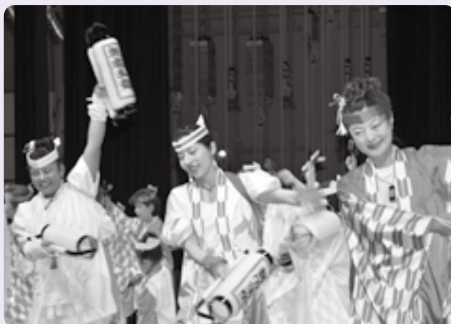
にぎやかに繰り上げられたステージ