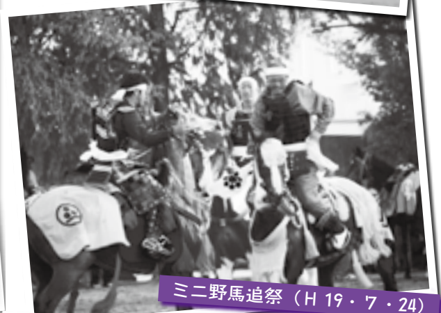
三二野馬追祭（H19・7・24）