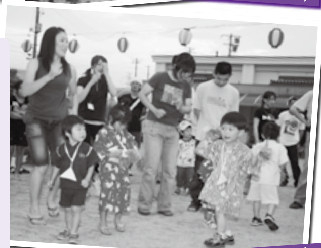
保育所夏の夜祭り（H19・7・28）