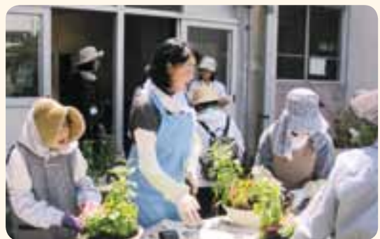
▲寄せ植えに取り組む参加者

第2回はいわき市で「親子でお菓子づくり」を予定しています。詳しくは「保健だより」の「各種教室をご紹介します」をご覧ください。