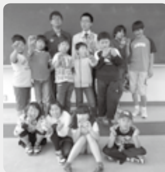
フレンドリー教室に参加している子どもたち

初回は会津若松市の町役場会津若松出張所で開講式を行い、自己紹介や活動の決まり事を話し合った後、活動で使う名札づくりに取り組みました。会津名産の柿の木を材料に、シールを張ったり色を塗ったりして、それぞれオリジナルの名札を完成させました。