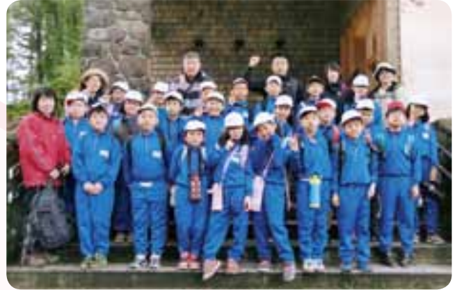
▲森林学習に参加した児童

森林の役割などを専門ガイドに案内してもらい、体験学習することを目的に開催されました。児童は裏磐梯ビジターセンターで展示物を見学したほか、保管されていた季節外れの雪に触れるなどして磐梯朝日国立公園の自然に理解を深めました。