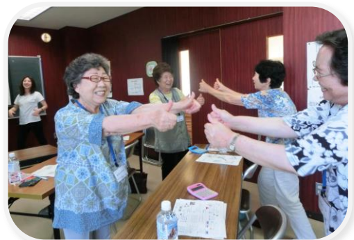
みんなで笑って楽しもう！