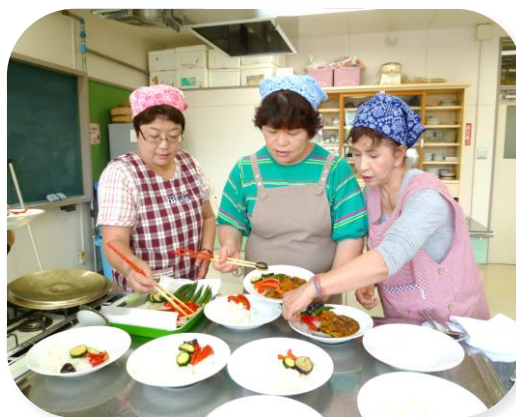
サロンで調理実習